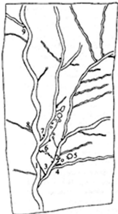
Рис. 2. Карта р. Коркодон с притоками (Иохельсон 2005б).

мысла, обмена и торговли, возможно, для военных и иных целей. В конце XIX – начале XX в. юагиры рисовали на бересте, по выражению В.И. Иохельсона, «примитивные географические карты». На картах этого речного народа показана гидросхема «кормящей» территории с прилегающими к ней землями (см.: Рис. 2). Например, прорисовано русло р. Колымы со многими притоками и озерами и торговые пути через Становой хребет (Иохельсон 2005б: 620, рис. 70а, б).