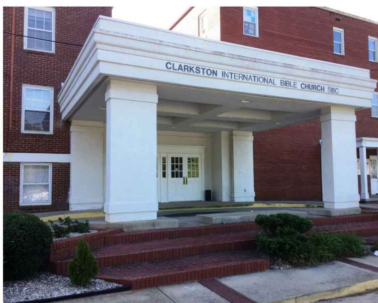
Рис. 2. Кларкстонская международная библейская церковь (фото автора, , , , 2.).

Местный пастор увидел в новом названии не только уступку филиппинцам, но и хороший миссионерский ход по привлечению в церковь беженцев, впрочем, и само наличие филиппинцев в конгрегации делало ее более «своей» для беженцев и иммигрантов. В итоге конгрегация придумала новый логотип: взявшиеся за руки люди опоясывают земной шар, и девиз: церковь для всех наций (Рис. 3).