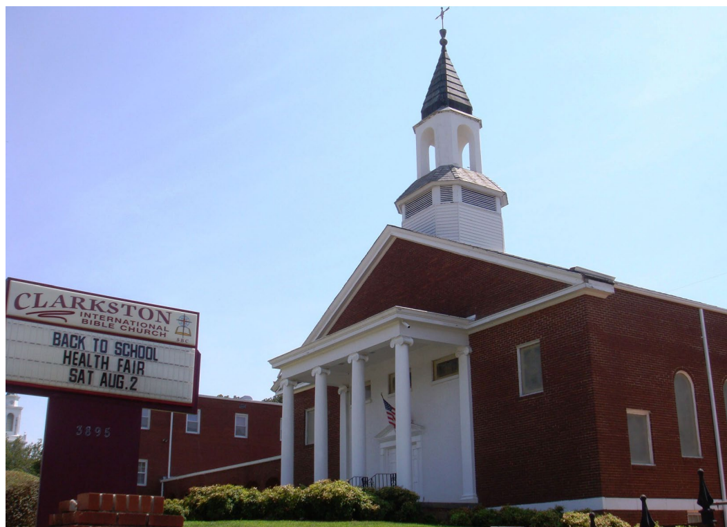
Рис. 1. Кларкстонская международная библейская церковь (фото автора, , , , 2.).

названия церкви. Кларкстонская церковь согласилась. Было принято новое название, подчеркивавшее, что Кларкстонская международная библейская церковь (Clarkston International Bible Church) открыта всем христианским верующим (Рис. 1, 2).