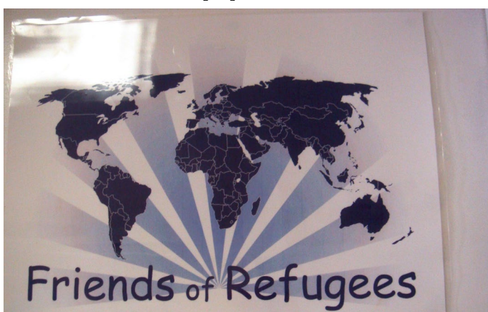
Рис. 7. Вывеска организации «Друзья беженцев».

Кларкстонская международная библейская церковь также сотрудничает с Библейским учебным центром для пасторов, где учатся лидеры некоторых этнических общин, фактически ставшие их пасторами, но не имеющие религиозного образования [13]. Дело в том, что в помещениях Кларкстонской международной библейской церкви проводят свои богослужения этнические общины в том числе из нехристианских стран – Непала, Бутана, Мьянмы, Пакистана, – как правило, не имеющие своих пасторов и тем более