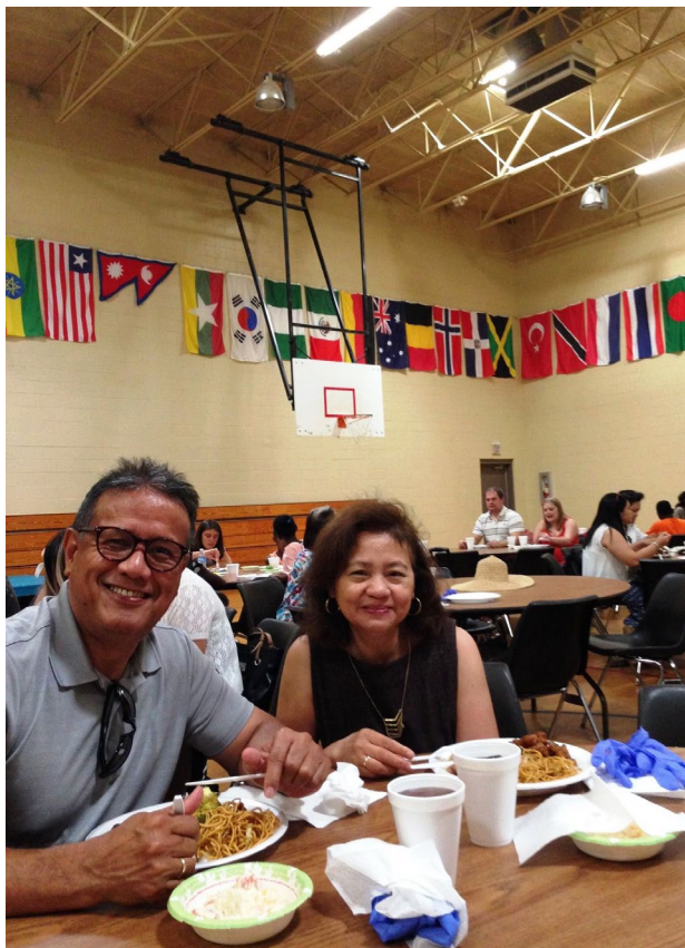
Рис. 5. Воскресный обед в Кларкстонской международной библейской церкви.

В здании Кларкстонской международной библейской церкви нашли пристанище общины, которые хотят сохранить свою самобытность, но еще не встали прочно на ноги. Окрепнув, некоторые из них покупают или снимают отдельное помещение для своих богослужений. Так, например, сделала община выходцев из Эфиопии, представляющих разные деноминации, которая раньше проводила свои службы в здании Кларкстонской международной библейской церкви [13]. Конгрегация Кларкстонской международной библейской церкви проводит совместные мероприятия с этническими общинами. Обычно это мероприятия, направленные на помощь беженцам и их интеграцию: организация досуга детей в летние каникулы, сбор школьно-письменных принадлежностей перед началом учебного года, обеспечение мебелью (после предварительно распространенных объявлений в разных районах, часто с помощью местных церквей, собирают мебель, которую люди планировали выбросить или готовы пожертвовать) вновь прибывших [13]. Каждый воскресный полдень после богослужения основной конгрегации в просторном спортивном зале церкви устраивается общий