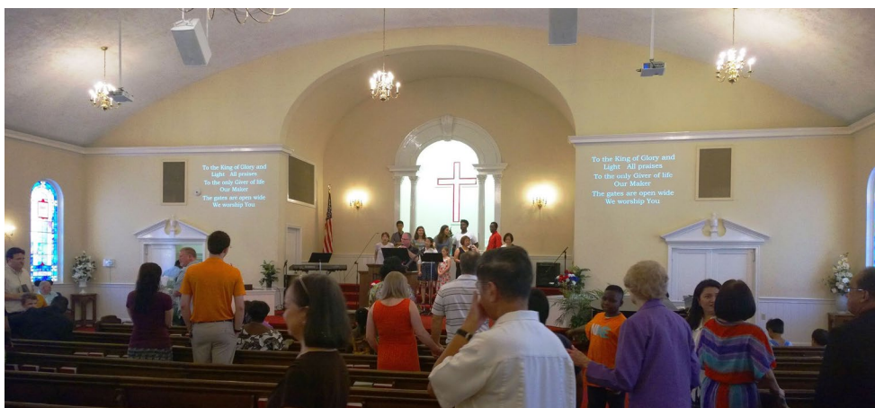
Рис. 4. Во время воскресного богослужения в Кларкстонской международной библейской церкви.

Главное богослужение в Кларкстонской международной библейской церкви, как и полагается, проходит в воскресенье утром. В настоящее время основная конгрега-