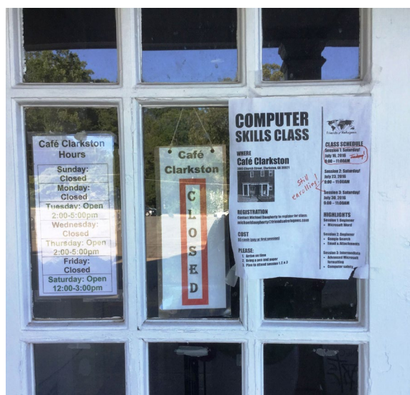
Рис. 8, 9. Программы, предлагаемые организацией «Друзья беженцев».

Интернет-кафе, где волонтеры помогают беженцам составить резюме и разные заявления и пр., а также освоить навыки работы на компьютере и поиска в