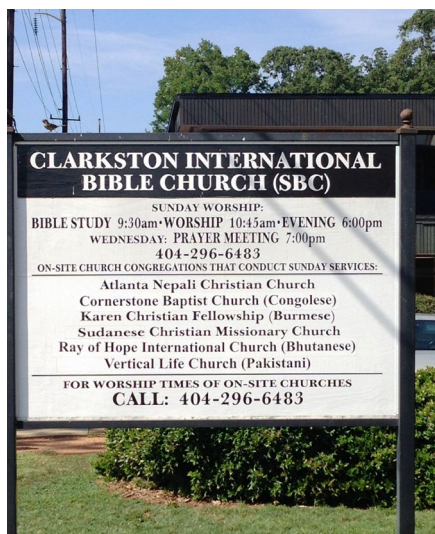
Рис. 6. Информация о богослужениях этнических общин в Кларкстонской международной библейской церкви.

обед по системе шведского стола для членов всех общин за символическую плату в