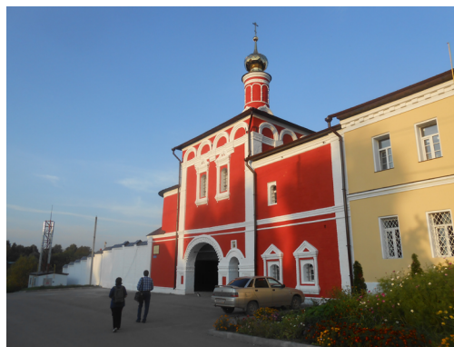
Рис. 2. Надвратный храм во имя митрополита Московского Алексия в святых воротах Спасо-Преображенского мужского монастыря. Белев, сентябрь 2017 г.

Расцвет монастыря приходится на XVI–XVII вв. и до середины XVIII в. Во времена реформ Екатерины II монастырь претерпел серьезные изменения. Церковные земли, имения и часть финансов монастырей перешли во владение государства. Многие монастыри закрывались, а Свято-Преображенский устоял. Он не был закрыт, но из первоклассного богатого монастыря стал