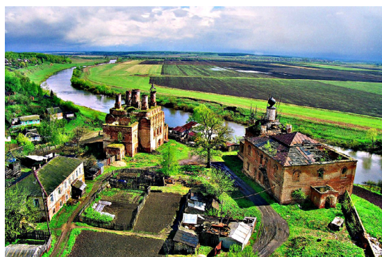
Рис. 4. Огороды жителей «Краснорабочего поселка» на месте некрополя Спасо-Преображенского мужского монастыря.

«В 2007 г. появились первые монахи, хотя монастырь был ещё закрыт. Вообще об открытии монастыря начали радовать власти города. То есть не епархиальные власти, а городские. Белев был в таком запустении, что решили начать его возрождение с монастыря, чтобы привлечь паломников и туристов.