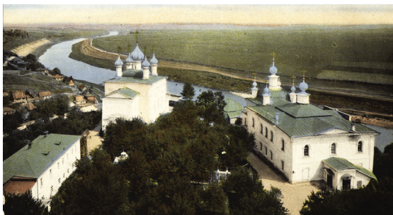
Рис. 1. Белевский Спасо-Преображенский мужской монастырь. Дореволюционная открытка

«Широкой волной разливающееся в народе нашем неверие, умножение беззакония, иссякновение любви между людьми и увеличение преступности побуждает меня по силе возможности прийти на помощь братьям моим по вере открытием Белевского Алексеевского Братства, которое имеет целью призрение и воспитание бесприютных и нравственно покинутых детей» (Государственный архив).