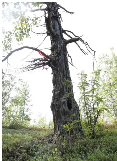
Рис. 5. Засохшая лиственница с изображением Бабушки. Озеро Нямбойто, Тазовский район, ЯНАО. Август 2024 г.