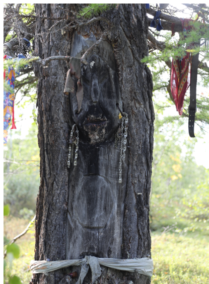
Рис. 2. Изображение духа Бабушки на (живой) лиственнице. Озеро Нямбойто, Тазовский район, ЯНАО. Август 2024 г.

приносили жертвы, говорят жирные пятна вокруг его рта — следы кормления. Обозначенные признаки указывают, что после гибели дерева, духа, вырезанного на нем, тоже сочли умершим, и совершать в отношении него культовые действия прекратили.