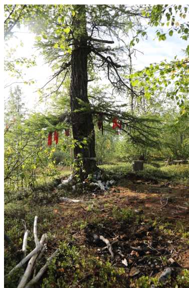
Рис. 3. Священная лиственница с изображением Бабушки. Озеро Нямбойто, Тазовский район, ЯНАО. Август 2024 г.

приносили жертвы, говорят жирные пятна вокруг его рта — следы кормления. Обозначенные признаки указывают, что после гибели дерева, духа, вырезанного на нем, тоже сочли умершим, и совершать в отношении него культовые действия прекратили.