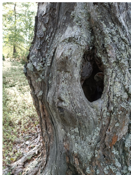
Рис. 4. Изображение духа Бабушки на засохшей лиственнице. Озеро Нямбойто, Тазовский район, ЯНАО. Август 2024 г.

Нямбойтинское божество, несомненно, принадлежит к разряду хозяев земли; лиственницы с его личинами стоят на берегу изобилующего рыбой озера вблизи с маленькой протокой, где, как рассказали информанты, и зимой всегда много щуки. Подобное расположение — в местах, где в рыбные озера впадают маленькие питаемые родниками (и потому не подверженные замору) речушки — имеют те несколько селькупских святилищ хозяев промысловых угодий, которые довелось видеть одному из авторов исследования (Степанова 2023б). Святилища хозяев земли, которые селькупы обычно обустраивали рядом с самыми «урожайными» промысловыми угодьями, предназначались для