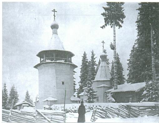
Карсикко на церковном кладбище в Панозере (РЭМ, 1914)

Дерево-знак карсикко делали по десяткам поводов — от смерти родственника до удачной рыбалки и охоты. В местах погребения появлялись целые рощи обрубленных деревьев. Карелы приходили туда поклониться духам предков, а заодно приносили разные жертвенные подношения. Дерево-знак используется в ритуалах жизненного цикла человека, а также в календарной и промысловой