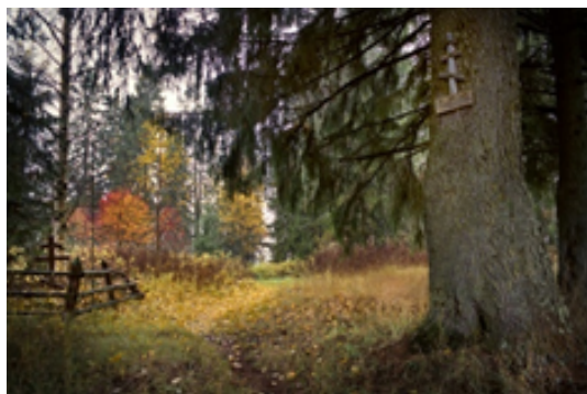
Рис. 2. Священная роща, д. Думино, Национальный парк «Кенозерский».