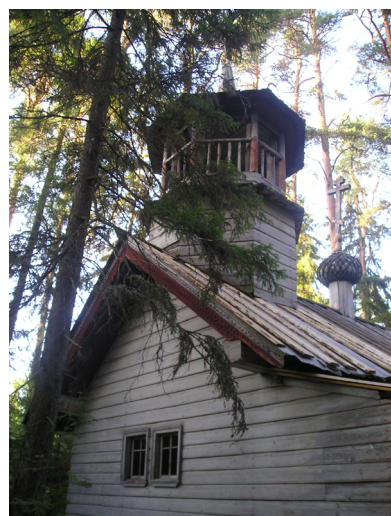
Рис. 3. Часовня Параскевы Пятницы в святой роще, д. Тырышкино, кон. XVIII — нач. XIX в.