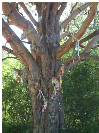
Рис. 5. Святое дерево (сосна) с обетными приношениями на дороге в п. Усть-Поча, Национальный парк «Кенозерский». 2023 г. Фото А. Б. Пермиловской