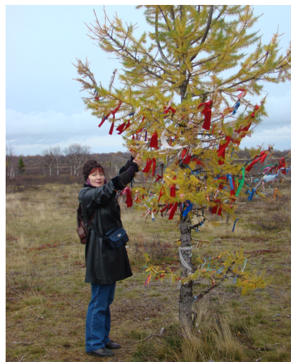
Рис. 1. Обетное дерево, Красный Чум, Ненецкий автономный округ. 2012 г.

Также большое значение для строительства дома имел выбор деревьев не только в практическом, но и его сакральном значении. Существовали деревья, которые нельзя было использовать для строительства. К ним относилась большая группа «священных деревьев». Священными считались как отдельно стоящие деревья, так и целые «священные рощи», особенно часто встречаемые на Русском Севере. Они росли на