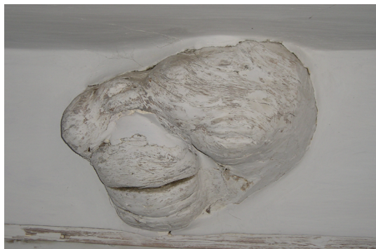
Рис. 7. «Злыднево дерево», в доме Паюсовой Т. А., с. Кимжа, Мезенский р. 1909 г.

кое дерево, с корня срубленное и попавшее между двумя брёвнами в стены избы, без всяких причин рушит всё строение и обломками давит насмерть неопытных и недогадливых хозяев. Даже щепка от таких брёвен, положенная со зла лихим человеком, ломает и разрушает целые мельницы» (Максимов 1903: 287). В с. Кимжа Мезенского района в интерьере крестьянской избы автором было зафиксировано «злыднево дерево» — это нарост на бревне, использованном для строительства дома 1909 г. По воспоминаниям хозяйки, он приносит несчастье его владельцам. «Два их в доме — над печкой и за печкой. Это злыднево место. Люди не живут. У кого купили дом, были бездетны. И у нас дочь умерла» (ПМА).