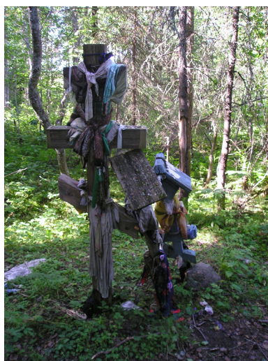
Рис. 4. Обетные кресты с пеленами на берегу о. Валдово, с. Ошевенск, Каргопольский р., XX в.

«Отношение к окружающему пространству у русского человека всегда ассоциировалось с некоторым духовным простором, наличием освящённых мест как носителей духовных ценностей. Священные рощи с их уникальными часовнями и крестами, на которые по древним обычаям, принятым на Севере, повязаны полотенца и платки, являются неотъемлемой частью живописных ландшафтов Кенозерья. На территории Парка сохранилось более 45 «Святых» рощ. Интересна история их возникновения: предполагается, что они возникли в местах бывших языческих святилищ-капищ или древних идолов. Точное время их возникновения или создания уже затерялось в истории. В рощах нельзя громко разговаривать, рубить деревья, ломать сучья, заготавливать бересту, собирать грибы и ягоды. Запреты и ограничения на пользование этими лесами, установившиеся в сознании людей, говорят о происхождении рощ как остатков девственных лесов. Некоторые деревья в рощах старше 200 лет. Территории этих лесных участков можно