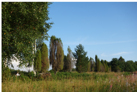
Рис. 6. Можжевеловая аллея (57 деревьев), о. Медвежий, нац. парк «Кенозерский», нач. XX в. 2023 г.

кое дерево, с корня срубленное и попавшее между двумя брёвнами в стены избы, без всяких причин рушит всё строение и обломками давит насмерть неопытных и недогадливых хозяев. Даже щепка от таких брёвен, положенная со зла лихим человеком, ломает и разрушает целые мельницы» (Максимов 1903: 287). В с. Кимжа Мезенского района в интерьере крестьянской избы автором было зафиксировано «злыднево дерево» — это нарост на бревне, использованном для строительства дома 1909 г. По воспоминаниям хозяйки, он приносит несчастье его владельцам. «Два их в доме — над печкой и за печкой. Это злыднево место. Люди не живут. У кого купили дом, были бездетны. И у нас дочь умерла» (ПМА).