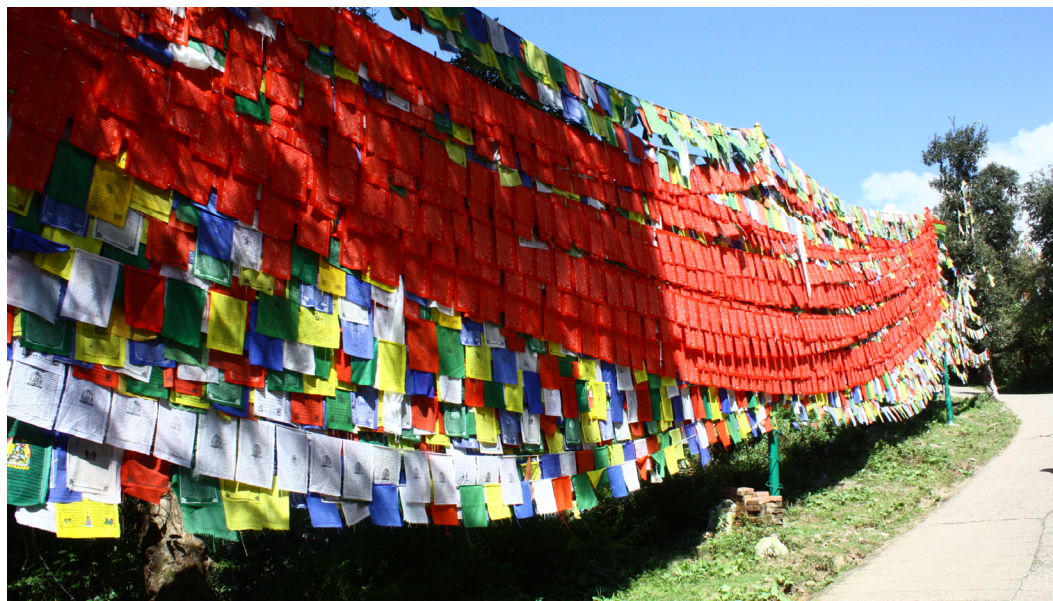
Рис. 1. Молитвенные флаги вокруг резиденции Далай-ламы XIV, г. Дхарамсала, Индия. 2023.

ги называются лунг-та , что можно дословно перевести с тибетского «ветер-конь», вертикальные флаги носят название дарчог — «знамя».