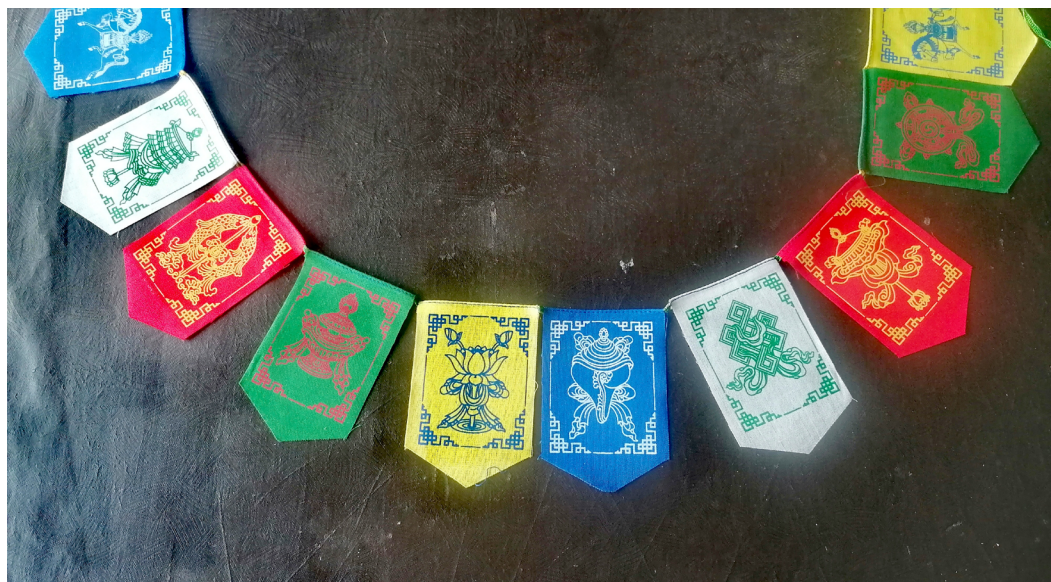
Рис. 3. Набор молитвенных флажков с изображением восьми благоприятных символов.

Флаги вывешиваются в последовательном чередовании пяти цветов в особых местах, таких как храмы, ступы, крыши, горные перевалы. Для вывешивания флагов существуют благоприятные дни, которые вычисляются астрологами и указываются в ежегодных альманахах. Тибетский Новый год ( Лосар ) — это лучшее время для обновления выгоревших и истрепавшихся на ветру молитвенных флагов. Считается, что вывешивание флагов устраняет все препятствия, вызванные болезнями, неудачами, демоническими и планетарными воздействиями.