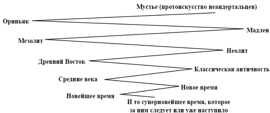
Рис. 1. Периодизация истории искусства (Прокофьев 1985)

Вопрос антропологии искусства по сути есть проблема понимания законов предметно-пространственной среды и систематизация доступных изучению вещественных объектов, что производится в искусствоведении на основе исторической периодизации (Рис. 1).