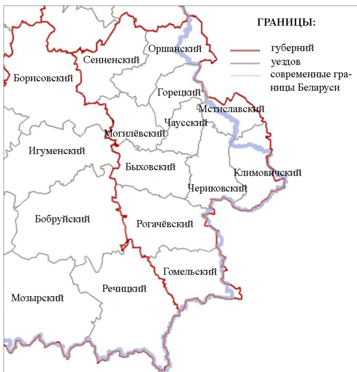
Рис. 1. Административно-территориальное деление в юго-восточной части Беларуси в середине XIX — начале XX в. (карта-схема составлена автором)

Лидером по количеству старообрядческого населения в регионе был Гомельский уезд (до 1852 г. назывался Белицким) 1 . Его территория являлась одним из важнейших исторических центров старообрядчества на белорусских землях. В границах уезда находился духовный центр староверов-поповцев — местечко Ветка. На долю уезда приходилась большая часть старообрядческого населения региона. Согласно официальным данным, в 1844 г. на территории Белицкого уезда (вместе с г. Белицей) насчитывалось 11 824 староверов. Все они были поповцами (НИАБ. Ф. 2001. Оп. 1. Д. 258. Л. 66об–67). В 1859 г. в уезде фиксировалось 12 971 сторонников старых обрядов, а через два года их количество выросло до 14 999 человек (ПКМогГ 1861: 14–22; ПКМогГ 1863: 72–73). Старообрядческое население довольно равномерно заселяло территорию уезда (Рис. 2).