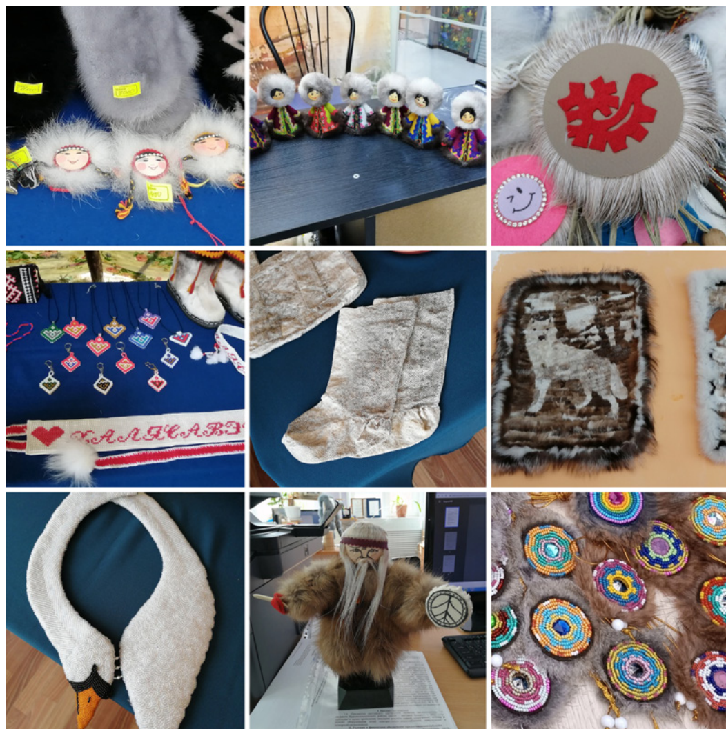
Рис. 3. Сувениры, которые были изготовлены с применением авторской фантазии и использованием традиционных мотивов, материалов и техник. Поселок Красноселькуп, город Тарко-Сале, поселок Харампур, Красноселькупский и Пуровский районы Ямало-Ненецкого автономного округа. Фото автора, 2022 г.

изделия резчиков принадлежат к третьему виду сувениров — выполненных по национальным мотивам со слабой привязкой к традициям (Рис. 4). Излюбленные темы работ мастеров — мифология и хозяйственные занятия коренных народов Севера, а также животные. В округе творчество резчиков позиционируют как продолжение древних традиций резьбы народов Севера и, конкретнее, искусства Усть-Полуя. Однако между Усть-Полуем и современной школой резьбы, которая сформировалась на Ямале в 1980–1990-х гг. из выпускников упомянутого училища, пролегает период длиной почти в два тысячелетия, когда эти традиции были преданы забвению и не воспроизводились 1 . Поэтому можно говорить лишь о подражании современ-