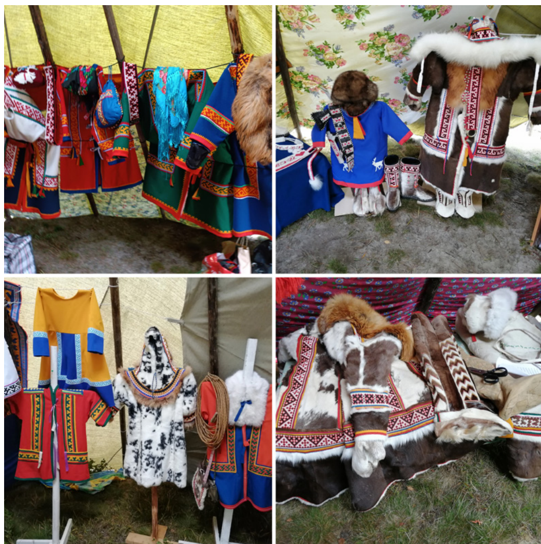
Рис. 2. Выставка-продажа национальной одежды на этнофестивале «Харвей» в поселке Харампур Пуровского района Ямало-Ненецкого автономного округа. Фото автора, 2022 г.

украшенный бусинами золотой шнур для подвешивания. На изображении сувенирной оленьей ноги сделаны зарубки в виде крестов и параллельных линий, обозначающие числовые порядки. Оленями раньше измерялось богатство семьи, от числа оленей напрямую зависело семейное благополучие. Численность оленей принято было скрывать, оберегая свое богатство от сглаза, вопрос «сколько у вас оленей» до сих пор считается у оленеводов неприличным. То есть в прошлом в такие дощечки/пластины был вложен сакральный смысл оберега, который, сильно упростив, перенесли на сувенир: предмет стал просто оберегом — в первом значении. Второе значение предмета обнаружилось после фразы мастерицы, произнесенной при продаже, она заметила: «Если у вашего мужа есть машина, нужно повесить в ней этот предмет, и он уберезет его от аварии на трассе Коротчаево — Новый Уренгой, там часто случаются аварии» (ПИМА 2022). Это замечание указывает на гендерную ори-