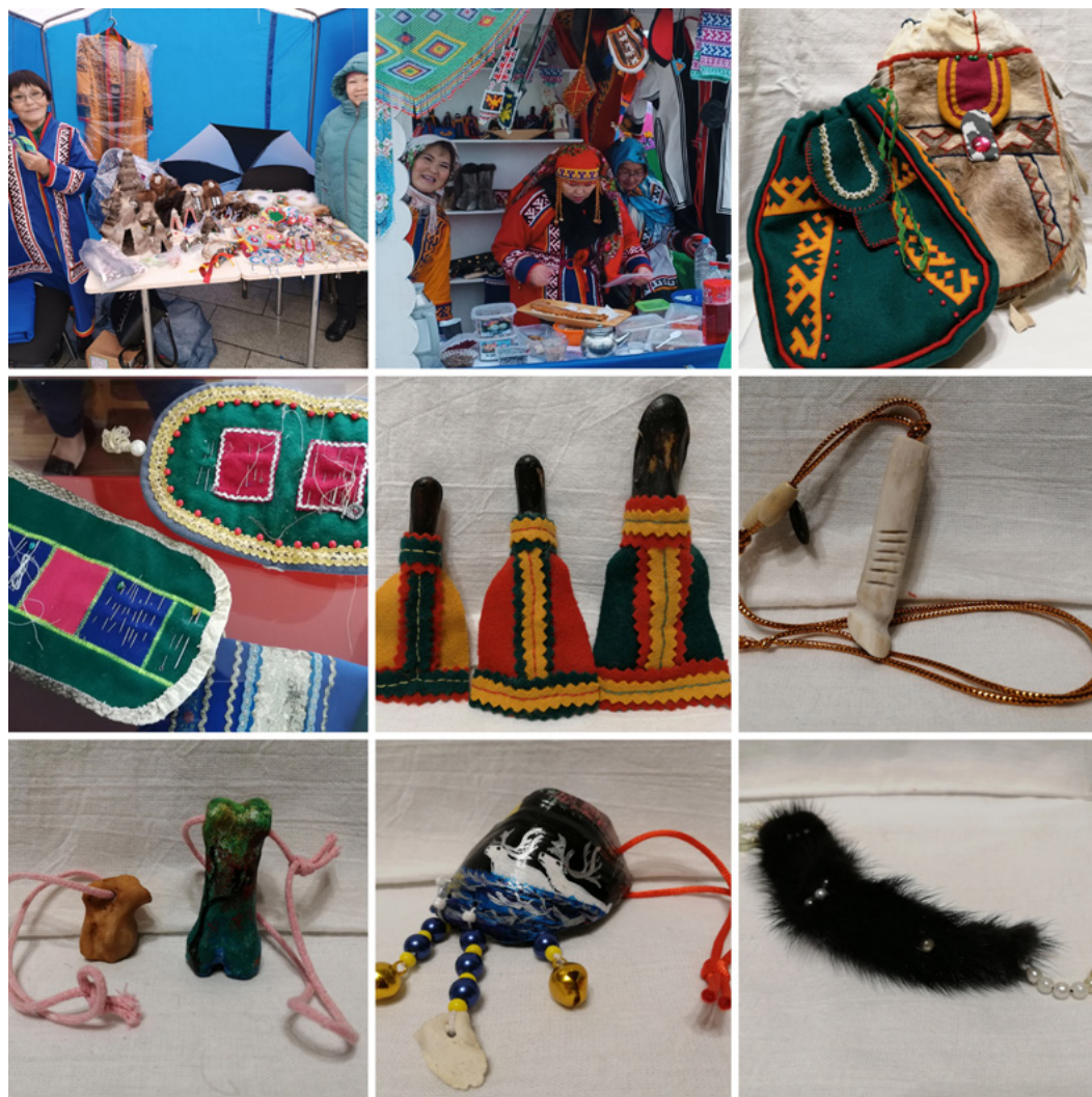
Рис. 1. Мастерицы из числа коренных малочисленных народов Севера, продающие национальные сувениры на ярмарке, приуроченной к празднованию 90-летия Пуровского района; женские сумки; селькупские игольницы; национальные куклы; подвеска в виде оленьей ноги с зарубками, обозначающими числовые порядки; бабки-обереги; сувенир оленьи копытце; опушка-загребушка. Город Тарко-Сале, поселок Харампур, Пуровский район Ямало-Ненецкого автономного округа. Фото автора, 2022 г.

Примером таких обновлений могут служить традиционные женские сумки, они есть у лесных и тундровых ненцев и у селькупов (Рис. 1). Сумки являются произ-