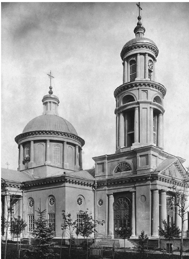
Храм во имя Св. Григория Просветителя. 1814 г.

Главной площадью Нового Нахичевана стала Соборная по названию заложенного на ней 9 сентября 1783 г. главного Кафедрального собора в честь Св. Григория Просветителя ( Сурб Григор Лусаворич ). План этого храма, по поручению Екатерины II, был составлен крупным архитектором того времени Иваном Егоровичем Старовым с использованием проекта итальянских мастеров, который возводил тогда Таврический дво-