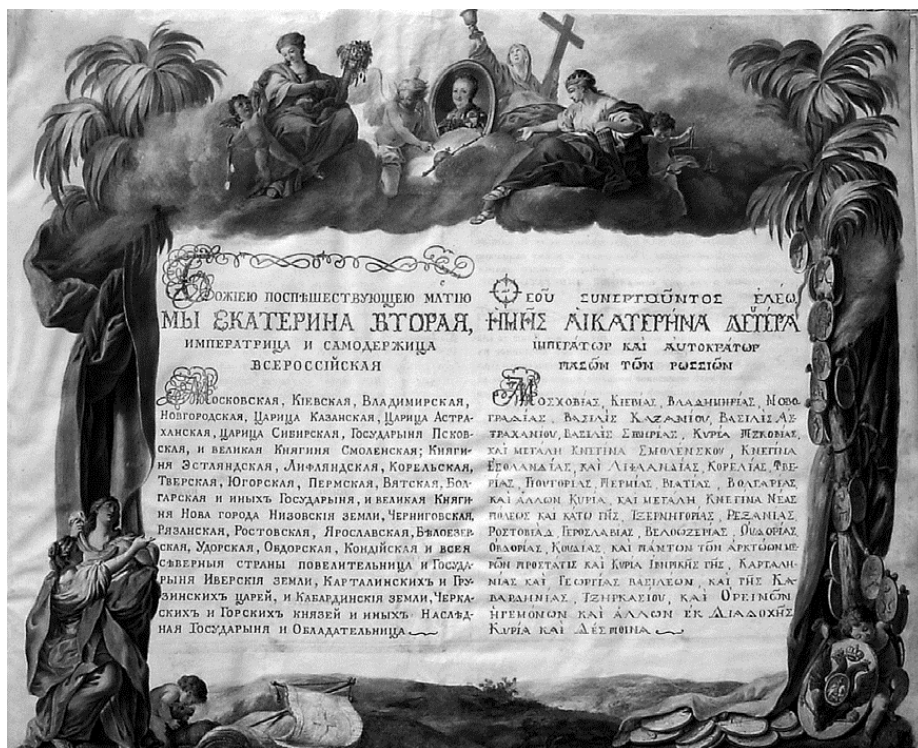
Первый лист Жалованной грамоты (Указа) Екатерины II от 14 ноября 1779 г.)

Долгая и утомительная дорога приносила переселенцам неисчислимые страдания от холода, недоедания, болезней. Несмотря на то, что им по дороге, в результате заботы А.В. Суворова, неоднократно обращавшегося к князю, генерал-фельдмаршалу Григорию Александровичу Потемкину по поводу бедственного положения, оказывалась определенная помощь продуктами, одеждой, транспортом, деньгами, этого было явно недостаточно. По словам известного в то время просветителя и историка