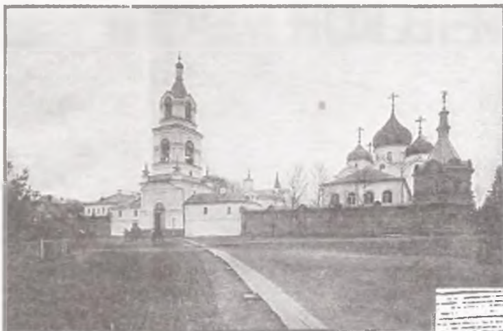
Вифания. Фотография начала XX в.

ме совершенно молебное пение — и к концу вечернего служения прибыл из лавры крестный ход для принятия образа прп. Сергия и п[е]ренесения его в обитель. Служба окончена в сумерки и по приговору к ходу было уже совершенно темно. Около 5000 свеч роздано было народу, но и это количество оказалось недостаточным для пришедших на встречу. Братия лавры приняли св. икону и открыли крестный ход из Гефсимании в лавру: они поочередно несли икону преподобного, а иноки Гефсимании провождали ее с обычными своими билами 17 до самой лавры.