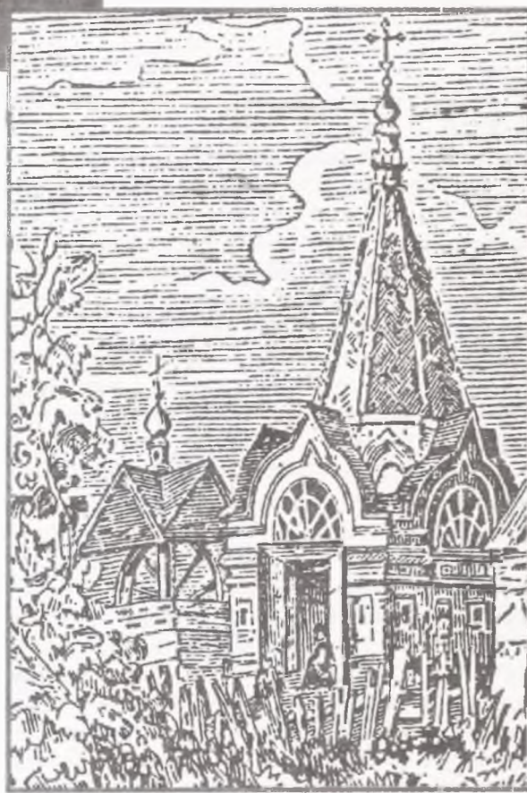
Часовня «У креста» на горе Волокуше по дороге в Троице-Сергиеву лавру.

Улицы посада, где был ход и лавра были освещены, и когда несли икону во врата обители, казалось, свет дня осиял ее здания. После того, как икона поставлена была на месте у гроба преподобного Сергия, о. наместник лавры начал чтение акафиста, собор не мог вместить всех собравшихся в сретение преподобного. Пламенно и усердно молились собравшиеся и