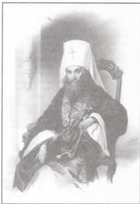
Свт. Филарет, митрополит Московский и Коломенский. Портрет сер. XIX в.

Разумеется, в письмах, посылаемых официальным путем и сохраняемых потом в архивах царской семьи, не писали о сугубо секретных делах. После Чембара император в Царском Селе получил письмо от «любезного брата Михайла» (вся их переписка на русском языке) из Франкфурта от 10 сентября и ответил ему 21 сентября 51 .