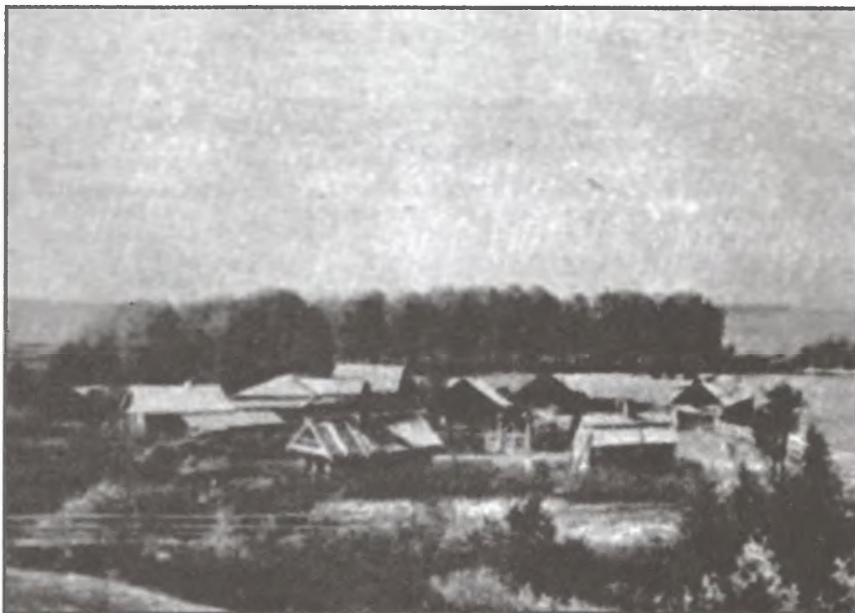
Вид села Зерцалы Ачинского уезда Томской губернии. Фотография начала XX в. К этой деревне был приписан как ссыльный и некоторое время жил в ней старец Феодор Кузьмич.