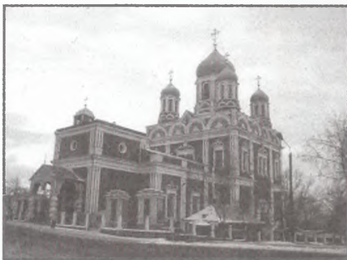
Вид на Вознесенский собор в Ельце с юго-запада (1845 — 1889 г.). Фото 2001 г.

Создатели собора в Ельце сознательно возводили его на древней площади города. Тем самым они подчеркивали ее первоначальное значение: «соборная церковь издревле занимала центр площади и города, и вокруг нее группировались жилища граждан, а с ними и приходские церкви» 20 . Жители города хотели вернуться к истокам и при-