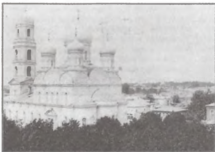
Вид с юго-востока на Никольскую церковь в Ливнах. Храм не сохранился. Фото с открытки XIX в. из собрания РГБ.

имя иконы Божией Матери Скорбящей и в честь свт. Николая.