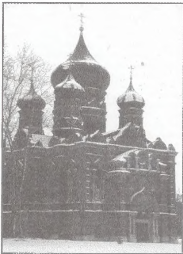
Успенский собор Успенского женского монастыря в Туле. Фото 2001 г.

широкого применения декора в духе XVII века. К этой группе можно отнести большой пятиглавый собор Успенского женского монастыря, бывшего у стен Тульского кремля. В более упрощенном виде та же композиция лежит в основе архитектуры приходской церкви в честь 12-ти апостолов, построенной в Туле в 1903 году.