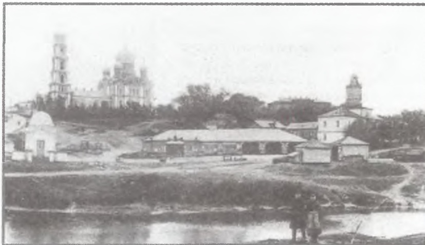
Город Михайлов. Вид на собор и набережную р. Прони. Храм не сохранился.

В орловской епархии в середине — второй половине XIX в. также широко шло соборное строительство. В г. Орле на берегу р. Оки у архиерейского дома был возведен большой пятиглавый со-