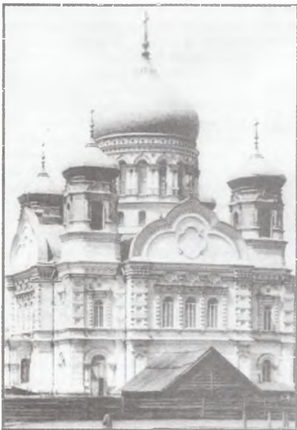
Никольская церковь (главный престол в честь Рождества Богородицы), (1803—1866 гг.). Архитектор А. А. Кюи. Не сохранилась.

В городах тамбовской губернии широко проходило соборное строительство: в уездном г. Кирсанове подобный храм возвели в новом женском монастыре, в г. Моршанске в 1866 г. перестроили