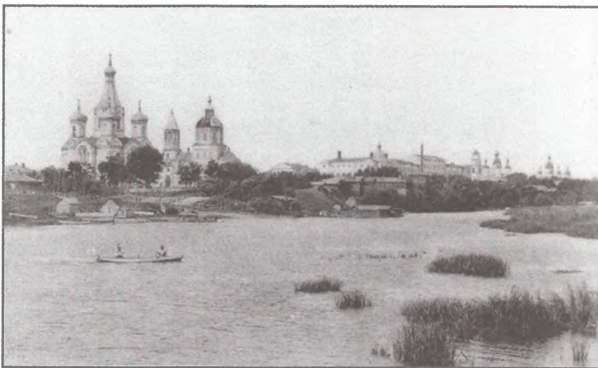
Вид г. Тамбова и набережной р. Цны. Слева — Покровская церковь. Не сохранилась.

денного по проекту К. А. Тона. Во всех губернских и уездных соборах этого круга на фасадах не было скульптурных рельефов, как в столичных храмах. В козловском храме на месте рельефов