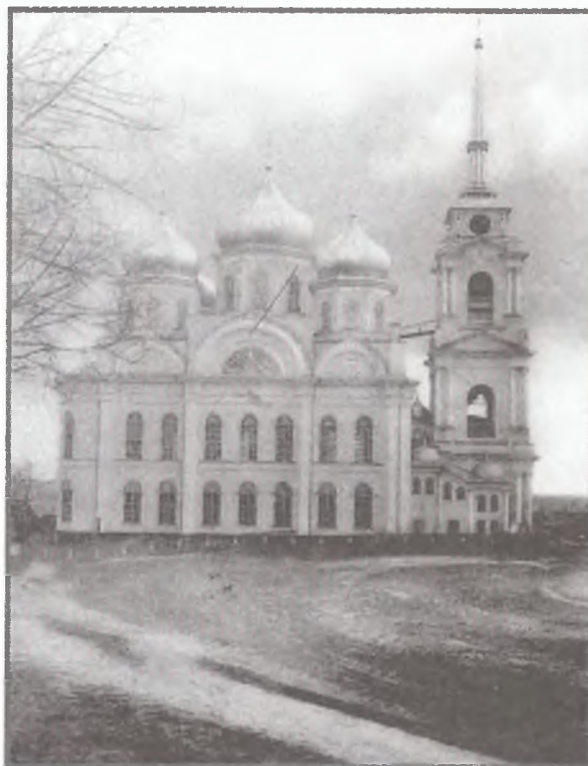
Северный фасад Спасо-Преображенского собора г. Болхова (закладка — 1844 г., освящение — 1851 г.). Храм частично сохранился снаружи.

традициям, но отчетливо проявляется и классическое начало, что особенно видно в решении колокольни. Два ряда больших полукруглых окон на фасадах и симметрия в членении стен относятся к приемам классицизма, в то время как пятиглавие, килевидные закомары и тип соборного храма, возрождающий формы крестово-купольных храмов древности, — связывают архитектуру