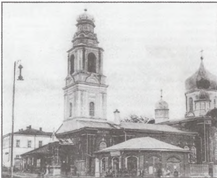
Вид с юго-запада на Воскресенскую церковь в г. Малоархангельске. Храм не сохранился. Фото с открытки XIX в. из собрания РГБ.

Боголюбская церковь в уездном городе тамбовской губернии Козлове (ныне г. Мичуринск) была построена по образцу Введенского собора Семеновского полка в Санкт-Петербурге, возве-