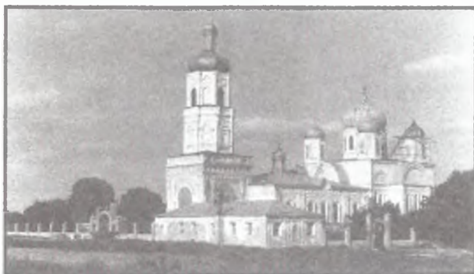
Современный вид церкви в честь Зимаровской (?) иконы Божией Матери в селе Зимарово Новодеревенского района Рязанской области.

воздвигнутых по образцовому тоновскому проекту. Значение соборного храма в селе было очень велико, так как известно, что большинство населения края, да и всей России, было крестьянским.