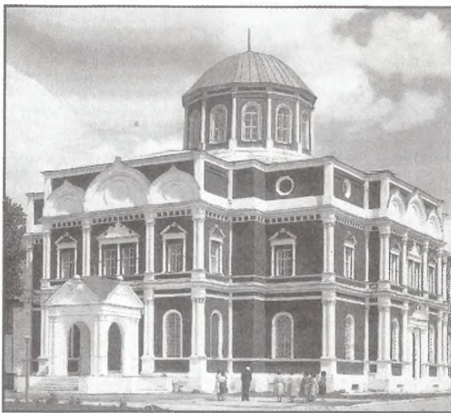
Современный вид Богоявленского собора. (1855–1863 гг.) в Туле с запада.. Фото 1990-х годов.

мятник избавления Отечества от врагов рукою Александра I, и памятник...любви к отшедшему в Вечность Императору Николаю I и в ознаменование восшествия на престол преемника его Императора Александра Николаевича» 17 .