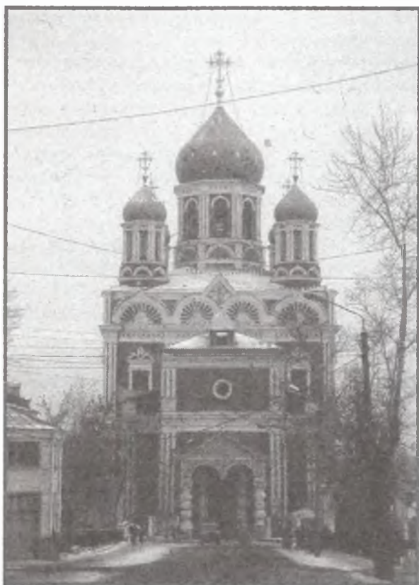
Западный фасад Вознесенского кафедрального собора г. Ельца (закладка — 1845 г., освящение — 1889 г.). Архитектор К. А. Тон. Фото 2001 г.

ском стиле. Среди них выделяется упомянутый Вознесенский кафедральный собор г. Ельца, проект которого был выполнен лично К. Тоном. Собор сохранился почти целиком, утрачены только нижние ярусы центрального иконостаса, иконостасы приделов, утварь, паникадила и другие части внутреннего убранства. Это единственный храм К. А. Тона, дошедший до настоящего времени в таком полном виде 18 .