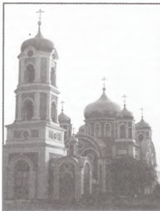
Собор Воскресения Христова в г. Новохоперске (современный вид). Фото 2002 г.

Особое место в истории русской архитектуры заняли пятиглавые храмы соборного типа, воздвигнутые в крупных селах. Проекты соборных храмов часто использовались для строительства сельских церквей. Как правило, такие села объединяли вокруг себя целый куст деревень. В Черноземной области есть немало сельских пятиглавых храмов,