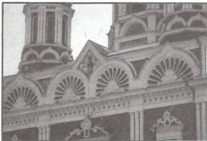
Фрагмент западного фасада Вознесенского собора г. Ельца (1845–1889 гг.). В центре — керамическая вставка с изображением Спасителя. Фото 2001 г.

В Ельце был предложен свой способ постройки собора. В отличие от большинства русских городов, в которых кафедральные соборы создавались при помощи строительных комитетов, г. Елец обратился в Синод с просьбой разрешить не учреждать строительного комитета. Такой подход отличался и современной предприимчивостью и одновременно патриархальностью. Граждане сообщали Синоду, что возглавить сбор средств, организовать строительство и воодушевить горожан может только