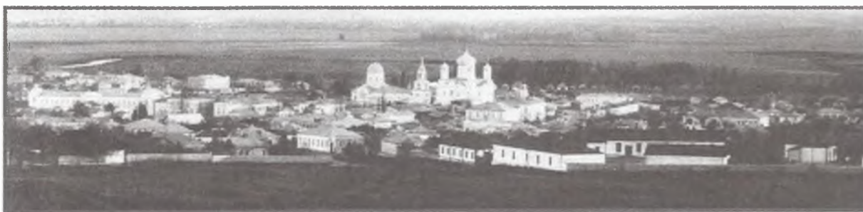
Вид города Богучара. В центре — собор Всемиловитого Спаса.

В соборе в честь Владимирской иконы Божией Матери в уездном городе Валуйки переход от стен