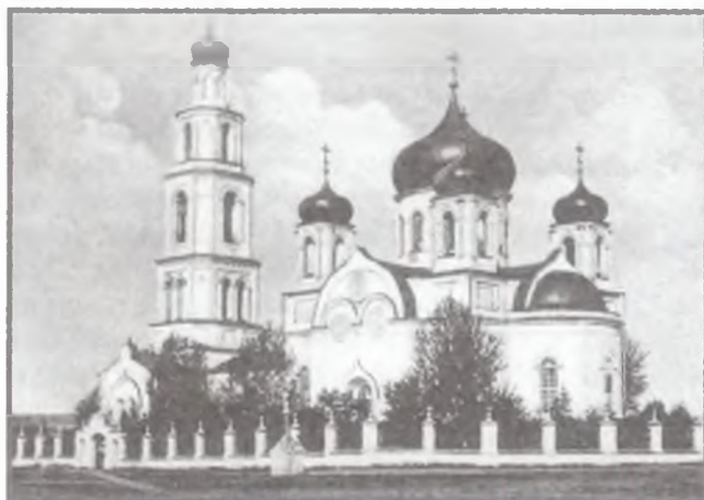
Вид Владимирского собора в г. Валуйки (закладка — 1843 г., освящение — 1853 г.). Не сохранился.

Особое место в истории русской архитектуры заняли пятиглавые храмы соборного типа, воздвигнутые в крупных селах. Проекты соборных храмов часто использовались для строительства сельских церквей. Как правило, такие села объединяли вокруг себя целый куст деревень. В Черноземной области есть немало сельских пятиглавых храмов,