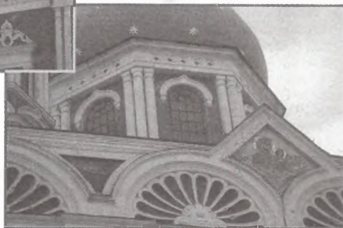
Фрагмент южного фасада Вознесенского собора г. Ельца (1845–1889 гг.). Справа — керамическая вставка с Казанской иконой Богородицы. Фото 2001 г.

Так планомерно проводилось обновление центральных площадей городов, на которых главное