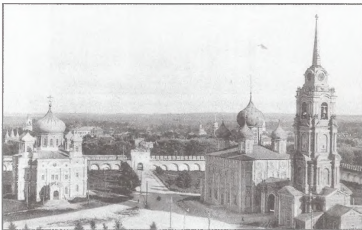
Вид Тульского Кремля. Справа — Успенский собор (1762–64 гг.), слева — Богоявленский (закладка — 1855 г., освящение — 1863 г.).

Собор стали возводить внутри древних кремлевских стен рядом с Успенским собором (построен на месте более древнего в 1685 г., полностью перестроен в 1762–64 гг.). В этом проявилось стремление эпохи русского стиля обновлять и украшать древнейшие святые места в городах. В отличие от большинства соборов XIX в., тульский был построен очень быстро — его закладка состоялась в 1855 г., в 1858 г. он был вчерне возведен, закончен к 1862 г., а в 1863 г. выполнялась отделка внутреннего пространства.