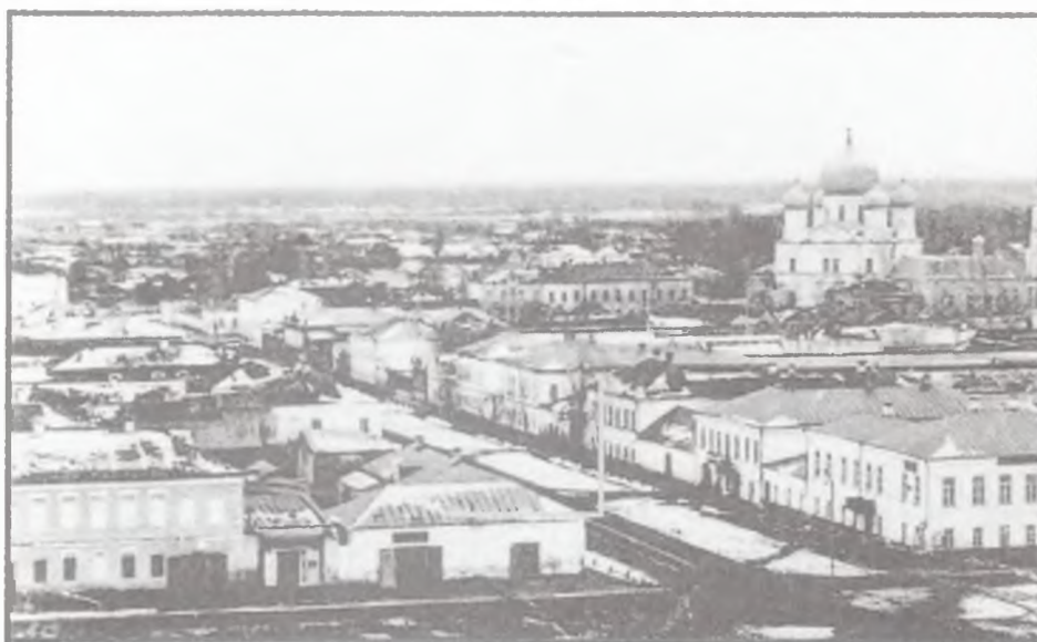
Вид города Моршанска. Справа — Никольская церковь.

В городах тамбовской губернии широко проходило соборное строительство: в уездном г. Кирсанове подобный храм возвели в новом женском монастыре, в г. Моршанске в 1866 г. перестроили