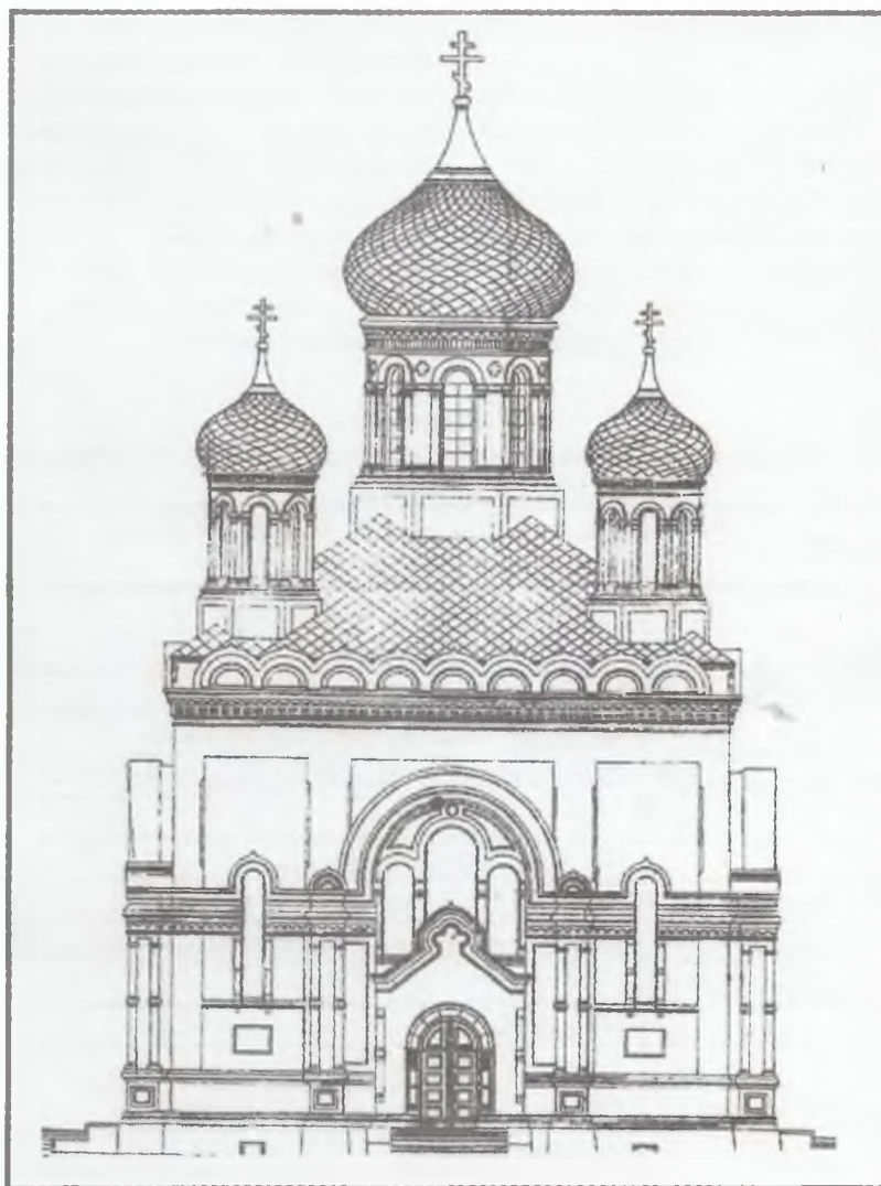
Фасад православного собора г. Эривань. 1894 г.

товых сооружений — соборы, церкви, часовни, молитвенные дома (без учета постоянных церквей военных гарнизонов, которые входили в структуру военного министерства и составляли особое звено в церковной организации). Большинство из них — 18 — было расположено в сельской местности.