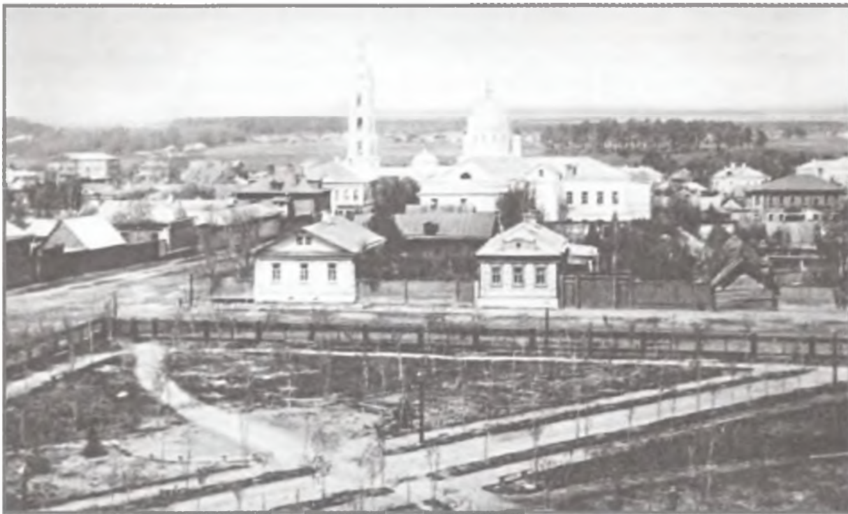
г. Богородск. Фото начало XX в.

С точки зрения умудренных опытом духовных лиц, было очевидно, что горожане подавлены и нуждаются в поддержке и ободрении. Снисходя к немощам своей паствы, митрополит Филарет, считавший, что «тревожное состояние духа вредно» 32 , 25 сентября 1830 г. (ст. ст.) отменил традиционный визит в лавру на праздник преподобного Сергия Радонежского (а перед этим — поездку в Санкт-Петербург на заседание Священного Синода), оставаясь в городе, чтобы показать москвичам, что их архипастырь не оставляет своих приунывших чад в тяжелом испытании и готов разделить с ними любую судьбу.