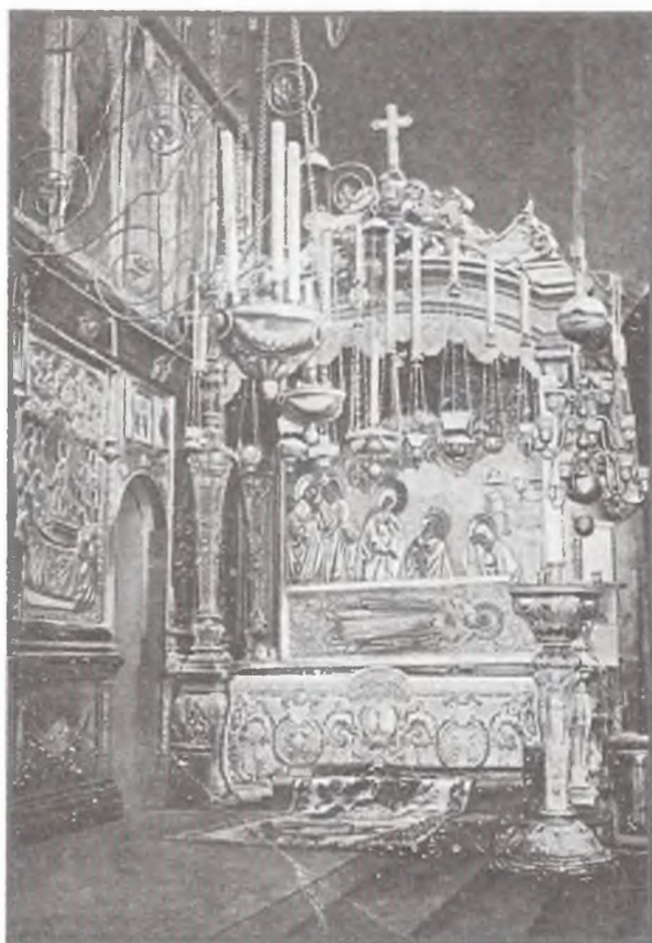
Рака преподобного Сергия Радонежского. Фото начала XX в.

и за деньги просителей, за первую половину XIX в. в документах Учрежденного Собора лавры представлен всего одним случаем, когда икону Радонежского чудотворца передали в 1822 г. в Коломенский Ново-Голутвин монастырь в новую, подготовленную к освящению церковь во имя преподобного Сергия из ризницы лавры. Отмечено, что икона была «качеством писания не очень великой древности...не более ста лет», «с приписными на полях двумя святыми, во облаче образ Святыя Троицы, у троичного и у чудотворца образов венцы и цаты серебряные чеканные, а у святых на полях гладкие...»; далее описываются украшения оклада — жемчуг, бирюза и красное стекло 8 . Этот образ, вероятно, мог быть списком с образа на гробовой доске, на окладе которого, по цитированной описи 1920 г., также в возглавии помещалась маленькая икона Святой Троицы. Однако в