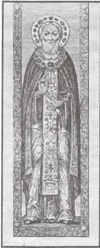
Образ преподобного Сергия Радонежского на гробовой доске. Иллюстрация из первого издания «Описания» 1849 г.

Из текста можно сделать вывод, что доска и риза образа — разновременные, т.е. доска древнее оклада. Рака менялась один раз в 1585 г., а