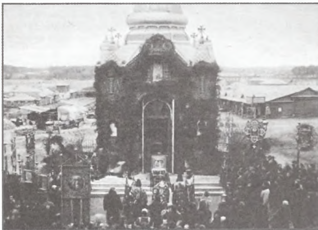
Крестный ход с иконой Божией Матери Иерусалимской в г. Богородске. Фото начало XX в.

В 1848 г. был совершен крестный ход с чтимой иконой Божией Матери Иерусалимской из г. Бронницы по многим приходам Бронницкого уезда. Вот как происходила встреча святыни в с. Новоявленском: «Иные имели еще силу выйти сами, других, более слабых, выводили и выносили. Все они ложились вдоль дороги, прося, чтобы святая икона была пронесена над ними» 40 . Этим крестным ходом была установлена новая традиция — выноса иконы из города. К этому времени прославленная уже в 1771 г. во время эпидемии чумы, икона, в воспоминание событий того времени, каждое десятое воскресенье по Пасхе обносилась вокруг г. Бронниц. Впоследствии были созданы две традиции ежегодного хождения этой святыни по Московской губернии, обе связанные со вспышками холеры. Первая возникла в 1866 г., когда 12 августа (по ст.ст.) икону приносили в г. Подольск. «Замечательно, что еще с утра в этот день не было заболеваний и во весь день никто не умер и холерная зараза с этого дня и совсем кончилась. С этой поры каждый год благодарные жи-