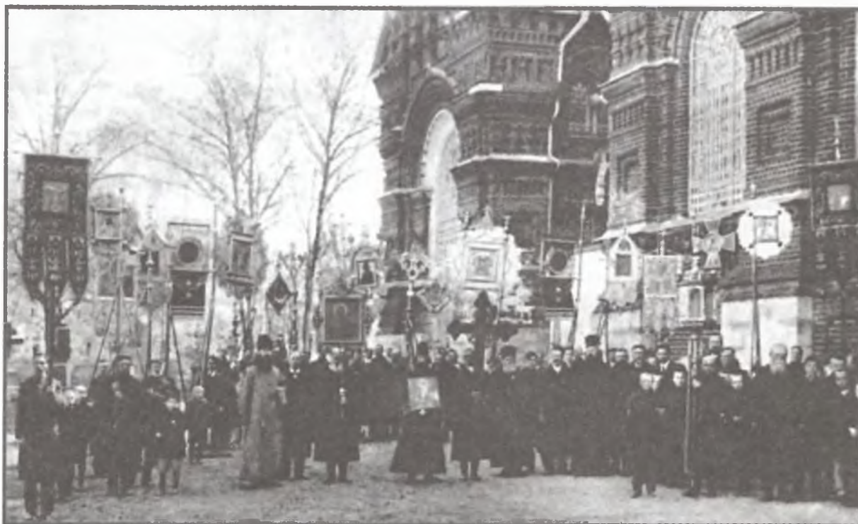
Общество хоругвеносцев г. Богородска. Фото начало XX в.

18 июля состоялся крестный ход вокруг города, протяженность которого составила около 15 верст. При этом духовенство с образами и хоругвями плыло в лодках по реке, а молящиеся шли по берегу, в определенные моменты «становясь на колена и повергаясь ниц». Особо отмечалось активное участие крестьян окрестных деревень и сел в этом благочестивом мероприятии, «потому что богомольные крестьяне постоянно приходят в город