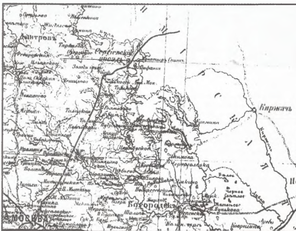
Карта Московской губернии. Богородский уезд. Начало XX в.

Обстановка в городе, по мере развития болезни, становилась все более напряженной. «Смертность с каждым днем все усиливалась, фуры развезжали в Москве по улицам и переулкам и вместе