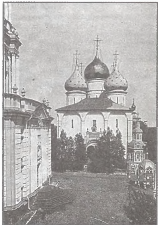
Троице-Сергиева лавра. Успенский собор. Фото начала XX в.

вариантах в начале повествования отсутствует слово «вчера», тогда как начало первого предложения первого и второго изданий выглядит следующим образом: «Вчера, 21 сентября...» Также в изданиях 1849—1850 гг. на титульном листе под заглавием есть указание: «Соч. М. А.» Начиная с третьего издания имя ходившего с образом иеромонаха Мануила сокращено до «М». В брошюре 1892 г. после основного текста на с. 14 вставлен дополнительный абзац: «В память этого события