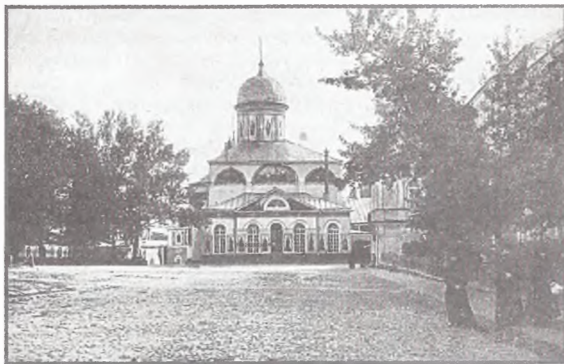
Троице-Сергиева лавра. Троицкий собор, в котором почивают св. мощи прп. Сергия. Фото начала XX в.

выстроен храм во имя преподобного Сергия, игумена Радонежского и всея России чудотворца, Е. Ф. Бочаровым и освящен 1852 г. сентября 25 дня».