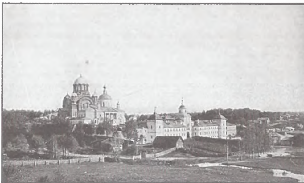
Покровский монастырь с. Хотьково. Фотография начала XX в.

Деревня Рязанцы в 8 в. от лавры. Рядом с ней — Стефанова часовня, построенная в память молитвенного общения преподобного Стефана Пермского и преподобного Сергия Радонежского. В часовне находился восьмиконечный дубовый крест, обитый липовыми досками. На одной стороне его — Распятие, на другой — изображение преподобного Сергия Радонежского.