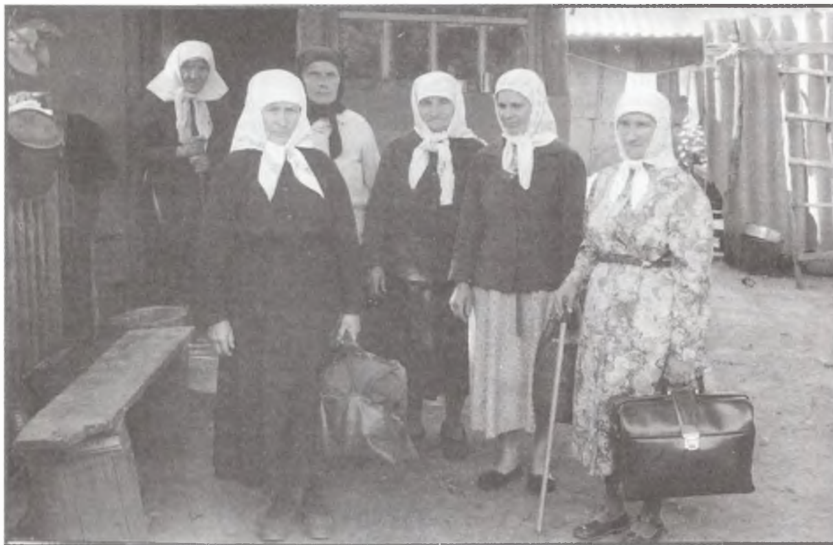
Чернички, ставшие монахинями. С. Бурдино, Липецкая обл. Фото 1960-х гг.