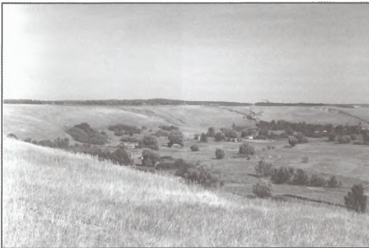
На месте Лысогорского Успенского монастыря. Вид на с. Троицкое. Фото О. В. Кириченко, 2002 г.

дарство, 110 осталось на посев и только 100 пудов — на собственные нужды 73 . Сестры специально отменили общую трапезу, распределяя зерно каждой отдельно. Большинство стало существовать на выручку от рукоделия и от подаяния. Когда Новохоперским РЦИКом было вынесено решение о закрытии общины, то насельникам разрешили взять с собой только личные вещи. Некоторые из монахинь подали жалобы (Г.Т. Прокофьева и группа из 12-ти человек) с просьбой вернуть им личные их кельи,