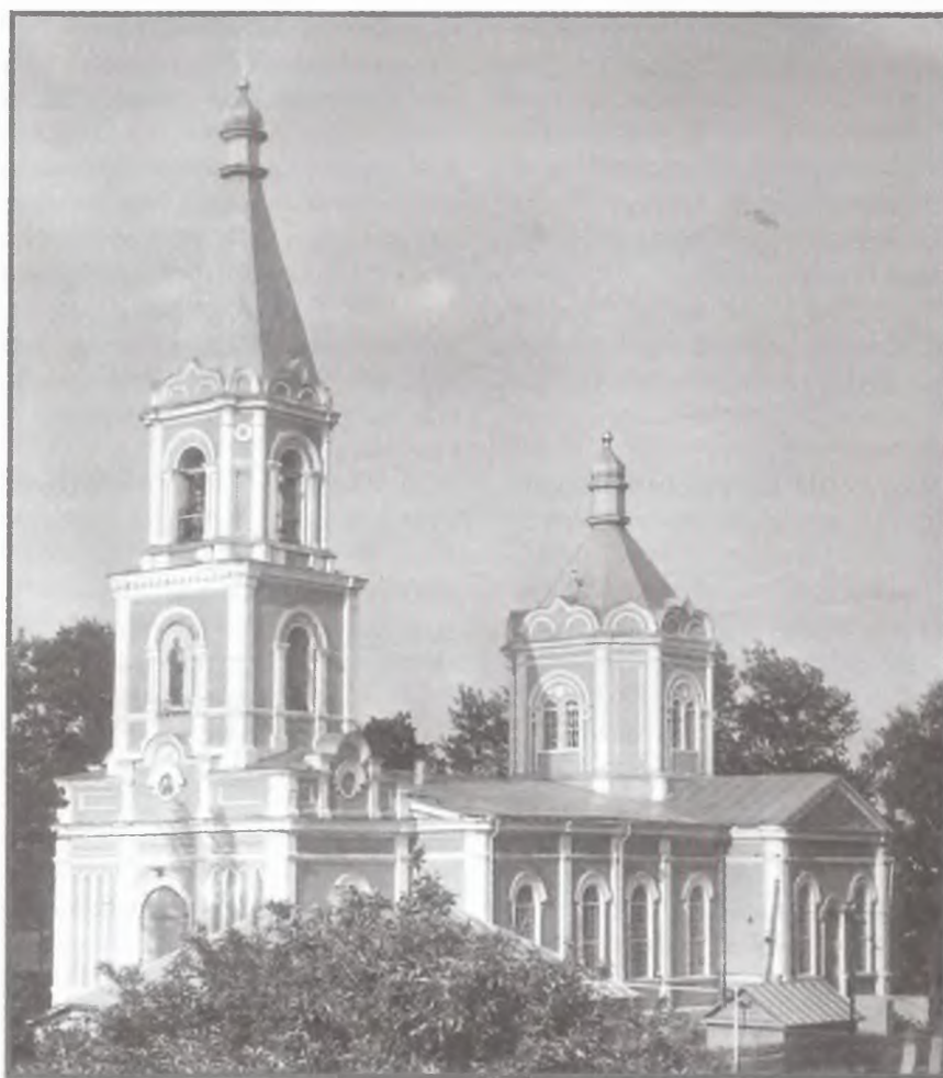
Знаменский храм г. Борисоглебска Воронежской обл.

В Борисоглебской обновленческой епархии к середине 1930-х г. насчитывалось 22 прихода, в