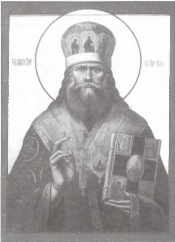
Священномученик епископ Липецкий Уар.

шанский «архиерей», — там везде много монашек и черничек. И у сергианцев и у ВЦС» 45 . Совершенно очевидно, что там, где отсутствовала духовно-воспитательная монашеская среда для черничек, они склонны были принимать крайние решения: уходить в церковное подполье, вести тайную церковную жизнь, вступая в оппозицию официальной и церковной и государственной власти.