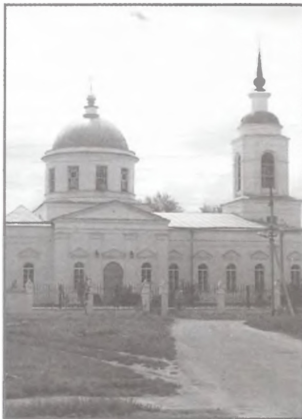
Казанский храм в с. Таволжанка Грязевского р-на Липецкой обл.