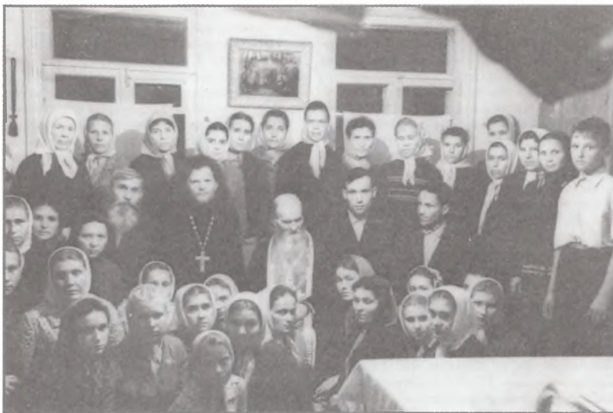
Члены приходской общины прп. Севастьяна Карагандинского (Фомина). Г. Караганда (мелькомбинат). Фото 1950-х гг.

ли из послушников, не успевших до революции стать даже рясофорными монахами (например, из оптинских послушников были прп. Севастьян Карагандинский, схимонах Иосиф (Моисеев) Оптинский из г. Грязи, иеромонах Даниил (Фомин) из Сорочинска Оренбургской обл.), выросли в советское время великие старцы. То же можно сказать и про женские монастыри.