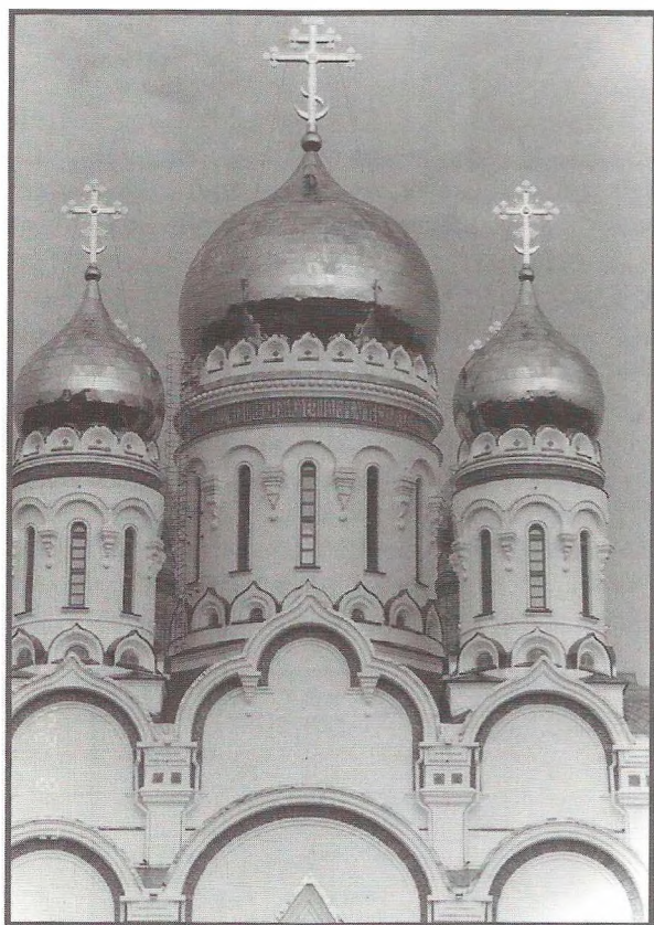
Купола храма Преображения Господня, г. Тольятти, Самарская обл. Построен в 1996–2001 гг. Главный архитектор Д. С. Соколов.

реставрации старых и строительстве новых храмов до тех пор, пока в последние годы этим стали заниматься в основном местные и региональные архитекторы. На заре же постсоветского храмостроительства потребность в новых храмах возникла уже в 1985—86 годах, и тогда мы начали проектировать храм Покрова Пресвятой Богородицы в г. Хмельницкий на Украине. Этот храм был построен в 1987—88 годах по образцу отреставрированного нами на территории комплекса Данилова монастыря храма Воскресения Словущего архитектора Ф. Шестакова по-