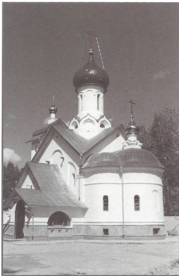
Храм в честь иконы Божией Матери «Всех скорбящих Радость» в г. Сургуте. Построен в 2001–2003 гг. Главный архитектор Д. С. Соколов.

И, наконец, сейчас, в 2003 году, мы начали проектирование двух церквей, посвященных последним, прославленным в наше время святым новомученикам и исповедникам Российским — в Лянторе под Сургутом и в Москве, в Строгино. В 2000 году в Тольятти по нашему проекту была построена часов-