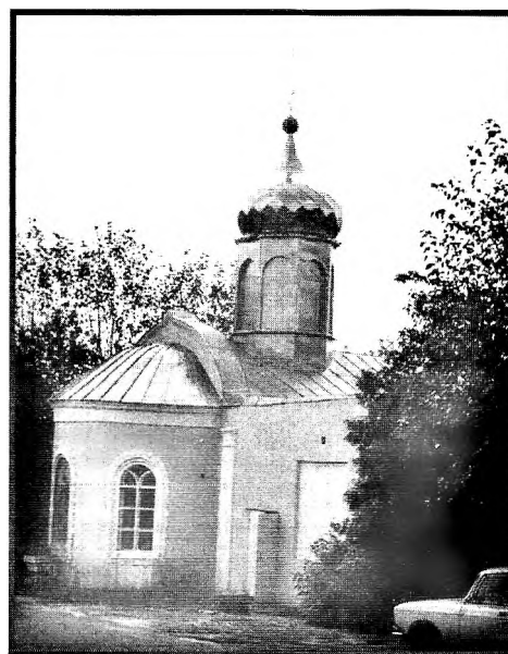
Часовня свт. Тихона Задонского в мужском Богородицком Задонском монастыре Липецкой епархии. 2001 г.

О. Варсонофий (Мельников) также стоял на перепутье — принимать ли после окончания семинарии священство в миру, как советовал батюшка, у