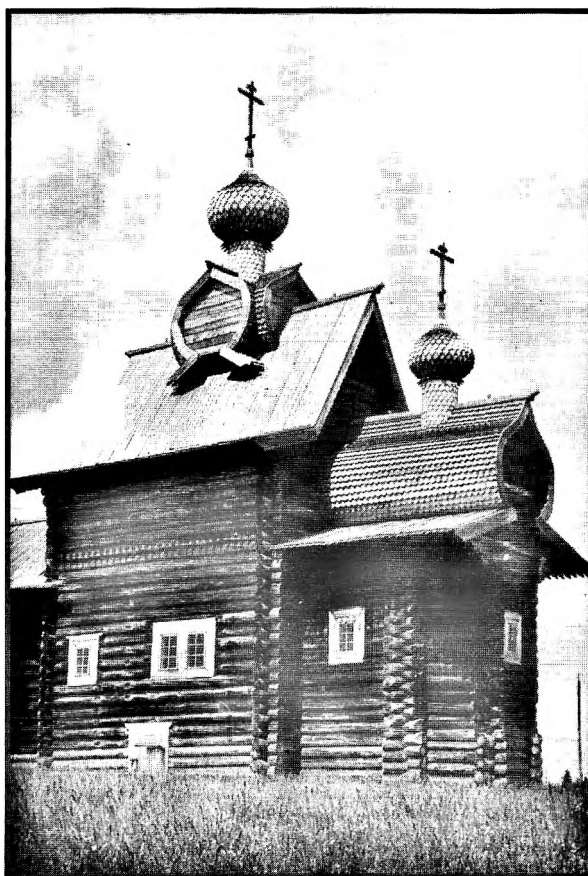
Церковь Преображения, с. Яндор Чердынского района. 1702 г.

Известны примеры, когда крестьяне предлагали во время очередной переписи населения записать их погост или стан по названию престола приходской церкви. Так, в Кунгурском уезде таких поселений в 1715 г. насчитывалось 12 из 14: с. Введенское над рекой Суксуном, с. Никольское Кыласово, с. Никольское Медянки, с. Покровское Ясылу, Вознесенский острожек над рекой Березовкой 13 . В Соликамском уезде длительное время употреблялись такие названия поселений: погост Николаевский, что был починок Кызьва, погост Воскресенский, что была деревня на р. Нердва, погост Георгиевский в Кривце 14 . В этих названиях, с