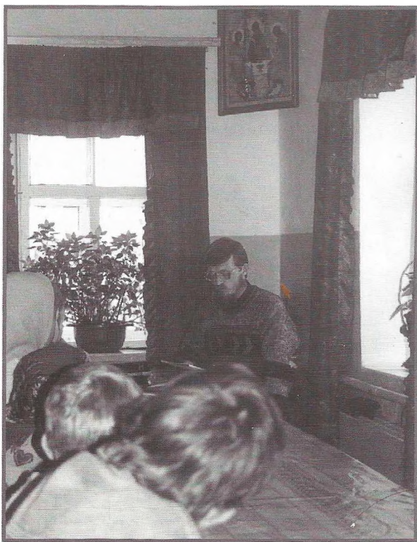
Занятия в церковно-приходской школе при храме св. Архангела Михаила в с. Михее Рязанской обл. 2002 г.

Одним из важнейших аспектов приходской деятельности (как городских, так и сельских приходов) является работа по созданию единой системы религиозного образования. При наличии выработанных Церковью общих подходов к дошкольному и школьному религиозному образованию, на практике реализуются локальные варианты, обусловленные как личностью священника-настоятеля, так и готовностью населения откликнуться на школьно-образовательные меры, реализуемые на приходе. На обследуемой территории преимущественное распространение получили воскресные школы. В большинстве приходов, в которых есть воскресные школы, занятия ведут священник и