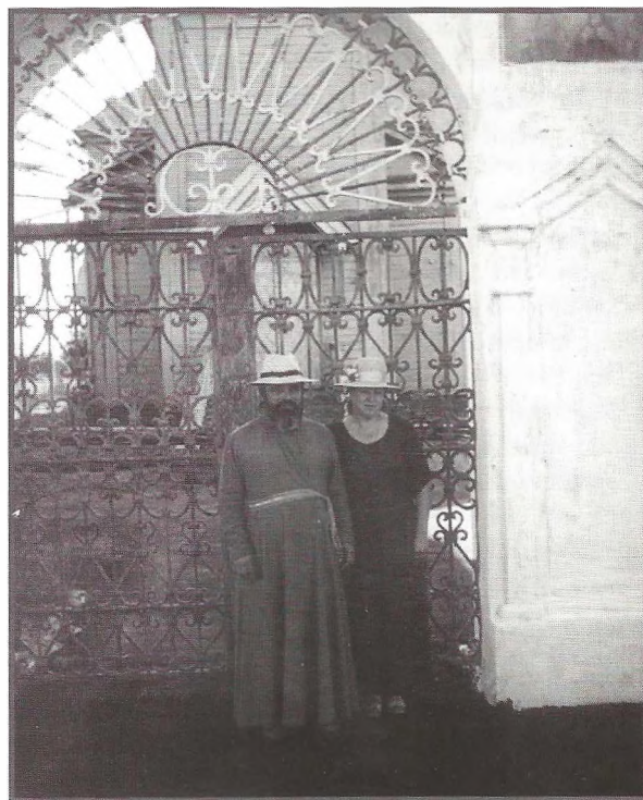
Настоятель сельского храма с матушкой. С. Малые Ясырки Воронежской обл. 2000 г.

Функция социального служения становится все более заметной в приходской деятельности. В силу того, что дальние деревни и села, будучи от-