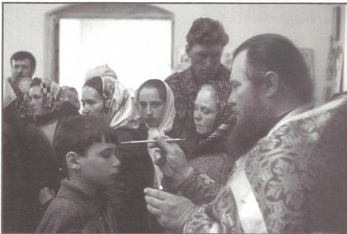
Елеопомазание во время всенощного богослужения. Г. Эртель Воронежской обл. 2001 г.

содействовать благосостоянию прихода» 2 . В обязанности прихожан входит забота о материальном содержании причта и храма.