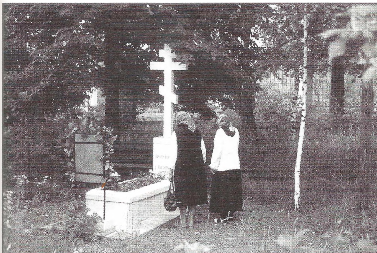
Прихожане Вознесенского собора г. Ельца возле могилы приходского священника. Г. Елец, 2001 г.

Последовавшие после революции 1917 г. осквернение, закрытие и разрушение церквей стало столь сильным эмоциональным, душевным переживанием, а для многих и духовной трагедией, что прочно и надолго закрепились в памяти переживших это людей. Практически в каждом из обследованных населенных пунктов Тамбовской области люди помнят все драматические подробности и обстоятельства закрытия храмов, надругательства над святынями, преследования и насилия над священнослужителями.