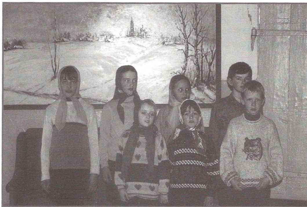
Учащиеся церковно-приходской школы при храме св. Архангела Михаила в с. Михее Рязанской обл. 2002 г.

Таким образом, даже беглое сопоставление двух воскресных школ показывает некоторые локальные особенности приходского и монастыр-