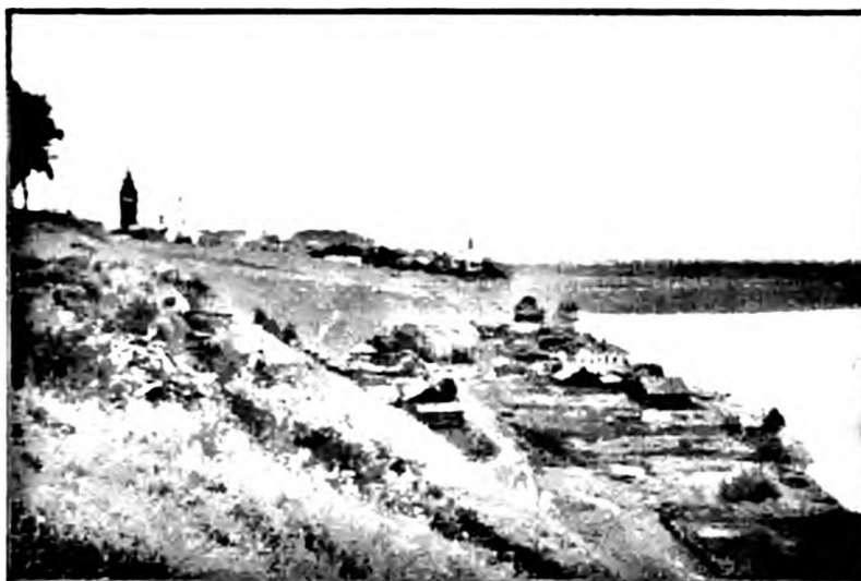
г. Чердынь, р. Калва. Справа – Иоанно-Богословский монастырь, место первого крещения жителей Чердыни в 1462 г. 2002 г.