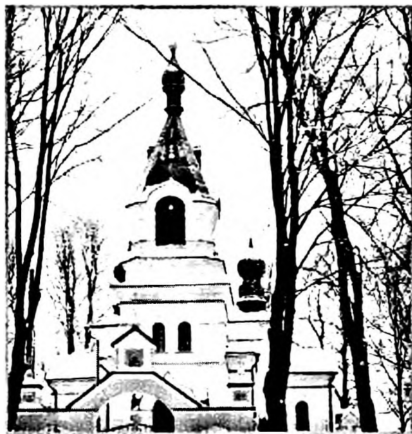
Ил. 5. Церковь свв. Космы и Дамиана в с. Рыболы. Современный вид