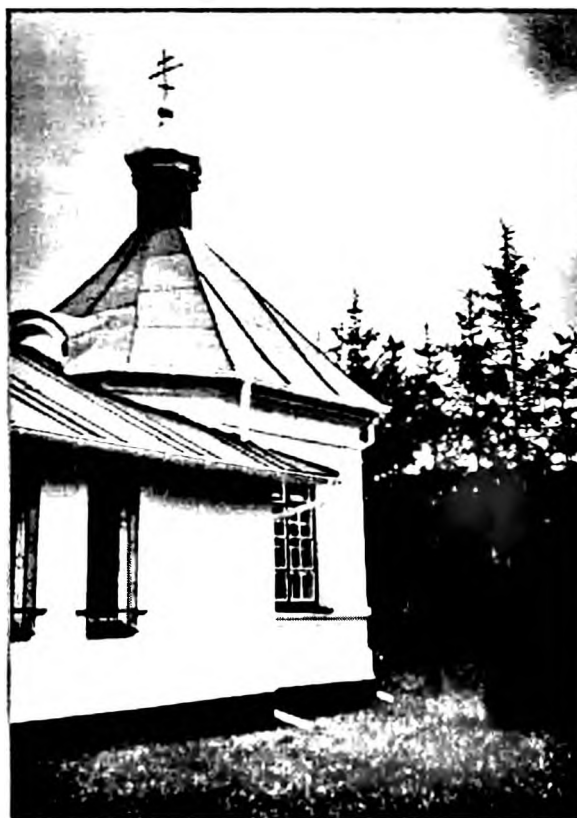
Ил. 6. Церковь св. Архангела Михаила в с. Войшки. Современный вид

Как видно из клировых ведомостей за 1891 г. в деревне Войшках на средства крестьян устроено