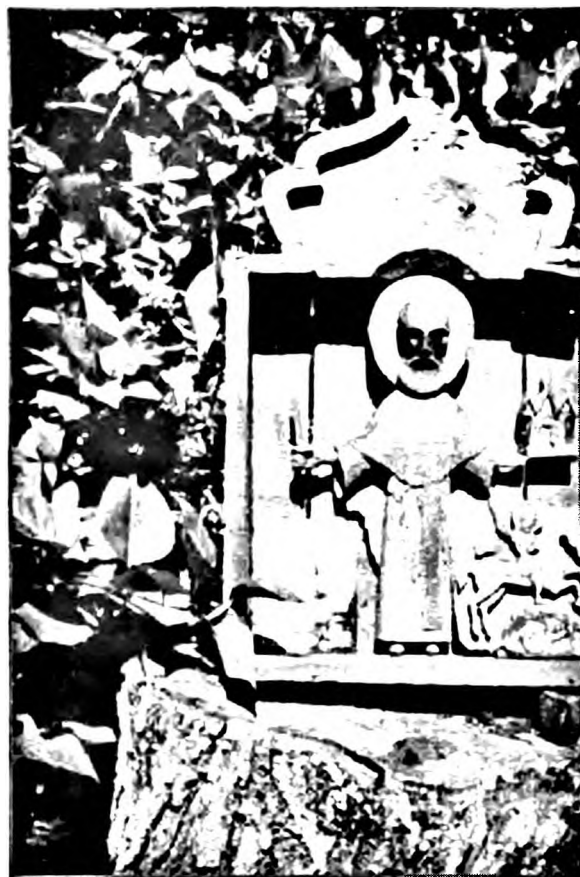
Ил. 1. Резная икона свт. Николая из частного дома с. Себино. 2001 г.