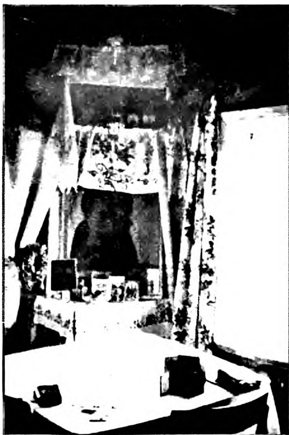
Ил. 2. Красный угол в одном из домов с. Куликовка. Икона – видимо, Патриарх Гермоген, по предположению хозяев – из Куликовской церкви. 2001 г.

вагородском... брать Ее к себе ежегодно 6 мая» 27 . Сход избрал уполномоченных – сельского и церковного старост, отвечавших за исполнение этого «суждения».