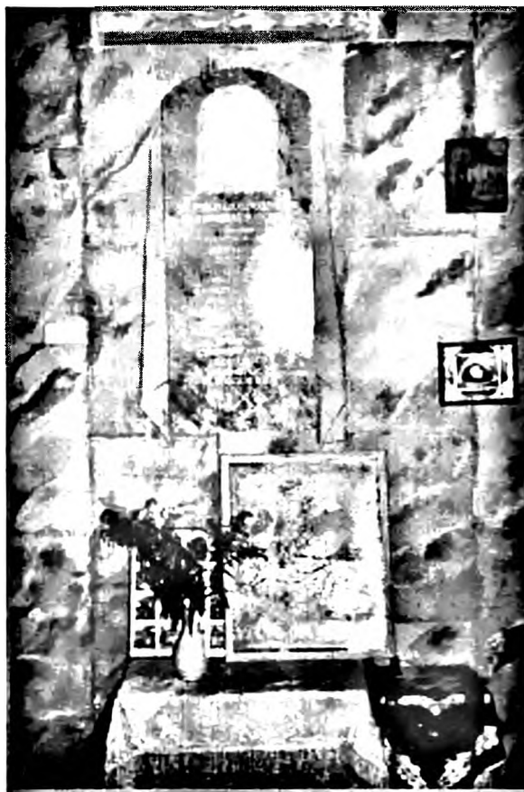
Ил. 5. Мемориальная доска морякам-воронежцам с атомной подводной лодки «Курск». Свято-Никольский (адмиралтейский) собор. г. Воронеж. 2002 г. Фото О. В. Кириченко

Собирание образованных слоев в особую группу лиц со своей идеологией проходило «волнами», и правительство время от времени гасило политический радикализм, который исходил из этой среды, принимало те или иные меры к исправлению ситуации. Различными репрессивными мерами пресекалась деятельность самых активных лиц и групп, ужесточались средства контроля над чиновниками и преподавателями из разночинцев, отличавшихся свободомыслием. В 1792 г. правительство запретило деятельность масонских лож в России, являвшихся основным генератором идеологии «интеллигентности».