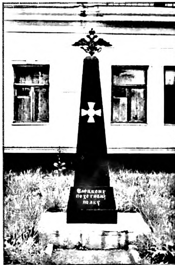
Ил. 3. г. Елец. Восстановленный в 1999 г. памятник Елецкому пехотному полку, отличившемуся в войну 1812 г.

Возникает вопрос: когда и по какой причине люди, получавшие образование и призывавшиеся влиться в число служилых лиц разных сословий, стали уклоняться от этого пути? «Интеллигентская» идеология создавалась постепенно во времени. Но всегда ее развитие стимулировали антимонархические и антидворянские настроения. Раз-