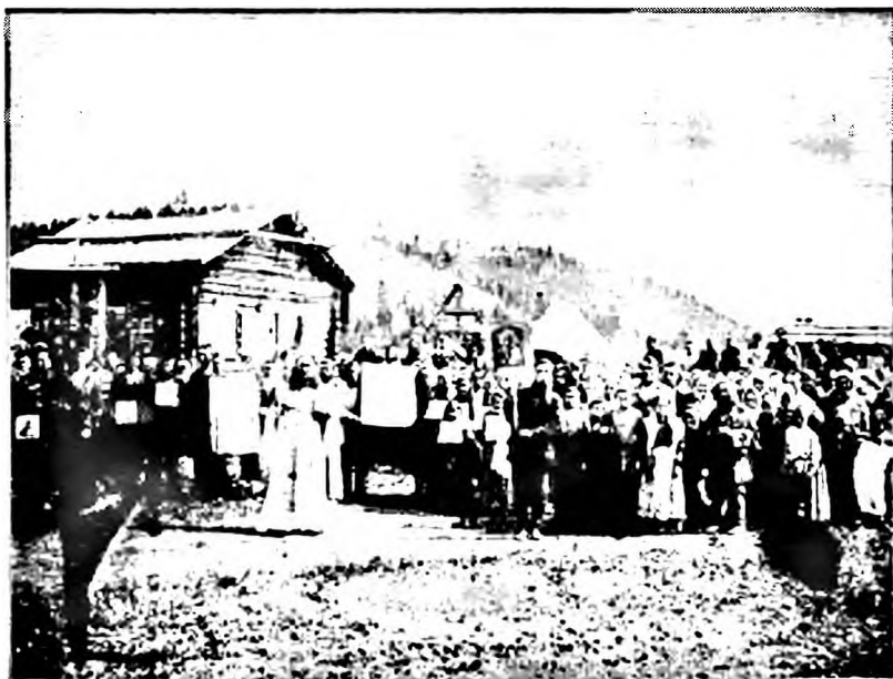
«После литургии паломники... отправились в числе более 100 человек крестным ходом по направлению к улусу Акиминскому... На снимке, при сем прилагаемом, рельефно выделяется школа, направо от нее – палатка с нашитым крестом вверх, поставленная на кладбище, где совершена первая литургия с основания Кыкэра». Л. 109 об.

16 июня 1907. Ранняя литургия совершена в здании ц[ерковно]пр[иходской] школы, которая была убрана древесными лиственничными и сосновыми ветвями усердием девиц-тунгусок. Молящихся было около 150, приобщено Св. Таин, кроме 4 взрослых, до 35 младенцев. Преподано наставление относительно порядка при крестном ходе, во время которого непозволительно разговаривать,