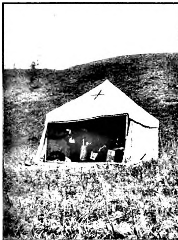
Палатка миссионера «с железной печью и другими принадлежностями, необходимыми при миссионерских поездках по тайге к орочёнам зимою, где он укрывался ночью от свыше 40° мороза, а днем совершал духовные требы и литургию». Л. 102

Уже с ноября месяца 1903 года начал я готовиться к означенной поездке, закупив нужные вещи, как-то: иконы, крестики, гайтаны, свечи, ладан, рубашки крестильные и другие вещи – для раздачи беднейшим орочёнам; а также, зная, как грязны и невообразимо тесны помещения орочён, я для совершения треб заказал особую полотняную палатку с железной печью, в каковой и жил во все время моей поездки, спасаясь в ней от лютых 40° [сорокаградусных] морозов усиленной топкой печи; в палатке помещались складные: кровать, стол для разложения на нем крестильного прибора во время совершения святого таинства крещения и стул для постановки на нем купели. Спал в мешке, сшитом из собачьих выделанных меховых шкур, которые преимущественно пред другими мехами имеют свойство быстро согревать. Также на всякий случай мною были приобретены кинжал и револьвер. С целью лучшей защиты от мороза я сшил специально для настоящей миссионерской поездки меховую куртку и меховые брюки.