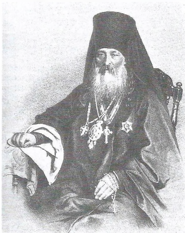
Архимандрит Антоний (Медведев), наместник Троице-Сергиевой лавры. Литографический портрет. 1863 г.

Преподобный Макарий, действовавший в глуши, весьма отдаленной от российских центров культуры, был на редкость образованным человеком. Магистр богословия, он знал древнееврейский, греческий, латинский, французский, немецкий, английский, итальянский языки. Перевел с древнееврейского Ветхий Завет. В ходе миссионерской деятельности изучил языки народов Алтая. При его участии и им самим были переведены на эти языки Евангелия от Матфея и от Иоанна, некоторые