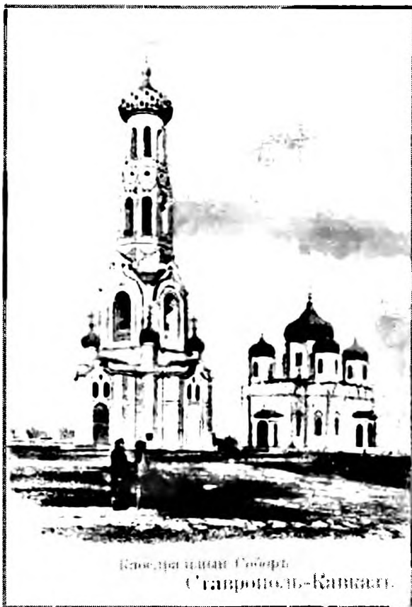
Ил. 6. Кафедральный Казанский собор с приделами в честь святителя Николая и святого Александра Невского в городе Ставрополе. 1843–1847 годы. Архитектор А. А. Тон. Собор не сохранился.

собора: из-за сокращения высоты стен верхняя пятикупольная часть стала выглядеть слишком крупной. Предполагалось разобрать верхние части выступавших концов креста, лежавшего в основе плана. План становился квадратным, с крыльцами с 3-х сторон. Перестройка собора по проекту Болотова сделала бы Троицкий собор провинциальным и лишенным гармоничного со-