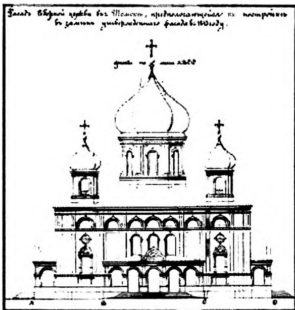
Ил. 5. Фасад Троицкого собора города Томска по неосуществленному проекту, составленному в 1855 году после провала купола. Архитекторы Болотов и Еремеев. РГИА. Ф. 218. Д. 633. Оп. 4. Л. 132

После обвала купола (1850 г.) в Троицком соборе местные епископы неоднократно (в 50 – 70-е гг.) пытались возобновить строительство. Однако городское общество и особенно городская дума со времени закладки собора сильно охладели к строительству. Хотя собор был фактически построен и оставалось лишь возвести купола и заняться внутренней отделкой, в городской думе рассматривались предложения о необходимости разобрать собор, а материал употребить на строительство Томского университета. Наступили новые времена отступления от Церкви, когда общество больше верило в науку и промышленный прогресс. «И вот тогда, убедившись, что “просвещенное” общество окончательно отверну-