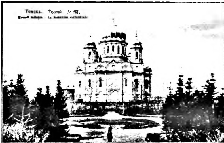
Ил. 2. Троицкий кафедральный собор города Томска с приделами в честь святителя Николая и святого Александра Невского. 1842 – 1900 годы. Не сохранился. Фото с открытки начала XX века из собрания РГБ

Епархии основывались в тех областях России, где паства особенно нуждалась в том, чтобы для упорядочения церковной жизни ее возглавил архиерей, при том условии, чтобы территория епархии и численность приходов и монастырей были доступны управлению. По этой причине становилось невозможным вновь присоединенные к государству территории механически прибавлять к ближайшей существующей епархии. Громадное расстояние между центром и периферией не позволяло архиерею иметь представление о жизни приходов. В XVIII веке смысл в открытии новых епархий был утрачен во многом и потому, что, сложившейся в начале XVIII века традиции, епископы не ездили по своим епархиям, но получали