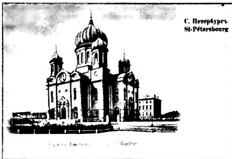
Ил. 1. Собор Семеновского полка в честь Введения Божией Матери во храм. Санкт-Петербург. 1843 – 1842 годы. Архитектор К. А. Тон. Храм не сохранился.

Христа Спасителя. В основании центрального и боковых куполов поместили ряд кокошников, что также роднит Троицкий собор с Храмом Христа Спасителя. В целом собор господствовал над всем, тогда еще деревянным, городом Томском. И пропорции, и детали, и градостроительное значение – все это отличало Троицкий собор от подобных ему храмов, наделяло только ему присущим своеобразием (ил. 2).