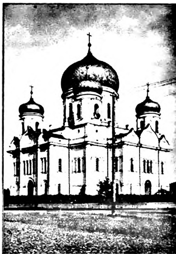
Ил. 3. Святодуховский кафедральный собор города Петрозаводска с приделами в честь Вознесения Господня и Благовещения. 1861–1872 годы. Не сохранился.