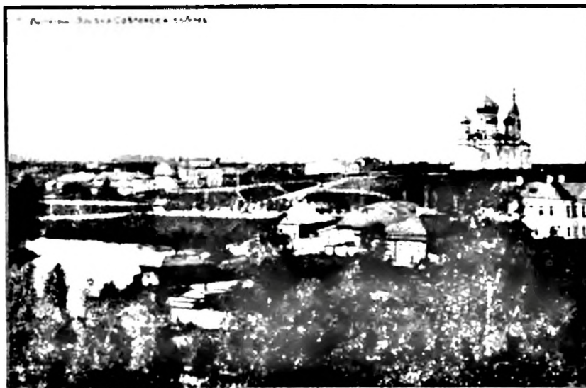
Ил. 4. Вид города Вятки Олонецкой губернии. Справа на горе – Сретенский собор. 1869 – 1873 годы. Сохранился частично.