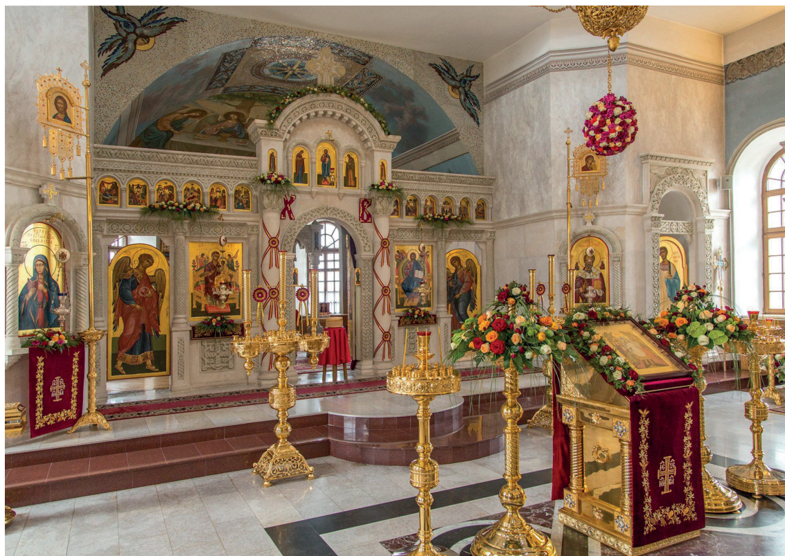
Малоярославец. Интерьер храма в Свято-Никольском Черноостровском женском монастыре.

В описании монастырской жизни Нило-Сорского скита отмечалось, что иноки исповедовали всей братии свои согрешения, стоя перед иконостасом (Романенко 1999: 107). Созерцая иконы деисуса, причастник становится «сотелесником Христовым» (Еф. 3: 6), приобщается «к прославленному Его Телу второго пришествия» только через Суд, о чем напоминает в молитвах перед причастием («суд себе