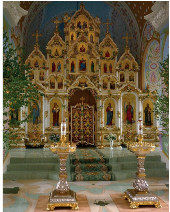
Интерьер церкви преподобного Серафима Саровского в Екатеринбурге.

Иконостас имеет литургическое и созерцательное значение, как зрительное наставление. Отец Павел Флоренский писал, что он необходим как костыль «по немощи духовного зрения молящихся», как «некоторое пособие духовной вялости», чтобы «отмечать, закреплять вещественно» образы горнего мира, открывать невежеству и самолюбию о Царствии Небесном. «Но вещественный иконостас не заменяет собою иконостаса живых свидетелей и