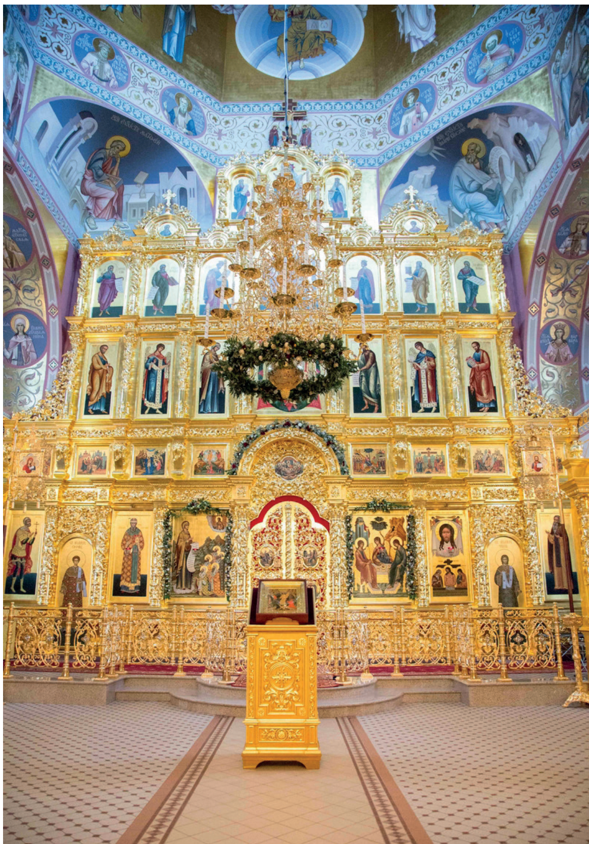
Иконостас Свято-Троицкого кафедрального собора г. Саратова.