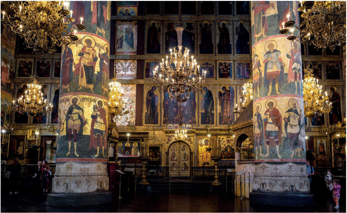
Москва. Успенский собор Московского Кремля. Внутреннее убранство.