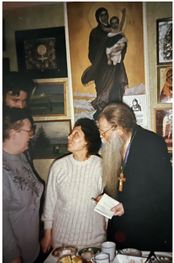
Воскресная встреча с духовными чадами на квартире о. Михаила. 1995.