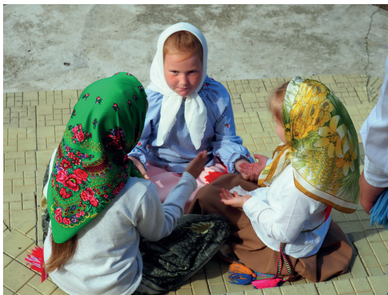
Дети на ступенях Вознесенской церкви в с. Гиндерешт. 2019 г.

Старообрядцы удивляются, что у румын причащают всех желающих, которые постятся два дня и берут причастие, «и потом молоко пьют, колбас. Они говорят, что у них разрешается, но нигде у них в книгах этого нет. И это священники, чтобы не потерять их, разрешают. Но это совесть