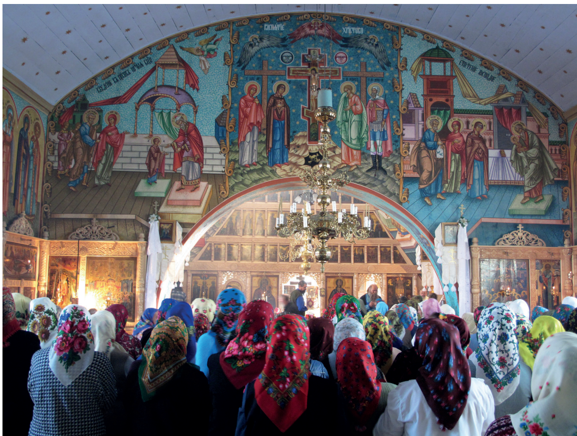
В церкви Рождества Богородицы с. Сарикёй. 2019 г.

У старообрядцев-липован не принято убирать в доме в этот день, а тем более стирать. Красить яйца и печь паски (слово «кулич» не употребляют) начи-