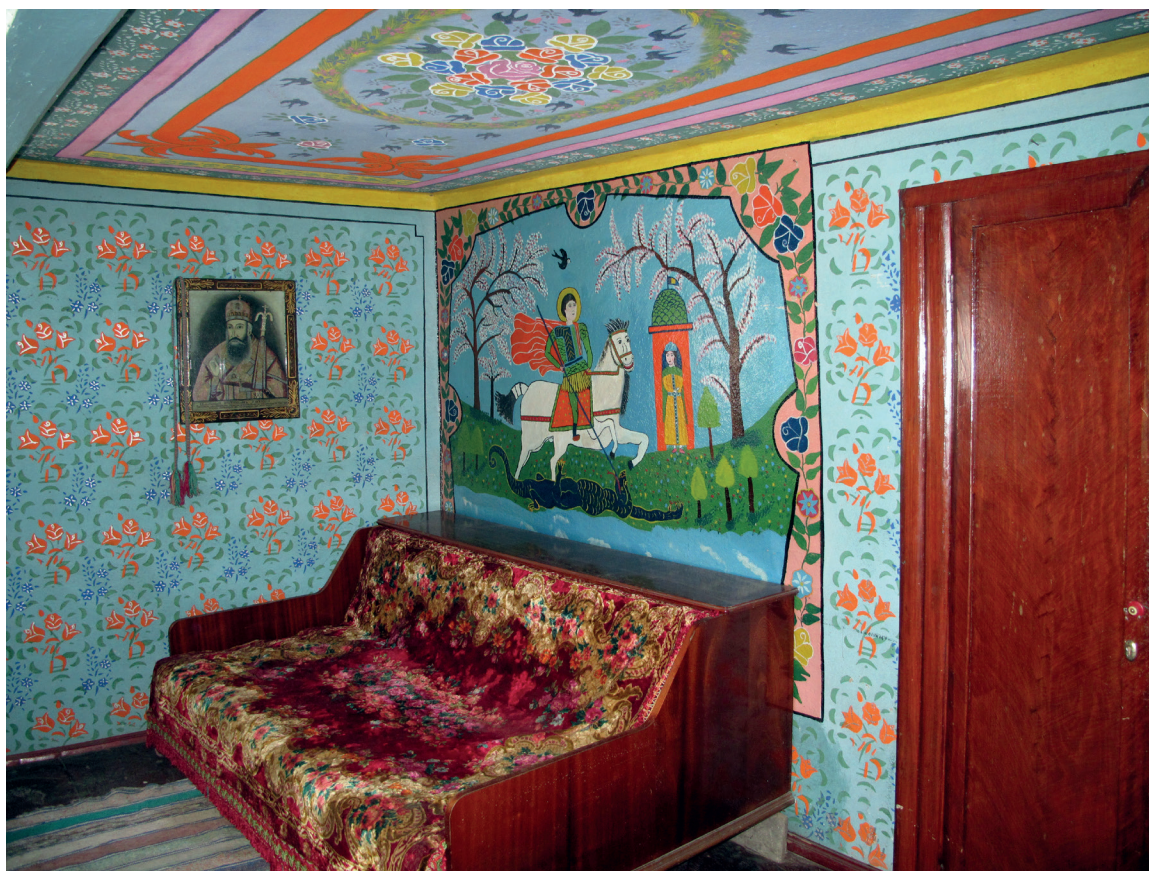
Изображение Георгия Победоносца в интерьере жилого дома в с. Сарикёй. 2010 г.

Сострой церковь на Сионской горе, Поставь в церкви восковые свечи. Пушай люди ходиють и Богу молюца, А еще и поют аллилуйя, Аллилуйя, слава тебе Боже.