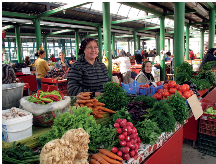
Липоване со своими продуктами на рынке города Тыргу Фрумос. 2009 г.

Повсеместно липоване делали маратуру – разные маринованные овощи, квасили капусту кочанами и дробную , измельченную на терке, солили огурцы. В Братештах, где традиционно занимались огородничеством, мариновали в кадушках по 200 кг овощей и даже по 500 кг. Огородничеством издавна занимались и липоване г. Тыргу Фрумуса; часть овощей они продавали на рынках, а часть оставляли себе для постов. В Добрудже из-за проблем с водой липоване предпочитали закупать привозные овощи у румын и болгар.