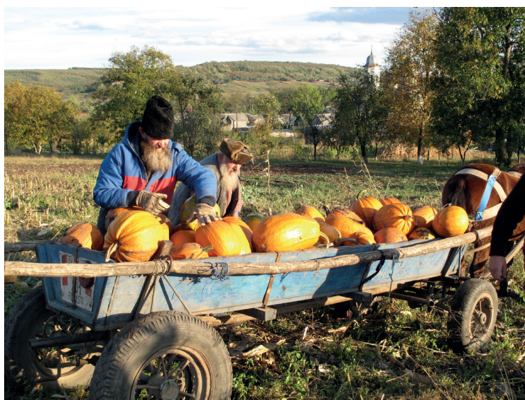
Сбор урожая тыквы. Село Мануиловка. 2009 г.

Много места в постной кухне липован всегда занимали сухофрукты. Буковинские липоване еще в