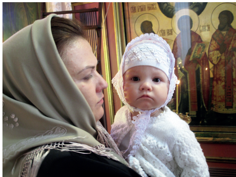
В Троицкой церкви с. Камень. 2017 г.

Молиться ходили натошак. Для детей в Братештах матери делали тоненькие круглые постные лепешки. Их давали детям, когда те ходили Богу молиться, и их же ели в субботу после причастия: «Это лепешки. Их клали одна на другую и смазывали водой с медом. Они помякнут, да такие скусные. Мама наша делала» (1938 г. р., 2017). «Когда Богу молиться, обварушки кушали, потому что они деланы из пресного теста.