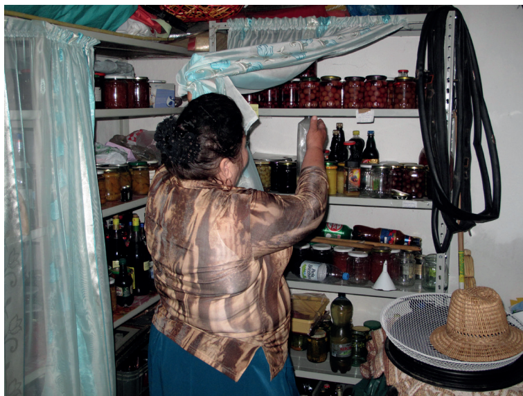
Кладовая с домашними заготовками. Село Камень. 2017 г.

В Великий пост на столе было много мучных блюд, причем липоване сами говорят, что пироженники (пирог) делали в пост чаще, чем в другое