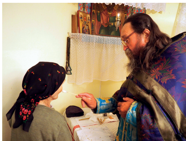
Соборование. Село Мануиловка. 2019 г.

Несомненно, секуляризация религиозного сознания старообрядцев-липован идет давно и этому много способствовало отходничество. Трудовая миграция за границу, которая последние два десятилетия только нарастает, включение в европейское информационное пространство буквально разъедают липованское общество. Молодые люди уже даже не скрывают, что не соблюдают пост, что раньше было невозможно даже представить. «А таперича пошла я в лавку первую неделю поста хлебушка куплять, – с возмущением и удивлением рассказывала информант из Сарикёя. – Он куплять брынзу, он