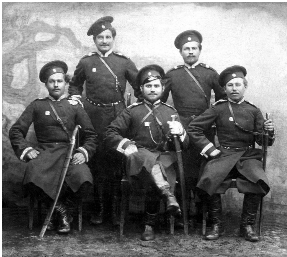
Астраханские казаки. Конец XIX в.

В 2008 г. В. С. Бузин и С. Б. Егоров обосновали выделение субэтносов «в соответствии с факторами их образования, поскольку именно они определяют наиболее существенные характеристики групп русского населения такого рода» (Бузин 2008: 316–317). Основным фактором формирования субэтносов русских исследователи определили колонизацию новых территорий, массовость которой «имела разные виды – и переселение небольших групп, отры-