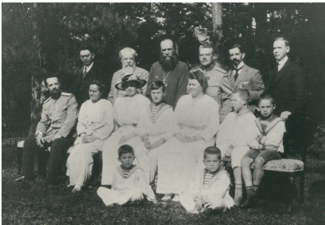
Преподаватели и персонал учебной части императорской семьи. Царское Село. 1916 г.