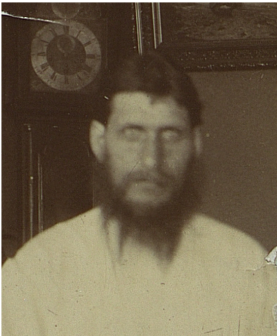
Г. Е. Распутин. Санкт-Петербург. 1914 г.

В отличие от воспоминаний, в письмах к П. В. Петрову С. И. Тютчева довольно часто пишет о Распутине. Каждый раз упоминания об этой личности сопровождаются резко негативной оценкой. «Дьявол», «бес», «темная сила», «пререкаемый человек», – вот лишь некоторые имена, которые употребляет в письмах С. И. Тютчева в отношении Распутина.