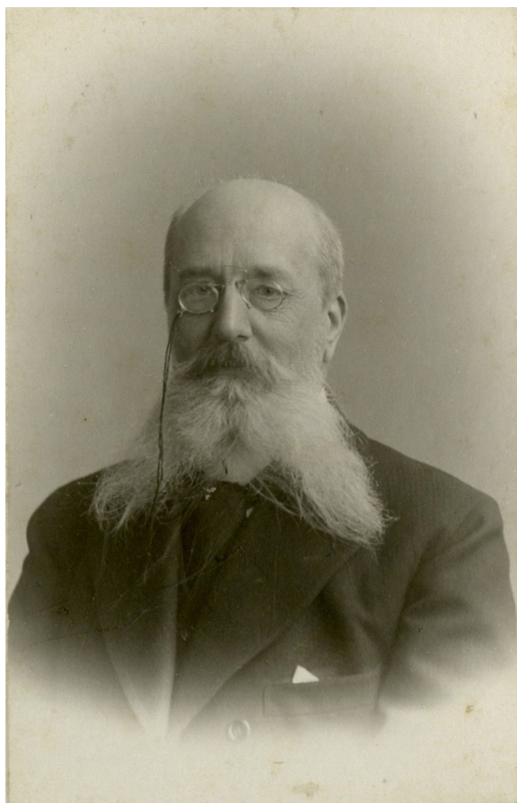
Иван Федорович Тютчев. Москва. 1890-е годы.

Яркий эпизод, характеризующий общественно-политические взгляды И. Ф. Тютчева, случился в 1905 г. В разгар революции 1905–1907 гг. появляется «самаринская записка» 2 – обращение к императору