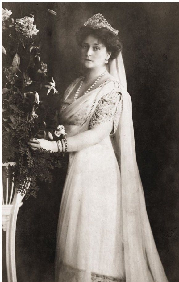
Императрица Александра Фёдоровна. 1911 г. ГА РФ. Ф. 601. Оп. 1. Д. 2157. Л. 32

вает их отвечать любовью и лаской на все проявления народного чувства. Мне хочется, чтобы их знали и любили; не только моряки со Штандарта, а все, с кем они имеют или могут иметь соприкосновение. Я всегда старалась им это внушить, всегда в путешествиях, когда видела толпы народа, собравшегося на станциях, я убеждала детей, хотя из окна вагона поклониться этим людям, с такой любовью ожидающим их; ведь для этих людей одна их улыбка, один ласковый кивок головы дороже золота. И этого не поняли! Кто-то из нашей среды нашелся такой, что объяснил все это Царице в превратном смысле, и мне от Нея страшно влетело в присутствии всей свиты, что я желаю “Детей выставлять, а что Она это запрещает”. А в этом-то не выставлении, а приветливом отношении к народу вся их сила. Чем берет Императрица М.<ария> Ф.<едоровна>, именно этой ласковой приветливостью; ведь как Ее любят в народе. Иначе как “наша” не называют. Вот мне хочется, чтобы и девицы были так же популярны и любимы, а не ограничивались бы только моряками и горстью якобы друзей...” (ГА РФ 76: Л. 74 об – 75 об.).