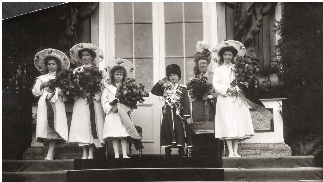
Софья Ивановна Тютчева с детьми императора Николая II на балконе Екатерининского дворца. Царское Село. 1911 г. ГА РФ. Ф. 601. Оп. 1. Д. 2161. Л. 56