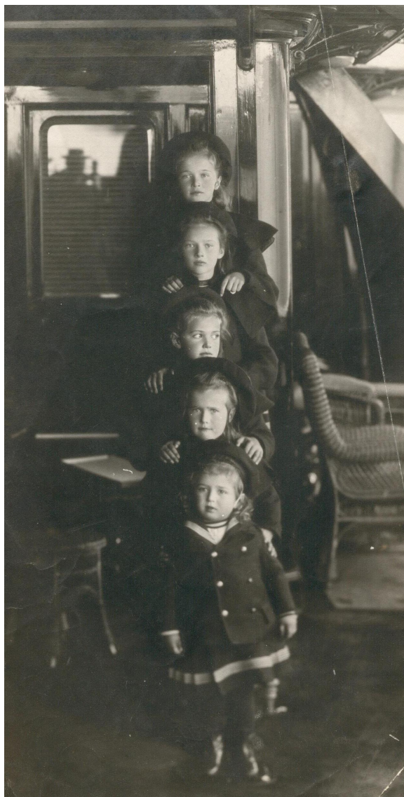
Дети императора Николая II. 1907 г. ГА РФ. Ф. 601. Оп. 1. Д. 2162. Л. 28

Когда Софья Ивановна вступила в должность, ее воспитанницам было: Ольге Николаевне 11 лет, Татьяне Николаевне – 9, Марии Николаевне – 7 и