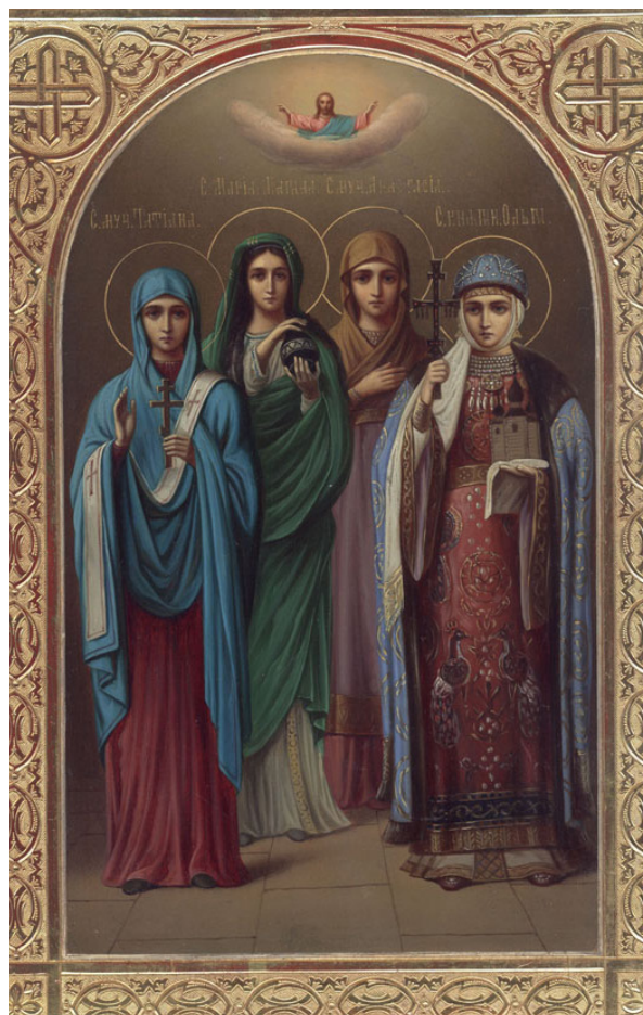
Икона св. мученицы Татианы, св. равноапостольной Марии Магдалины, св. мученицы Анастасии и св. благоверной княгини Ольги. Частное собрание

В семье потомков Ф. И. Тютчева хранится уникальная икона с образами четырех святых: благоверной княгини Ольги, мученицы Татианы, Марии