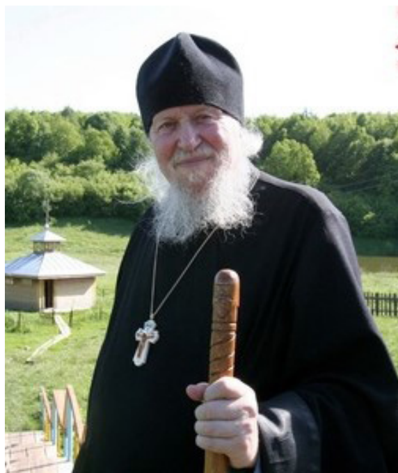
Архимандрит Петр (Кучминский).

Письмо № 8. От иеромонаха Ермогена (Росицкого) 11 , из г. Бийска Алтайского края. Дата в письме отсутствует