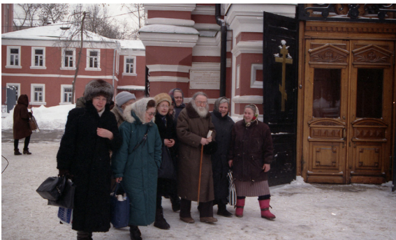
Протоиерей Михаил Труханов беседует с духовными чадами рядом с храмом святого Пимена Великого. Москва. 1990-е годы.