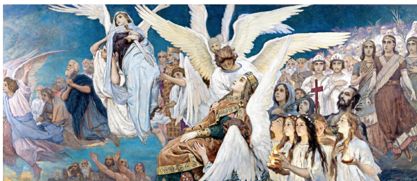
В. М. Васнецов. «Радость праведных о Господе. Преддверие Рая». Эскиз росписи барабана центрального купола Владимирского собора в Киеве. 1893. Трехчастная композиция. Правая и левая части эскиза. ГТГ (Васнецовы 2024: 176–178)

Таким образом, все творческое высказывание В. М. Васнецова приобретает поразительную цельность и обретает тот самый смысл, которым напол-