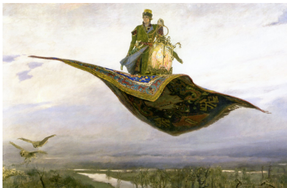
В. М. Васнецов. «Ковер-самолет». 1880. Нижегородский Государственный художественный музей (Васнецовы 2024: 39)

В. М. Васнецов до конца остается верен этому своему «рецепту спасения» – «перелетать» нагромождения зла, кровавые поля и закаты, зная, что они будут, и – не бояться их, потому что Церковь по природе своей принадлежит иной – спасенной – реальности, иной природе, иному устройению; ее не могут одолеть грядущие на Вселенную последние страшилища уже побежденного Христом Спасителем мирового зла. В этом контексте картина «Ковер-самолет», созданная Васнецовым во время Гражданской войны и в тяжелые послереволюционные годы (1920–1925), это, несомненно, образ Христа и Его Церкви, пребывающих в вечности в полном покое, проносясь над кроваво окрашенным пейзажем.