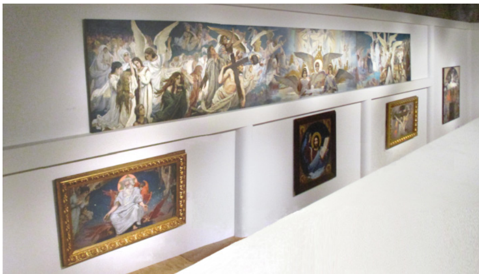
Выставка «Васнецовы. Связь поколений. Из XIX в XXI век». Новая Третьяковка, Москва, Крымский Вал, 10. Май - ноябрь 2024. Экспозиция зала с эскизами росписей Свято-Владимирского храма в Киеве.

Ибо никогда пророчество не было произносимо по воле человеческой, но изрекали его святые Божии человеки, будучи движимы Духом Святым. 2 Пет. 1: 21