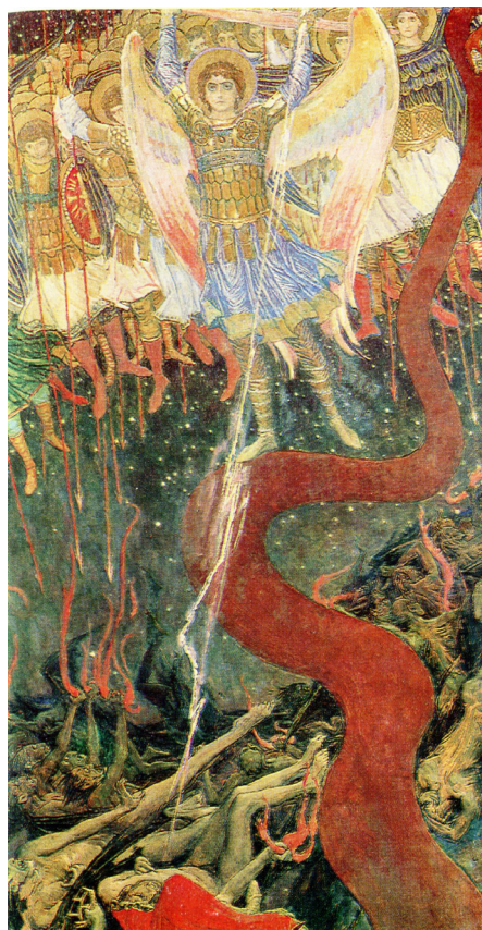
В. М. Васнецов. «Архангел Михаил». 1915. ГТГ. Дом-музей В. М. Васнецова (Васнецовы 2024: 29)

«незапечатленных» Божественной печатью (Откр. 9: 4) и особенно тех, кто примет печать антихриста (Откр. 14: 9–10). «В Апокалипсисе сказано: “Блажен читающий словеса книги сия” (Откр. 1: 3)... – говорил по этому поводу преподобный Варсонофий Оптинский (Плиханков). – Но в чем же заключается это блаженство?.. Тот, кто будет читать Апокалипсис... будет поистине блажен, ибо будет понимать, что совершается. А понимая, будет готовить себя» (Оптина 1997: 234).