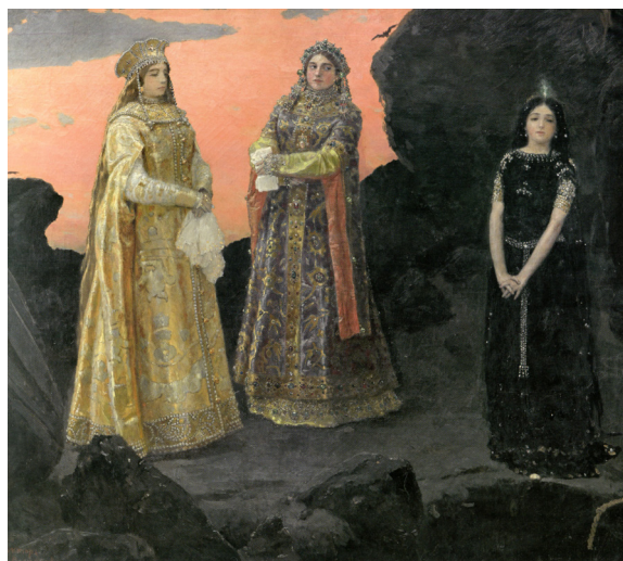
В. М. Васнецов. «Три царевны подземного царства». 1879–1881. ГТГ (Третьяковская галерея. 2024. № 1 (82): 16)

Здесь важно иметь в виду также то, как сам художник определял истоки своего творчества и мировоззрения. В одном из писем В. В. Стасову, просившему о материалах для биографии, Виктор Михайлович сопоставляет себя с Сергеем Тимофеевичем Аксаковым: «Ведь если все припоминать... придется вспомнить и детские годы, как я жил в селе... слушал песни и сказки, заслушивался, сидя на печи при свете и треске лучины... И право, все такие подробности ничуть не менее имели значение в моей жизни и развитии, чем то, что я Вам сообщал и сообщаю, а скорее даже более. Но ведь, если все писать, то выйдет целая книга вроде “Семейной хроники” Аксакова!» (Васнецов 1987: 154–155). Иначе говоря, подобно тому, как С. Т. Аксаков был выразителем русской народной души (причем понятой в конечном счете вне сословных различий) в литературе, так В. М. Васнецов стал выразителем русского народного мироощущения на языке изобразительного искусства и даже, отчасти, архитектуры 3 . Однако в сравнении с С. Т. Аксаковым Васнецов еще более религиозен и, безусловно, более церковен. Известно, какую роль в его воспитании сыграл его отец-священник. Приведем еще раз извест-