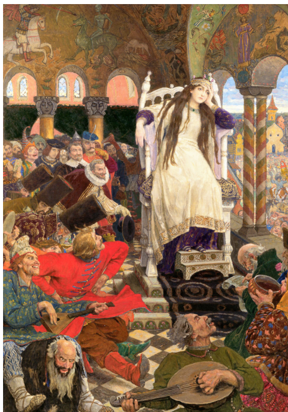
В. М. Васнецов. «Царевна-Несмеяна». 1916. ГТГ. Дом-музей В. М. Васнецова (Васнецовы 2024: 39)