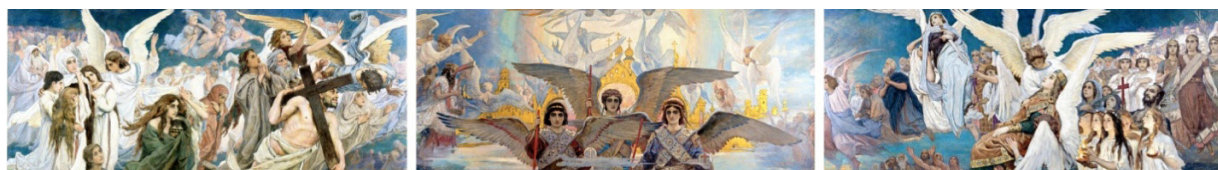
В. М. Васнецов. «Радость праведных о Господе. Преддверие Рая». Эскиз росписи барабана центрального купола Владимирского собора в Киеве. 1893. Трехчастная композиция. ГТГ (Васнецовы 2024: 176–178)