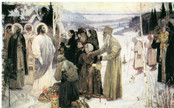
М. В. Нестеров. «Святая Русь». 1901–1903.

Васнецову наследует Михаил Васильевич Нестеров, сформировавшийся, по его собственным словам, в значительной мере на лесах того же Владимирского собора, где он помогал Васнецову в росписях. Нестерову наследует П. Д. Корин.