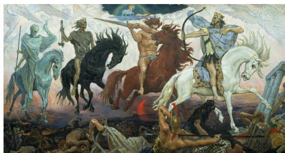
В. М. Васнецов. «Всадники Апокалипсиса». 1887. Эскиз росписи. Государственный музей истории религии (ГМИР), Санкт-Петербург (Васнецовы 2024: 190–191)

Апокалиптическая тема продолжала быть одной из главных для В. М. Васнецова до конца жизни. Из его писем можно видеть, что он, как и многие русские мыслители тех лет, находил перекличку современ-