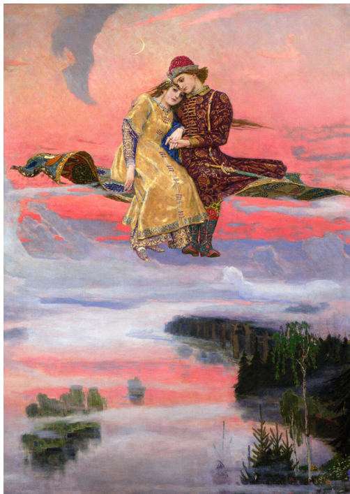
В. М. Васнецов. «Ковер-самолет». 1920-1923, 1925. ГТГ. Дом-музей В. М. Васнецова (Васнецовы 2024: 48)

В. М. Васнецов до конца остается верен этому своему «рецепту спасения» – «перелетать» нагромождения зла, кровавые поля и закаты, зная, что они будут, и – не бояться их, потому что Церковь по природе своей принадлежит иной – спасенной – реальности, иной природе, иному устройению; ее не могут одолеть грядущие на Вселенную последние страшилища уже побежденного Христом Спасителем мирового зла. В этом контексте картина «Ковер-самолет», созданная Васнецовым во время Гражданской войны и в тяжелые послереволюционные годы (1920–1925), это, несомненно, образ Христа и Его Церкви, пребывающих в вечности в полном покое, проносясь над кроваво окрашенным пейзажем.