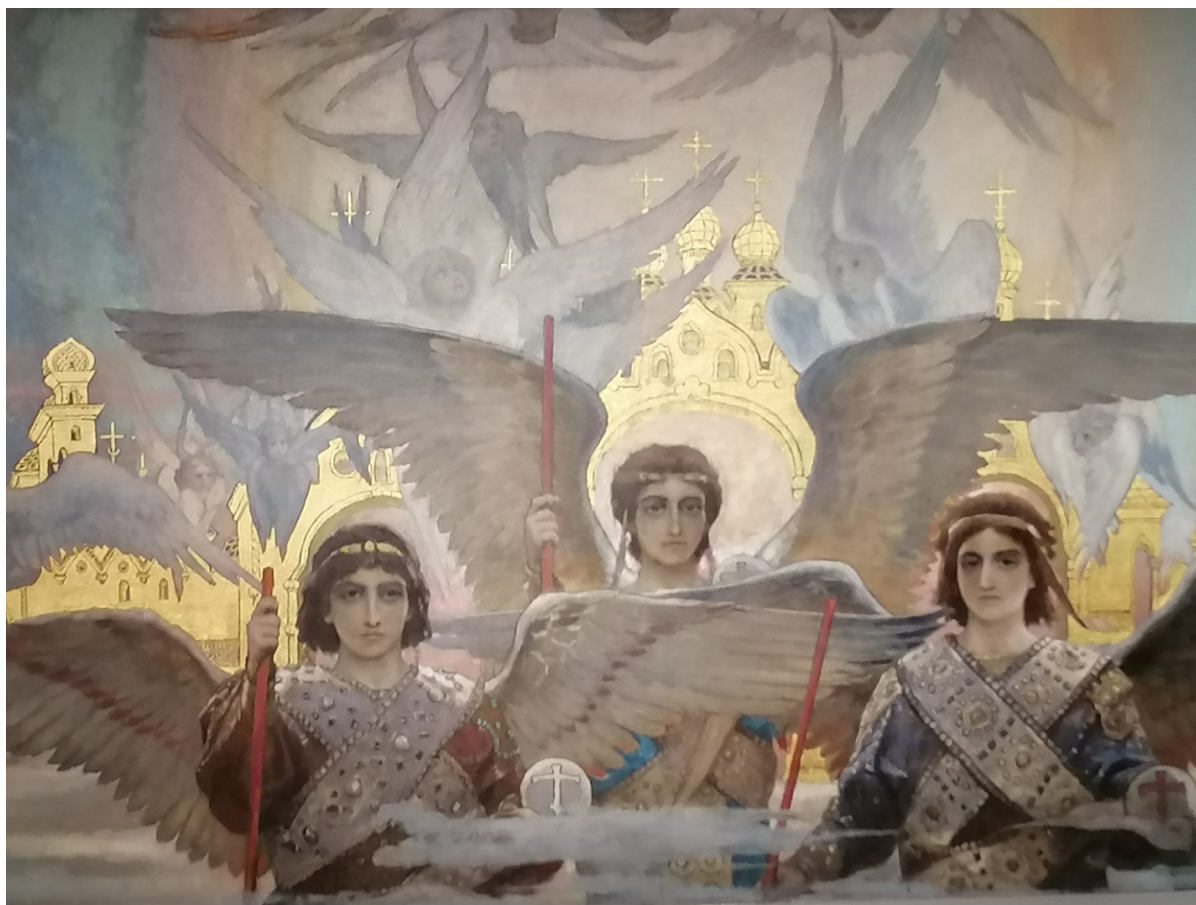
В. М. Васнецов. Пресвятая Троица. Центральная часть росписи барабана центрального купола Владимирского собора в Киеве «Радость праведных о Господе».

Фотография с выставки «Васнецовы. Связь поколений. Из XIX в XXI век».