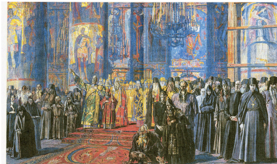
П. Д. Корин. «Русь уходящая». 1935–1959. Эскиз. ГТГ (П. Корин. Избранные произведения. М., 1985. Илл. 49)

Тивериадском и после Воскресения: «Ободритесь, это Я, не бойтесь» (Мф. 14: 27), «Я с вами во вся дни до скончания века» (Мф. 28: 20). Смысл этих картин в том, чтобы накануне грядущих бед люди знали, что Бог не оставил Свой народ, то есть «род избранный» – Церковь, что это Он идет и ведет ее через бури, воздвигаемые беснующимся злом мира сего.