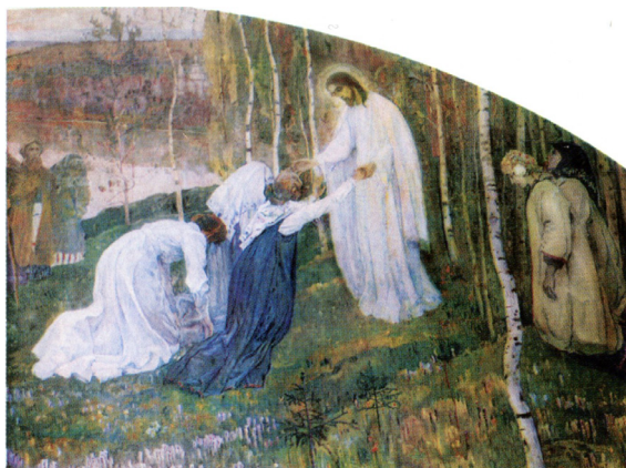
М. В. Нестеров. «Путь ко Христу».

Все три – могут быть, в некотором смысле, названы новыми Евангелистами последних времен, потому что они летописцы – в образном, иносказательном, «притчевом» языке – путей святости, путей Церкви Христовой в Новейшей истории мира. А поскольку Церковь есть, по словам апостола, Тело Христово (Еф. 1: 23), то они летописуют пути Самого Христа, продолжающего в образе Церкви Свое шествие через дебри истории, ведя «Своих» к вратам Своего Царства. Не случайно поэтому у Нестерова в нескольких картинах настойчиво появля-