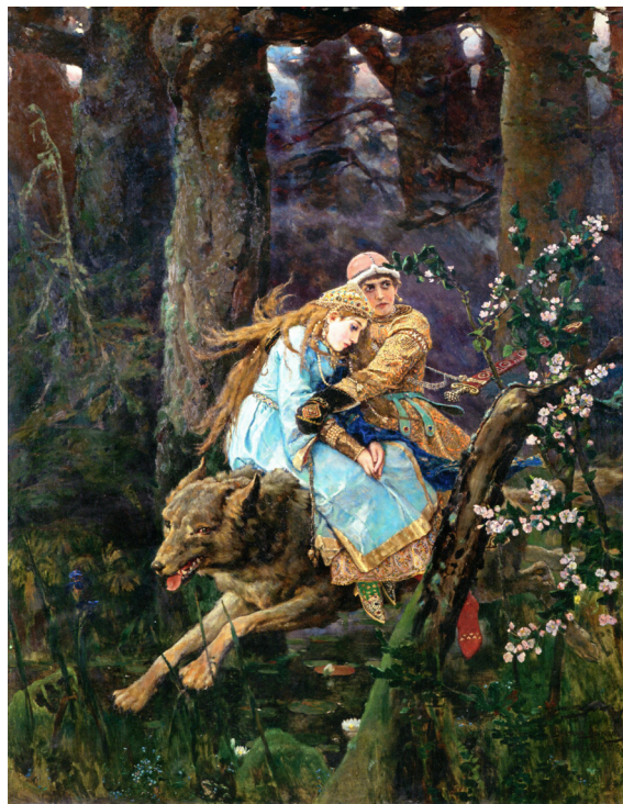
В. М. Васнецов. «Иван-царевич на Сером Волке». 1889. ГГГ (Васнецовы 2024: 39)

В картине «Три царевны» 5 , выполненной для кабинета правления Донецкой железной дороги (по заказу С. И. Мамонтова, фактически – для прославления коммерческой деятельности и технического прогресса), В. М. Васнецов по существу дает «определение» монашества: две царевны прекрасны, богаты, «одна другой лучше», но что-то «из ряда вон» в третьей – без золота и самоцветов, одетой в черное, со звездой на голове.