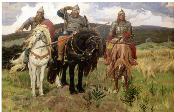
В. М. Васнецов. «Богатыри». 1881–1898. ГТГ (Васнецовы 2024: 134)

Васнецов заменил отвергнутые сюжеты, как он сам писал, «даже более подходящим» вариантом – композициями на сотериологическую тему: «Единородный Сыне»; «Бог-Отец, жертвующий Своим Единородным Сыном во спасение людей» (Васнецов 1987: 84); «Распятие Христово». Результат получился действительно безусловно лучшим с точки зрения его включенности в задачи богослужения. Однако тема отклоненных эскизов, очевидно, продолжала приковывать внутреннее внимание художника. Она продолжала существовать в камерном пространстве его собственных размышлений, развившихся в жанре «притчи» – сказки.