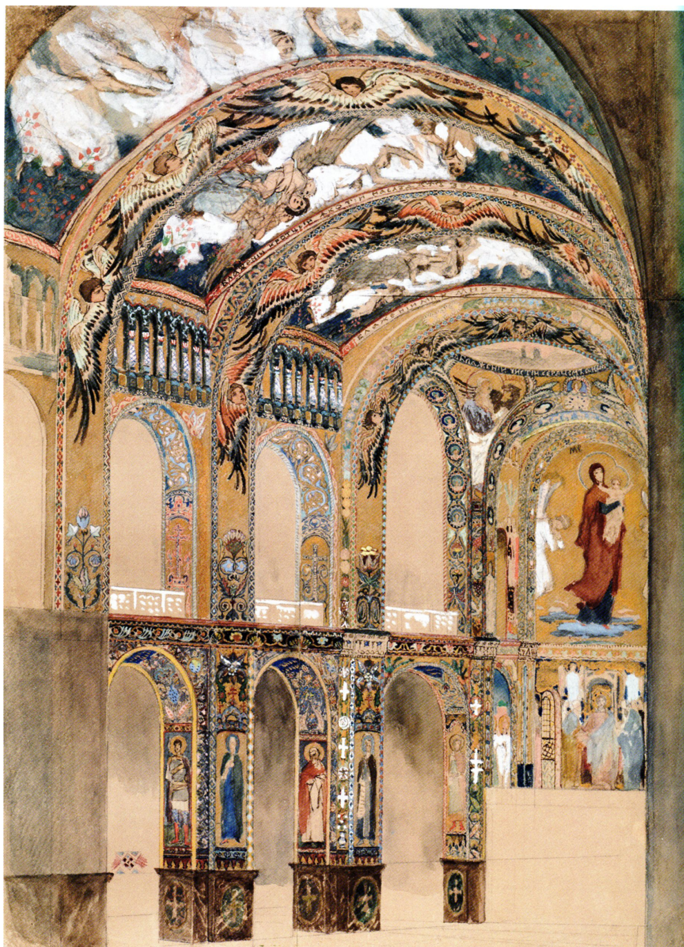
В. М. Васнецов. Первоначальный проект росписей главного нефа Владимирского собора. 1885 г. ГТГ (Васнецовы 2024: 194)

написано, – писал Васнецов Стасову, – “Как прямо ехать – живу не бывати – нет пути ни прохожему, ни проезжему, ни пролетному”. Следуемые далее надписи: “направу ехать – женату быти; налево ехать – богату быти” – на камне не видны, я их спрятал под мох и стер частью» (Васнецов 1987: 156). По сюжету иллюстрируемой Васнецовым былины, витязь едет прямо и побеждает всех врагов, затем едет направо и освобождает других рыцарей,