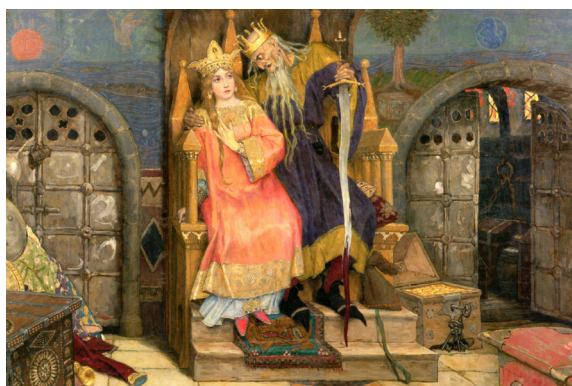
Васнецов. «Кашей Бессмертный». 1917–1919. ГГГ. Дом-музей В. М. Васнецова (Васнецовы 2024: 159)

В большинстве работ (независимо от названия) главным персонажем является некая «Царевна», которая то едет на сером волке, то летит на ковре-самолете, то сидит Царевной-Несмеяной посреди шутовского балагана, причем интересно, что всюду она абсолютно неподвижна, ни внешне, ни внутренне не коррелирует с окружающей обстановкой. Можно сказать, что все эти «сказочные» сюжеты являются притчами о «христианской душе» в «мире сем», о ее путешествии через сказочные поля зла, страшных чудовищ, Кощеев, Змеев и пр. Но говоря шире, в целом основная тема В. М. Васнецова, конечно же, Церковь, ее пути по дорогам земной истории, встречающиеся ей духовные опасности и духовные способы избавления от них.