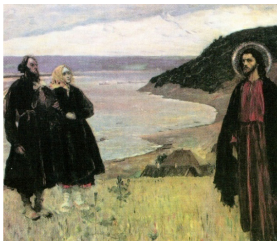
М. В. Нестеров. «Путник». 1921. Тверская картинная

Смысл появления этого Образа в картинах Нестерова, созданных накануне и во время ужасных событий мировой войны и революции, тот же, что и в Евангелии в явлении Христа ученикам на море