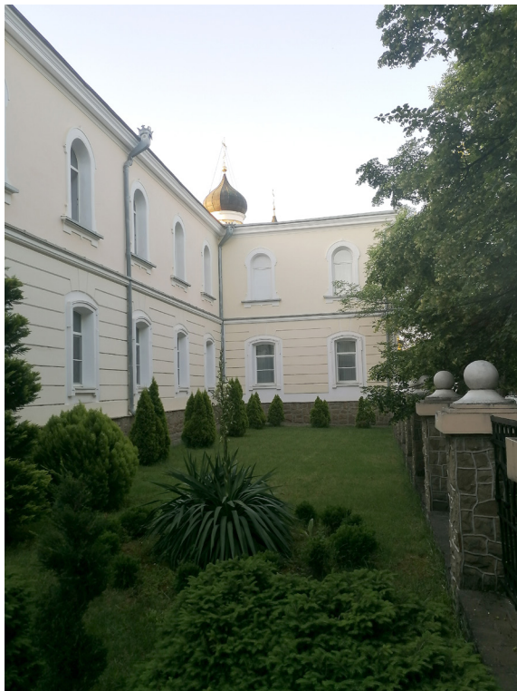
Епархиальная духовная семинария г. Симферополь. Современный вид.

по идеалу», а «по ситуации», «по обстоятельствам»; этот последний суд более напоминает промысел Божий, о чем архимандрит Вениамин специально сказал в прощальном слове (Прощальное слово 1912: 465–468). Очевидно, людей волновал вопрос о неправомерности происходящего.