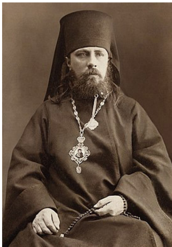
Архиепископ Пермский и Соликамский Иринарх (Синеоков-Андриевский, 1871–1933)

В 1917 г. в Крыму, по новому положению, избрание ректора было возможно только на конкурсной основе. Прежний ректор Таврической семинарии, архимандрит Иринарх, был затребован Синодом на епископскую хиротонию в Петроград, после чего определен на свободную епископскую кафедру в