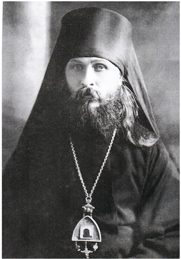
Епископ Вениамин (Федченков)

Мы отталкиваемся от того, что это были два духовно очень разных человека. Святитель Димитрий – натура цельная, сугубо христианская, церковная, аскетичная; как личность – традиционалист, консерватор, человек «правых убеждений», монархист, славянофил, как понимал эту идею Н. Я. Данилевский. Все около- и нецерковное он понимал как область для миссионерства, как и все безнравственное, сектантское, языческое, требующее духовного врачевания и изменения. Действуя везде церковно, в рамках строго святоотеческих подходов внутри Церкви, рядом с Церковью и далеко за ее пределами, он везде был целен и ясен в своей цельности. Иное дело митрополит Вениамин, человек хотя и церковный, любящий аскетику, особенно в зримых конкретных образцах подвижничества и святости (что и заставляло