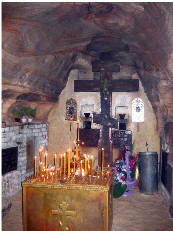
Пещера, где находится захоронение митрополита Вениамина (Федченкова). Псково-Печерский мужской монастырь. 2006 г.

Димитрий выполняет роль скорее послушника патриарха и собора, нежели инициатора хиротонии. Судя по всему, инициатива (опять в мягкой форме) была на стороне самого архимандрита Вениамина. Таким образом, после более чем годового отсутствия в Таврической семинарии, уже в статусе епископа, он и был встречен семинаристами (почему-то не упоминаются ни преподаватели, никто другой) «с сердечной любовью». Но и после февраля 1919 г. епископу не удалось потрудиться на посту ректора Таврической духовной семинарии, потому что Севастопольское викариатство, да и разгорающаяся Гражданская война, активное участие в Белом движении на Юге в качестве епископа Белой Армии и Флота, заменившего на посту главы военного и морского протопресвитера о. Георгия Щавельского, – требовали особых сил и времени. Таким образом, его ректорство в 1917–1919 гг. в Таврической духовной семинарии можно считать формальным, поскольку все это время он отсутствовал, находясь в командировках.