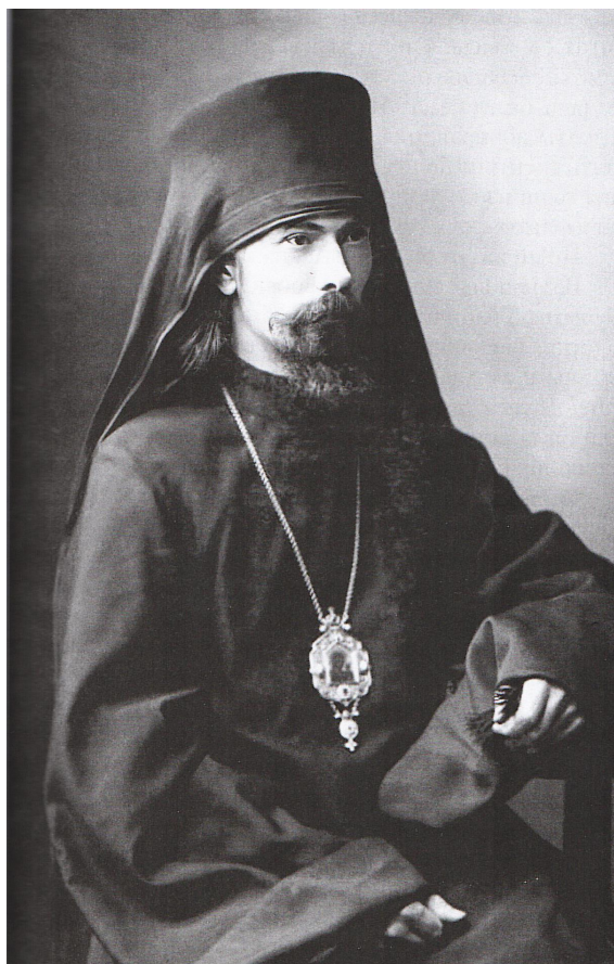
Епископ Феофан (Быстров)

Архимандрит Вениамин (Федченков) находился на посту ректора Таврической духовной семинарии с 21 декабря 1911 г. до 26 августа 1913 г. Епископ Феофан покинул Таврическую епархию 25 июня 1912 г., но архимандрит Вениамин остался в Крыму и при новом архиерее епископе Димитрии (Абашидзе), продолжая исполнять обязанности ректора Таврической духовной семинарии. Духовный сын не отправился «в астраханскую ссылку» вместе со своим духовным отцом. Этот момент и позволяет нам говорить напрямую о «карьерных интересах» архимандрита Вениамина, как в случае с назначением его на должность ректора Таврической духовной семинарии, так и в случае сохранения этой должности при новом архиерее. Но, повторим, карьерный интерес у него не был преобладающим; сдержива-