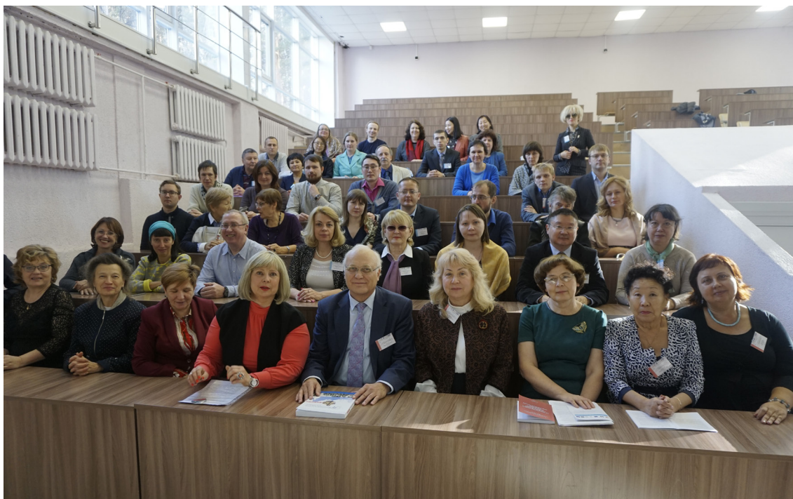
Международная конференция ИАЭТ СО РАН «Этнокультурная идентичность народов Сибири и сопредельных территорий», Новосибирск, 2018 г.