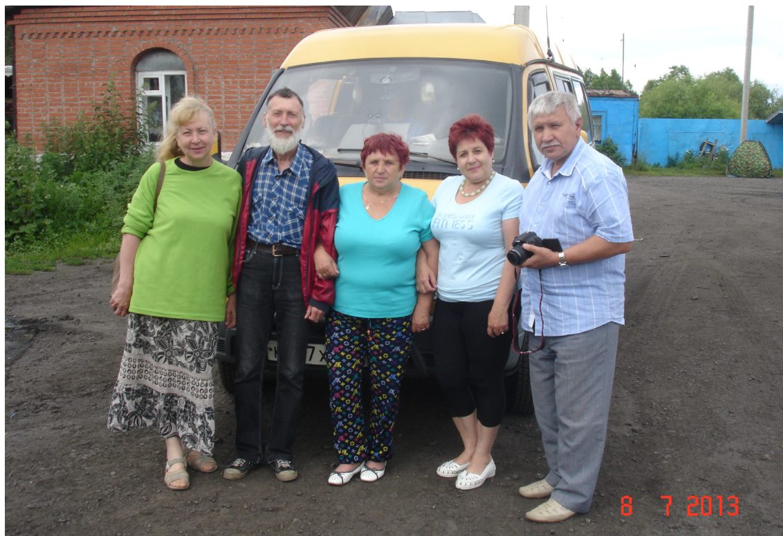
Российско-белорусская экспедиция в Северный и Кыштовский р-ны, Новосибирская область, 2013 г.