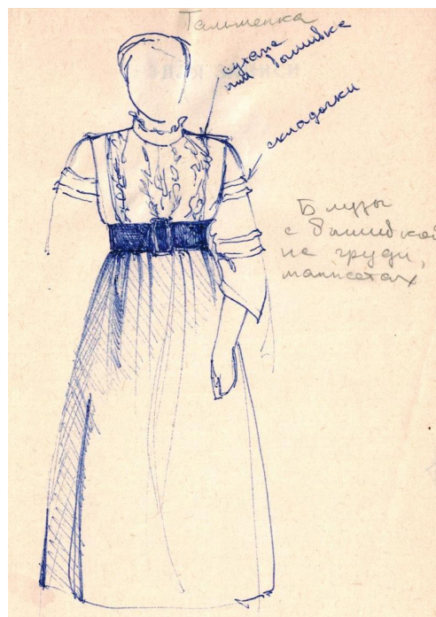
Этнографические рисунки Е. Ф. Фурсовой, д. Тальменка Алтайского края, 1983 г.