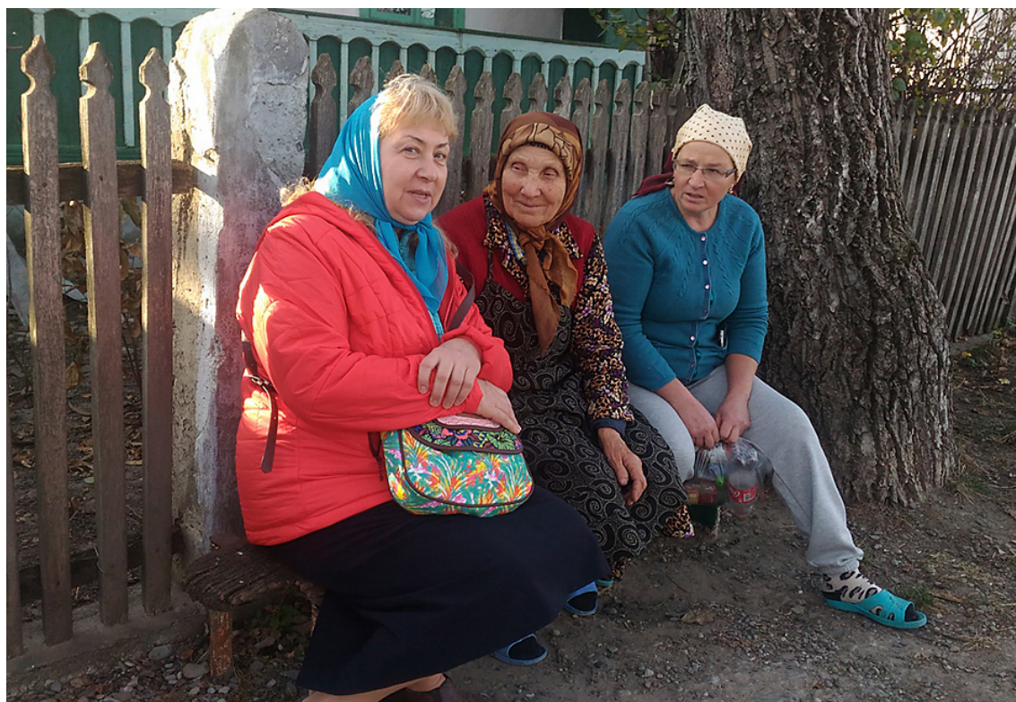
Беседа со старообрядцами, д. Липовень, Румыния, 2018 г.