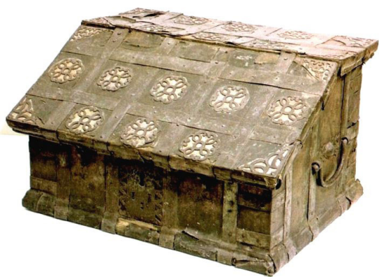
Подголовник. 1750, Холмогоры. Дерево (дуб), железо, слюда, кожа, просечка, литье. ГРМ.

Сундучные изделия нередко были вкладами в монастыри. Например, ларь из Далматовского монастыря, который был «принят» от «Туринской слободы у Мелентия Чиркова по родителям» (Манькова 1992: 110). Необходимо также упомянуть и сундук из коллекции Владимиро-Суздальского музея-заповедника (инв. № В-1073). Это большой прямоугольный предмет на четырех низких круглых ножках с плоской крышкой, «заплывающей» на боковые стороны. Сундук окован толстыми железными полосами, на боковых стенках – кованые ручки. В 1682 г. он поступил в качестве вклада в Рождественский собор города Владимира. Об этом свидетельствует надпись, расположенная на передней стенке: «Лета... 7190 году месяца августа в 4 день приложил