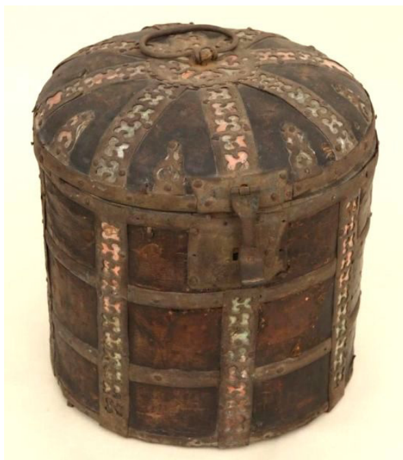
Митряница. Вторая половина XVII в., Соловецкий монастырь. Дерево, кожа, железо, слюда, бумага, набойка, выделка кожи, ковка, просечка, ткачество, набойка, столярная работа. СГИАПМЗ

Среди сундучных изделий именно церковного назначения следует назвать денежки и митряницы. Граненый корпус первых покрывался кожей и обивался железными полосами. Сверху располагалась металлическая ручка. На крышке – прорезь для сбора денег и петля для удобства открывания. Внутри делался специальный ящик. Деньги сразу попадали в специальное отделение – открывать сундук не было необходимости. Примером сундука-денежки является предмет из коллекции Государственного исторического музея (инв. № Д-IV-1560, датируется XVIII в.). Другой тип церковных изделий, митряницы, имели деревянный цилиндрический корпус и откидную выпуклую крышку. Поверхности покрывались кожей и обивались просечными металлическими полосами. На крышке – железная кованая ручка; пластина, защищающая отверстие для ключа, – тоже металлическая. Некоторые экземпляры имели не просечные, а сплошные железные полосы, и петля напоминала петли определенного типа русских сундуков, происхождение которых в настоящее время точно не установлено (Пудов 2022: 286–295). Образцы митряниц – изделия из коллекций Соловецкого музея-заповедника, Архангель-