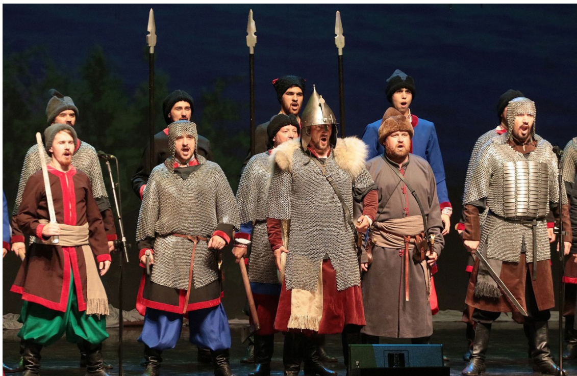
Вокально-хореографический спектакль «Ермак – легенда Сибири» Государственного академического Омского русского народного хора. Омск. 2021 г.

– областной семинар «Современные подходы к разработке дополнительных общеобразовательных программ по сохранению традиционной казачьей культуры»;