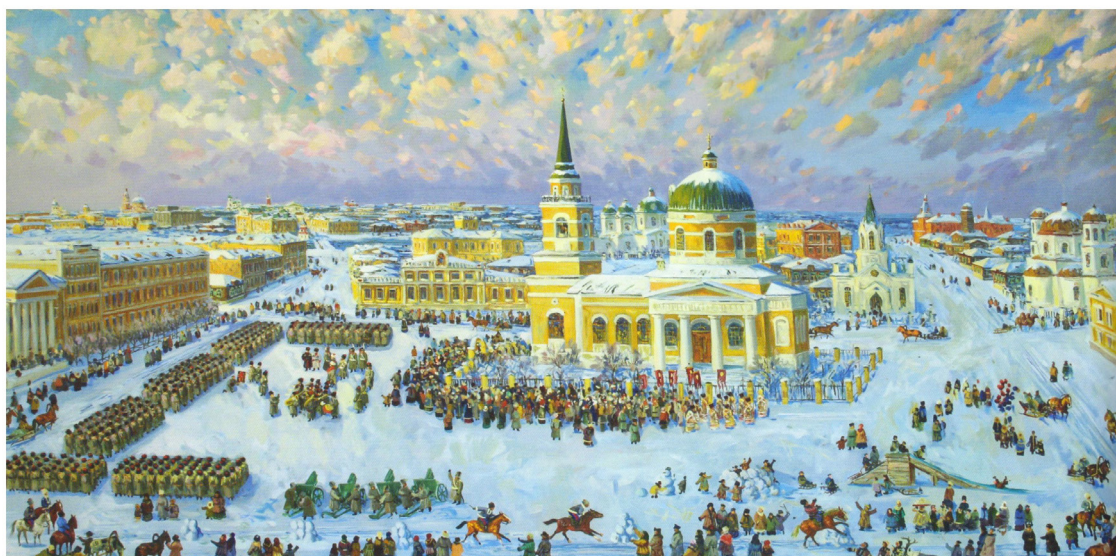
Никола зимний. Художник С. Е. Сочивко. Омск. 2005 г.

Кардинальные государственные, историко-политические, социально-экономические и идеологические перемены, произошедшие в нашей стране в конце XX в., ознаменовались возрождением интереса к истории и культуре казачества. В 1990 г. в Омске состоялся Большой Круг Сибирского казачества, на котором был учрежден «Союз сибирских казаков», а в 1994 г. зарегистрирована Межрегиональная общественная организация «Сибирское казачье войско». Указом Президента РФ от 9 августа 1995 г. утверждено «Временное положение о государственном реестре казачьих обществ в Российской Федерации», и на основании «Решения Главного управления казачьих войск при Президенте РФ» от 30 ноября 1996 г. в государственный реестр казачьих обществ было внесено Сибирское войсковое казачье общество.