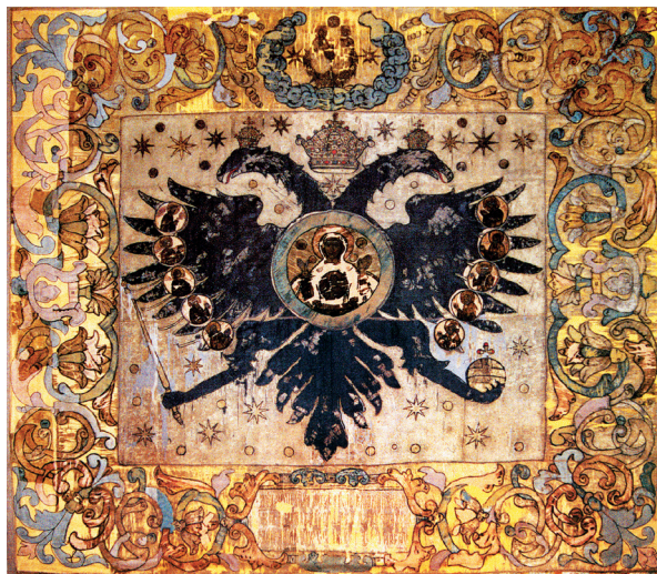
Знамя Сибирского казачьего войска. Из фондов Омского государственного историко-краеведческого музея (Москва, Мастерские Оружейной палаты, 1690 г.)