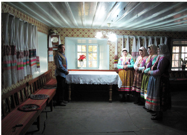
Певчие с. Гореловка (Грузия) во время поклонения (богослужения) в Сиротском доме. 2014 г.

Ситуация с певчими в местах, где в Тульской обл. проживают небольшие группы духовоборцев – выходцев из селений большой партии, значительно хуже, чем в селениях, где проживают выходцы из Гореловки. В Новопетровском Каменского р-на в настоящее время только двое певчих. Обе из Ефремовки, 1940-х годов рождения. Иногда к ним присоединяется третья. Никто из них не ходил молиться, когда жили в Грузии, но обе когда-то участвовали в самостоятельности. Переселившись в пос. Новопетровский, человек