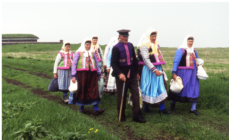
Певчие с. Гореловка (Грузия) после посещения некрополя вождей на Троицу. 1988 г.

Вскоре новая власть взялась за полное переустройство всех сторон жизни духоборцев, насаждая большевистскую идеологию и преднамеренно разрушая религию и традиционные формы культуры. Первая волна репрессий против закавказских духоборцев, оказавших власти пассивное сопротивление, прошла в конце 1920-х – начале 1930-х годов. Вторая, связанная с созданием колхозов, – в 1937 г. Под этот каток прежде всего попала духоборческая элита – «старички» и певчие. Наиболее пострадали гореловские духоборцы, с самого начала открыто не принявшие новую власть, вмешивавшуюся в их жизнь. Кого-то расстреляли, кого-то отправили в лагеря или семьями в ссылку в Казахстан.