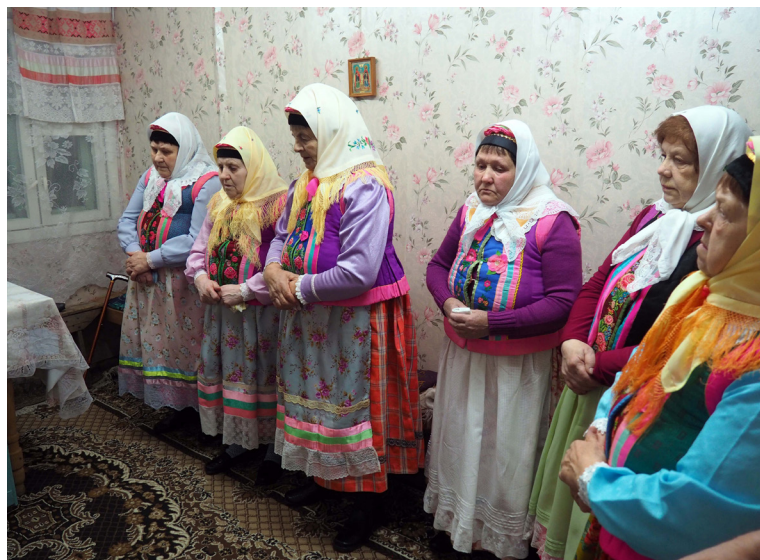
Духоборцы с. Архангельское (Тульская обл.) во время поклонения на Пасху 2023 г. Первые трое – певчие.