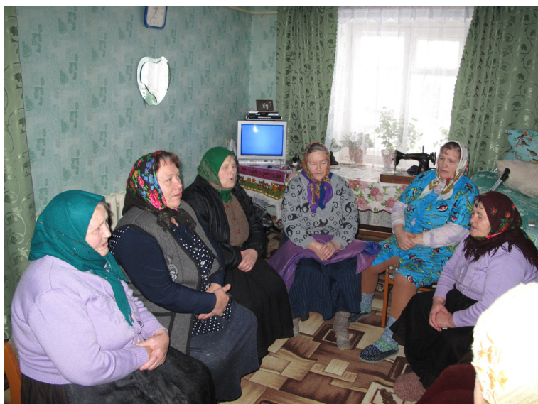
Певчие пос. Мирный (Брянская обл.) во время спевки. 2009 г.

О певчих Малого Снежетка остальные духовборцы говорили: «Какие тут певчие? Кто тут знает? Ни завесь, ни весть! Там они говорили: “Передние не будем, а за следом будем петь”. А сюда приехали, и не за кем за следом петь» (ПМА 1). Да и сами певчие признавали, что плохо справились со взятыми на себя обязательствами: «Ну, поем мы небольшие, ну, какие нужные: “Сойдемся мы братья”, “Узрех”, “Великое дело”. “Жили мы были” не поем, мы не вытвердили его. Мы твердили, к Царе ходили. Тута переднего нету, и все задние» (ПМА 19).