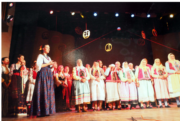
Певчие с. Архангельское (Тульская обл.) выступают вместе со студентами Музыкального училища им. Гнесиных. 2013 г.

ного ансамбля «Исток» из Подольска. Члены коллектива приезжали в Архангельское, перенимали их песни, скупали их одежду, но и духовборцев стали вывозить на различные фестивали, чему певчие были рады, и до сих пор вспоминают об этих поездках. «Подольские у нас много взяли: и пение, и одежду. Но они везде нас возили выступать. Благодаря им мы побывали в Подольске, Вильнюсе, Москве, Ясной Поляне. Как хорошо было!» (ПМА 17). На этих сценах, кроме светских песен, они обязательно пели один-два псалма и стиха. Спели псалмы вместе со студентами Музыкального училища им. Гнесиных на сцене училища.