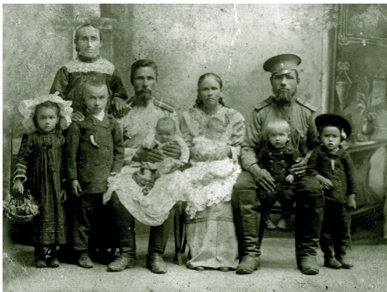
Семья уральского казака. Начало XX в.