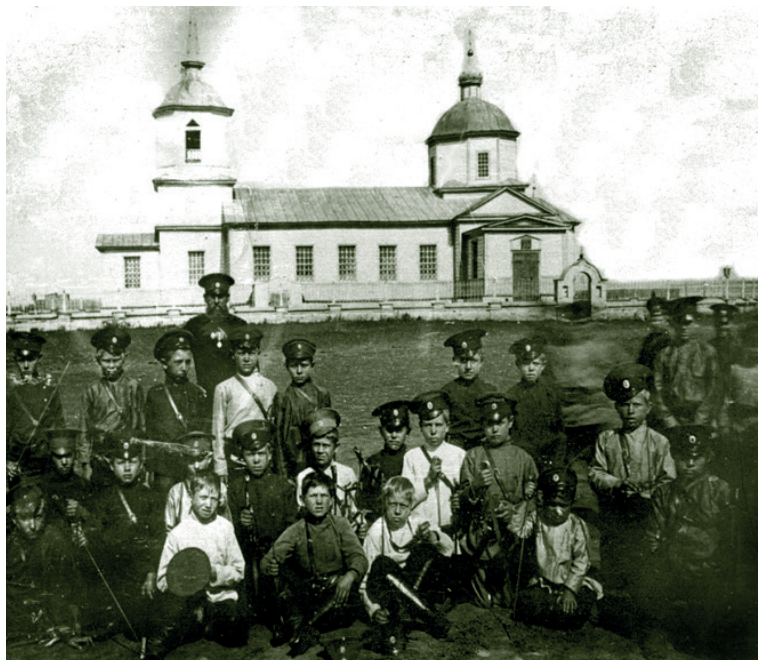
Астраханские казачата у станичного храма. Начало XX в.

Пословицы донских казаков гласят: «Закон один для донца: чтить Бога, мать и отца», «Отца не почел, значит, и Бога не почел» (Коваленко 2013). Кубанские казаки говорили: «Матэрь почитайте, як на цэркви главу», «Коль решив жениТЬся, нэ забудь у батькив спросЫться» (Волкострел 2000: 89).