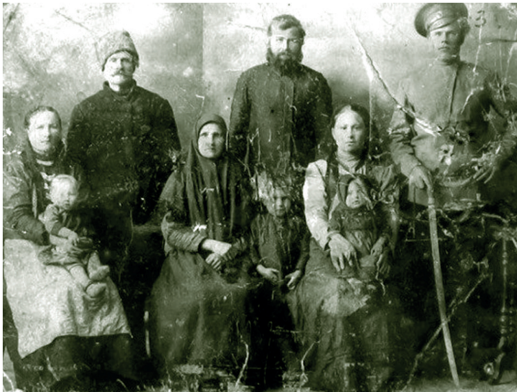
Семья оренбургского казака. Начало XX в.

В обязанности родителей входило не только накормить, напоить, приучить к хозяйству, но и воспитать детей «в страхе Божьем». Петр Хрисанович Семёнов, дореволюционный терский краевед и этнограф, в описании ст. Слепцовской отмечал, что «дети лет 2–5, проснувшись, с умытыми личиками стояли серьезные рядом с матерью и учились молиться. Хорошая мать делала это каждое утро, и дети легко заучивали молитвы» (Семёнов 1896: 179).