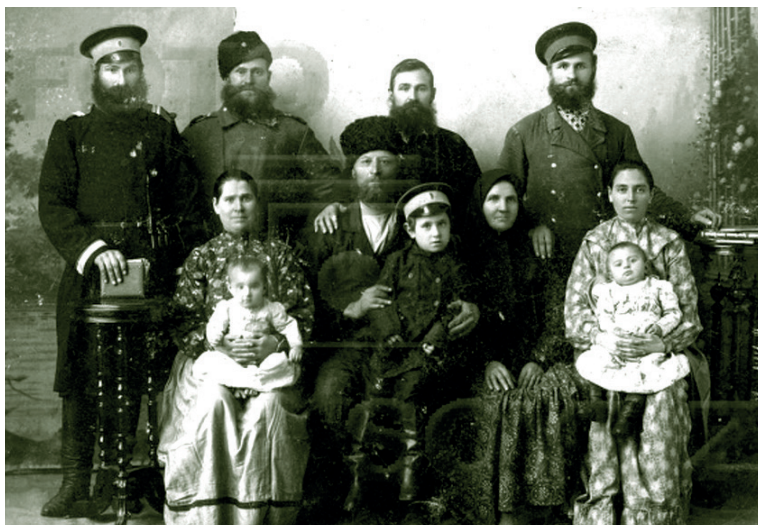
Семья донских казаков. Начало XX в.

личных качеств, социально-экономических реалий, иллюзий и заблуждений, кризисных явлений в период модернизационных изменений в обществе и стране. Особенно отличался подобными трансформациями рубеж XIX–XX вв. Благочинный одного из округов в отчете за 1913 г. писал о забайкальцах: «Посты казаки мало исполняют, по условиям и образу жизни они почти ничем не отличаются от бурят. Долг исповеди исполняется меньшинством. Не бывших на исповеди вдвое больше. Родители не учат детей молитвам, надеются на школу. Религиозный уклад жизни под влиянием тлетворных веяний слабеет» (Коваленко 2008: 144).