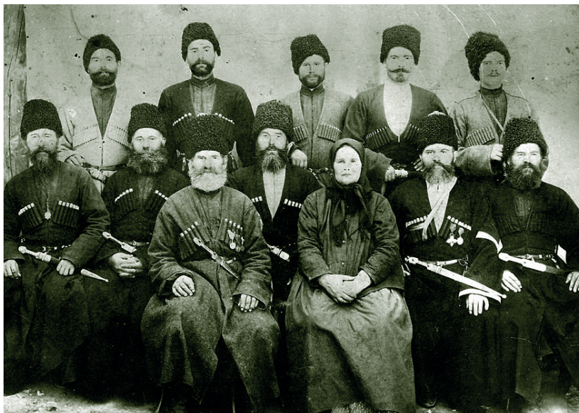
Казачи станицы Прохладной Терского казачьего войска. Начало XX в.

Обращение к традиционной системе ценностей показывает значительную роль православия в регулировании жизнедеятельности казачеств России как целостных организмов. В то же время в разной степени имело место соотношение идеального, желаемого, декларируемого уровня системы ценностей и реального, взаимодействие официального и бытового. Значение имели развитие иерархии православных критериев, изменений во времени. Поэтому необходимо дальнейшее изучение этих аспектов. Несомненно одно: забайкальцы и кубанцы, семиреки и уральцы, терцы и астраханцы сумели сохранить православное ядро системы ценностей. Это дает надежду не только на соработничество Церкви и казачества, но и восстановление естественного механизма преемственности поколений, духовных скреп, которые позволят нашей стране противостоять новым вызовам.