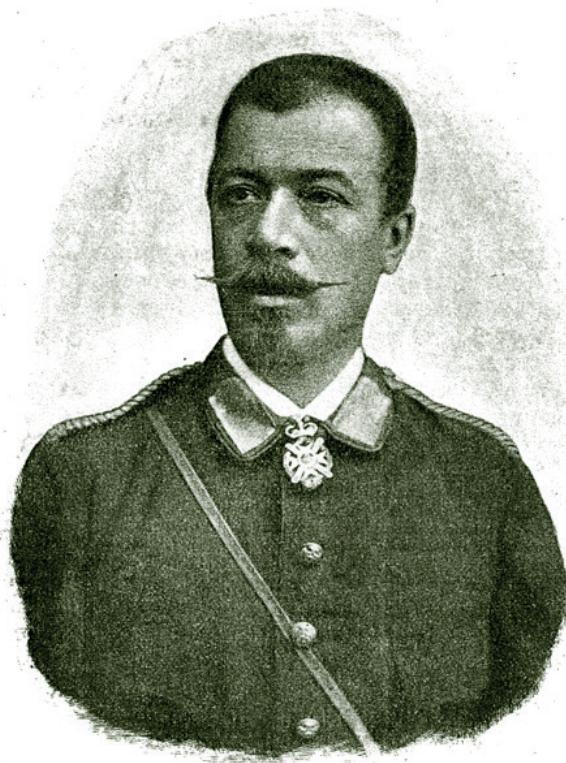
М. Г. Черняевъ въ 1876 г.

В документах Государственного архива Краснодарского края немало такого рода свидетельств, целые списки казаков, изъявлявших желание идти «на подвиг освобождения страждущих славян на востоке» (ГАКК 454: 9, 90; ГАКК 668: 38–40 об., 50–52). В одной из терских станиц бытовала песня казаков-добровольцев о генерале Черняеве: «С Малки, с Терека, с Кубани, / Дети русии зямли, / Мы на пир священна(ы)й брани / Ф помощь Сербии пришли: <...> Нам Черняиф путь указать, / Сербии архистратих, / В битвы с нами вместе ляжить, / Если врах не здастца в них» (Еланский 1908: 52–53). То, что Черняева называют архистратигом, – в церковном смысле предводителем ангельского воинства, которым был архангел Михаил, придает сакральный смысл развернувшемуся противостоянию с турками. Идея «казак – защитник веры» отражена в пословицах: «Жыть – Богу служить», «Як казак народывся, сатана зажурывся», «На тэ казак народывся, шоб Богу и царю сгодывся» (Волкострел 2000: 88).