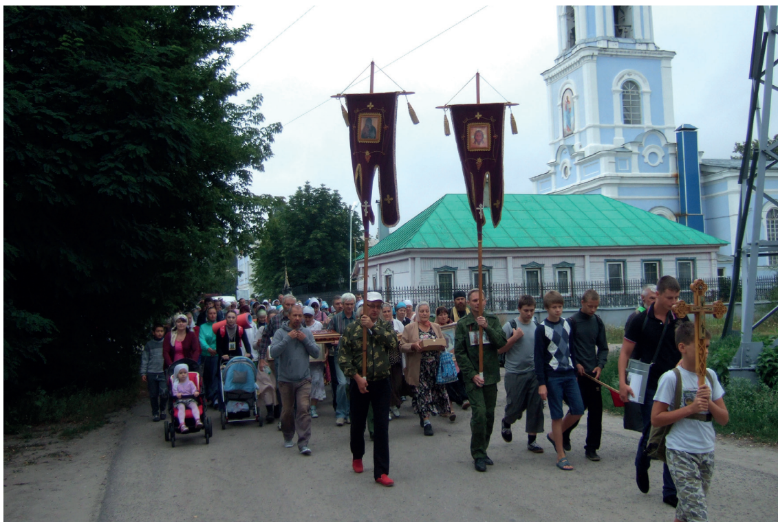
Крестный ход из Знаменского собора. 2013 г.