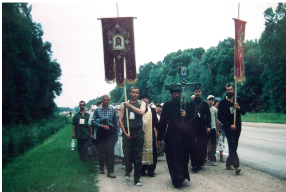
Первый Крестный ход. 2003 г.