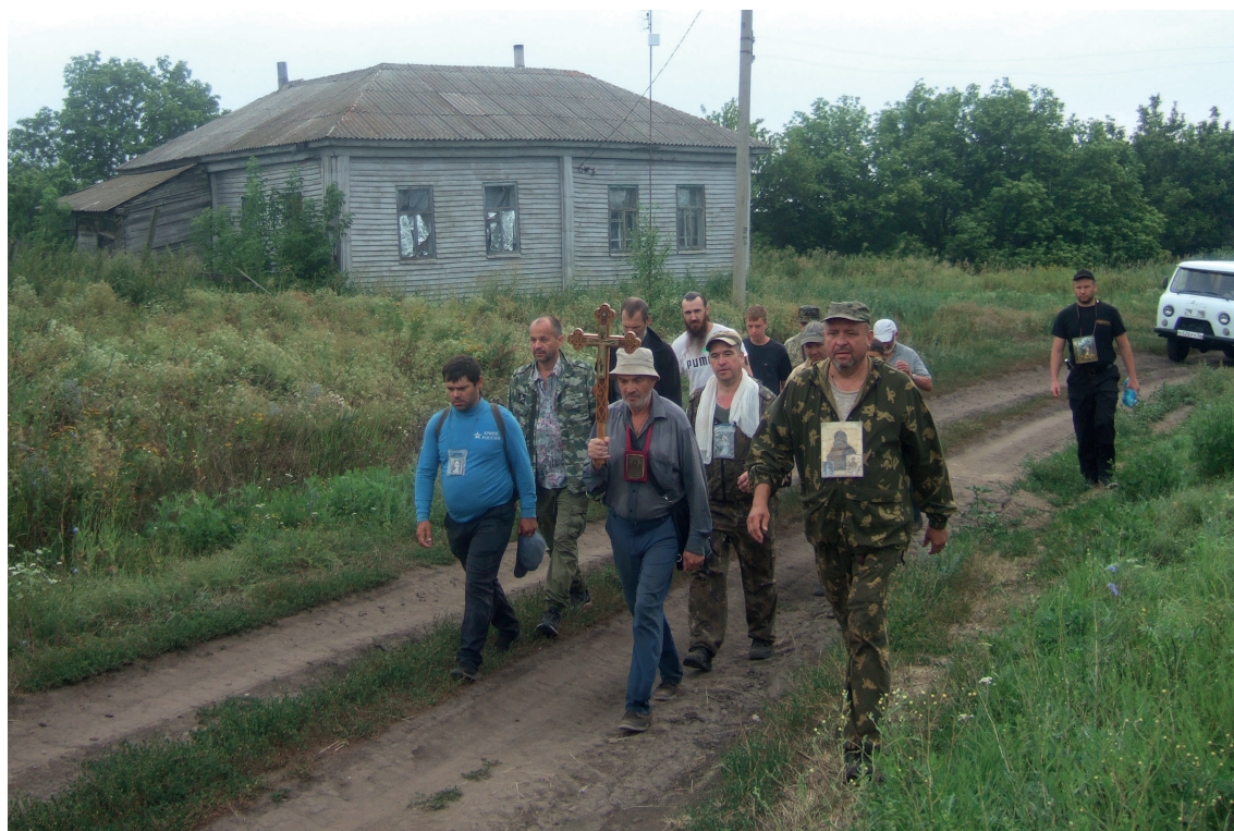
Крестный ход небольшим числом участников во время пандемии, через леса и поля, чтобы не прерывать традицию. 2021 г.