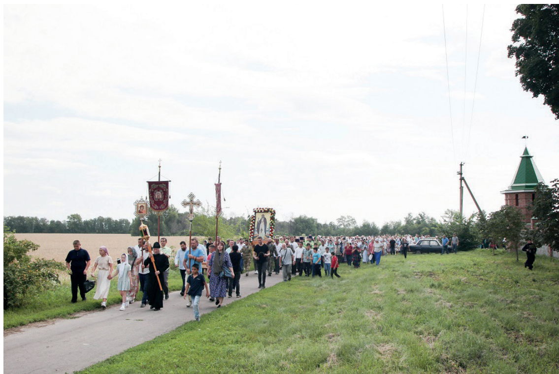
Крестный ход вокруг Серафимовской обители. 2023 г.