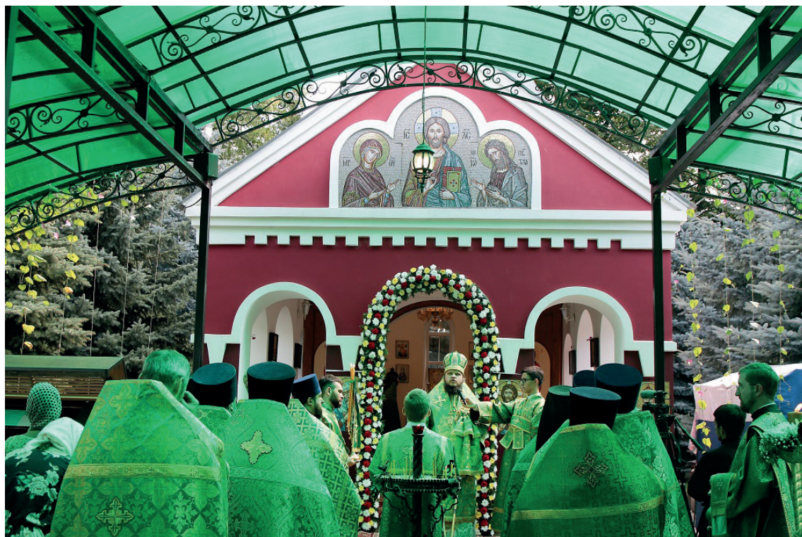
Слово владыки Сергия (Копылова) после Божественной литургии 1 августа 2023 г.