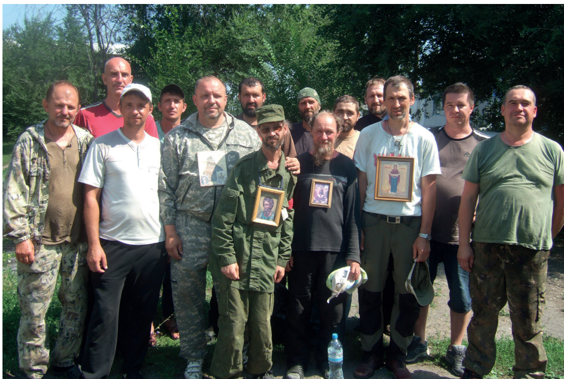
С воронежскими братьями. Привал возле с. Новомакарово. 2018 г.