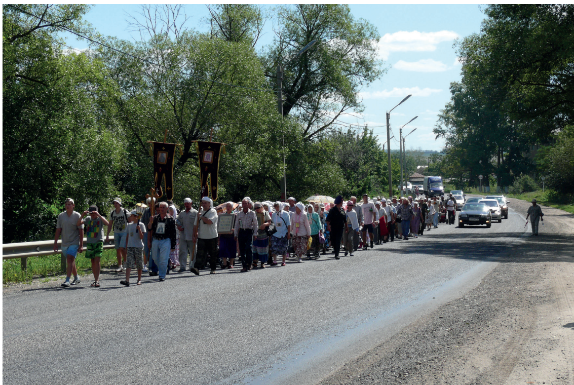
Крестный ход 2012 г. Село Верхний Карачан