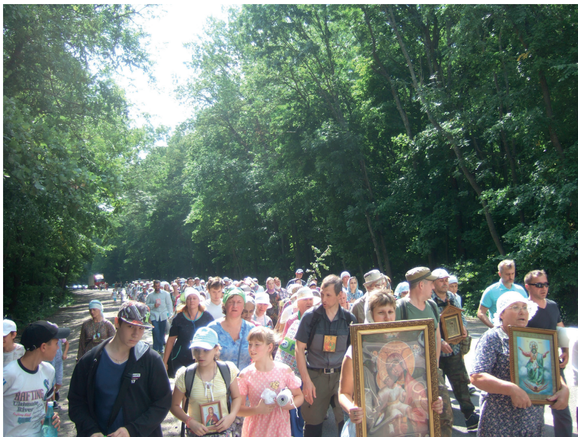
Крестный ход 2012 г.