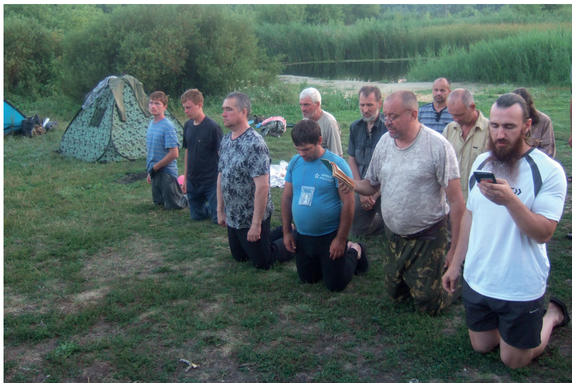
Крестный ход во время пандемии. Чтение акафиста преподобному Серафиму Саровскому. 2021 г.