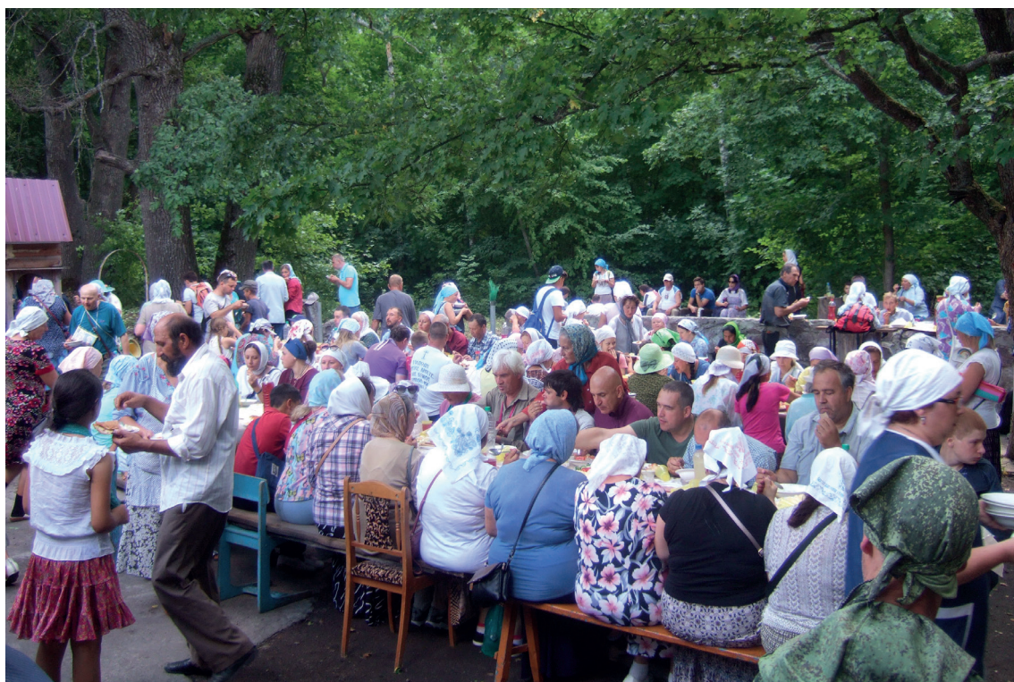
Крестный ход 2012 г. Трапеза