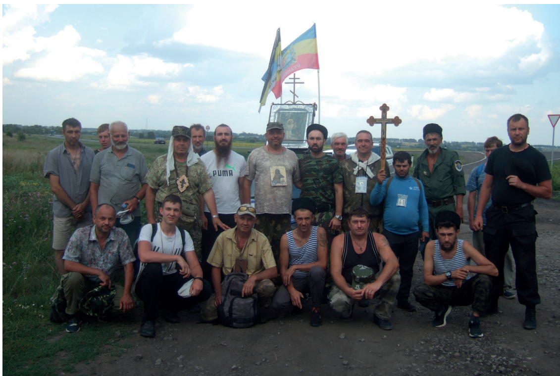
Встреча крестных ходов. 2021 г.