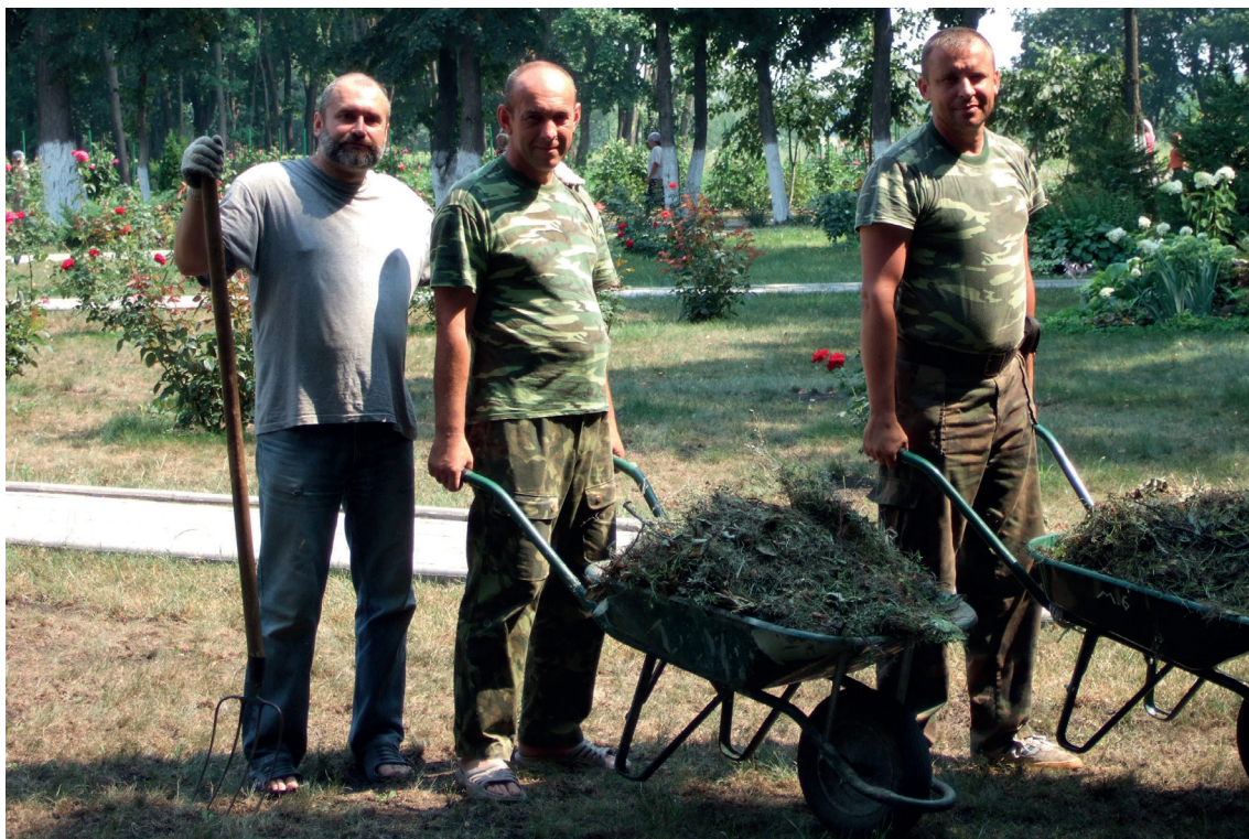
Уборка и подготовка к празднику. 2011 г.