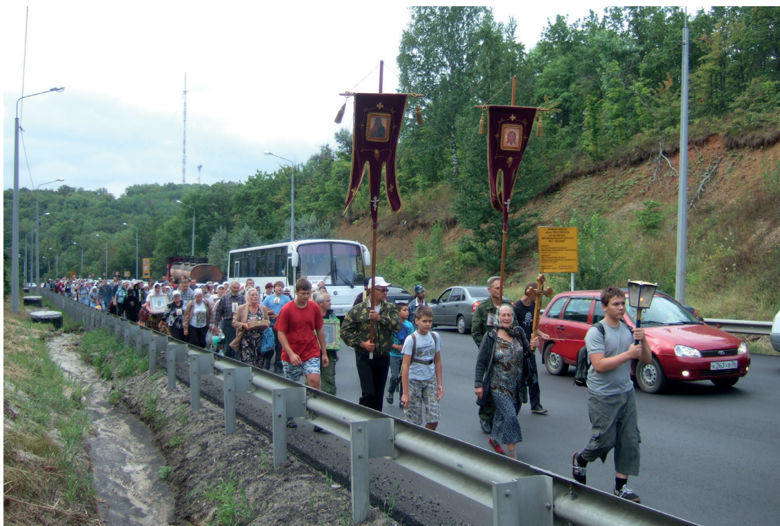
Крестный ход 2012 г. Подъем на Грибановскую гору