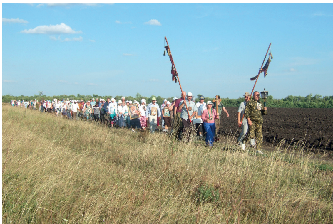
Крестный ход 2012 г.