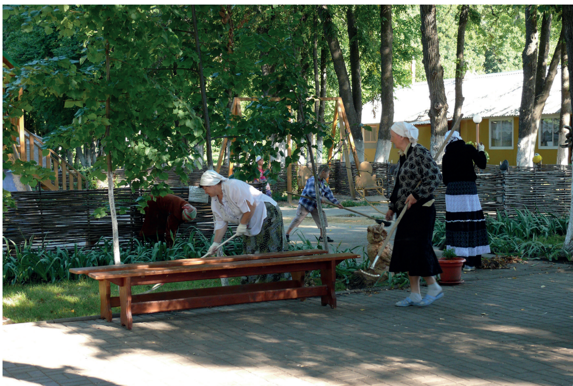
Уборка территории монастыря перед Всенощным бдением. 2016 г.