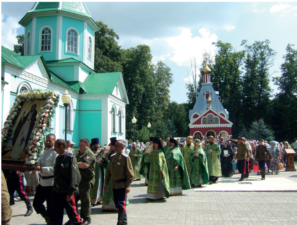
Крестный ход вокруг Серафимовского монастыря. 1 августа 2022 г.

Крестный ход начался 28 июля, в день святого равноапостольного князя Владимира (с 2010 г. 28