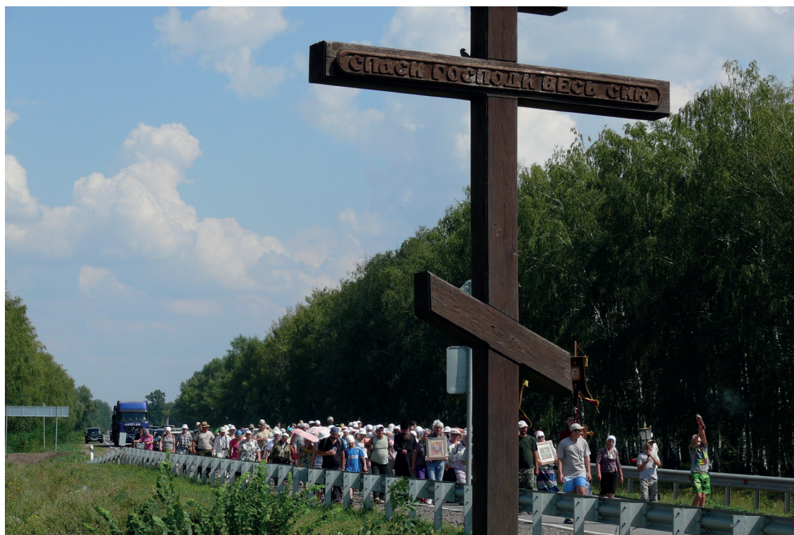
Крестный ход 2012 г.