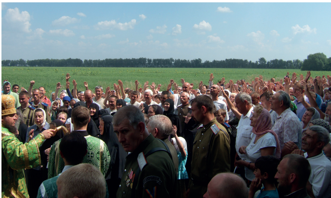
Крестный ход с владыкой Сергием. 1 августа 2022 г.

июля отмечают как День крещения Руси). В этот день вспоминают также об успении местночтимого святого Никандра (1911), игумена Александро-Невского монастыря.