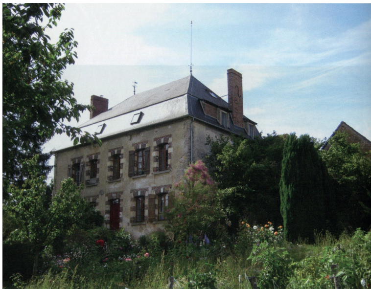
Русская женская Покровская обитель в Бюсси-ан-От. Монастырский дом и сад