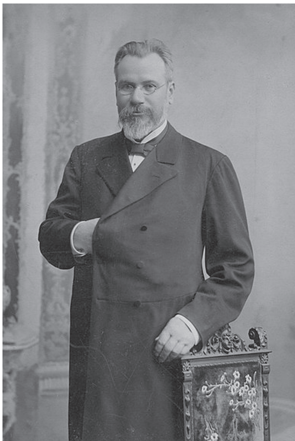
Ефим Иванович Фесенко. Фото 1905 г.

140 лет назад 15 декабря 1883 г. в Одессе появилась новая типография, принадлежавшая Ефиму Ивановичу Фесенко, уроженцу Черниговщины, по линии матери имевшему также и белорусские корни 1 . Следует отметить, что до недавнего времени имя Е. И. Фесенко было практически в забвении даже в самой Одессе 2 . Только в последние годы здесь начинает наблюдаться интерес к его фирме и ее основателю 3 , чему во многом поспособствовала публикация рукописных воспоминаний Е. И. Фесенко (Воспоминания 2007: 15–124), переданных наследниками знаменитого издателя в Одесский литературный музей (ОЛМ КП-2558/1; ОЛМ КП-2558/2). Воспоминания эти, написанные в двух толстых тетрадах карандашом и доведенные до 1893 г., представляют собой интереснейший источник по истории не только семьи самого составителя, но и крайней юго-западной части Российской империи от Черниговщины до Одесщины.