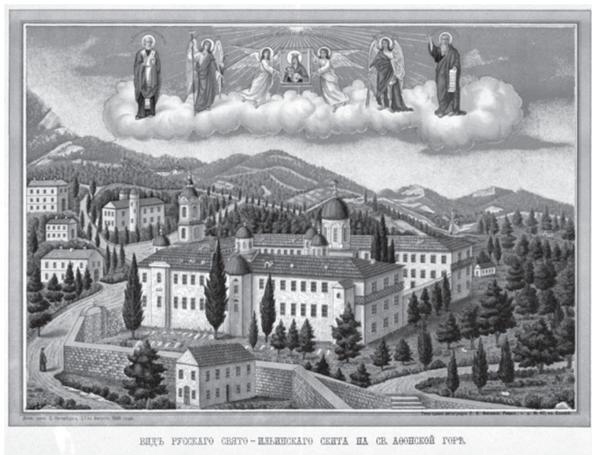
Лубочная картина «Вид русского Свято-Ильинского скита на Св. Афонской горе» (Одесса: Типо-хромолитография Е. И. Фесенко, 1888)

Е. И. Фесенко рассчитывал на распространение своих изданий преимущественно в православной среде, прежде всего простонародной (Лабынцев, Щавинская 2017: 12). Многочисленные покупатели и заказчики продукции одесской типографии были рассеяны «по всей России, с ее кавказскими и сибирскими окраинами, среди балканских стран – в Болгарии, Сербии, Черногории и Греции, в св. Палестинской земле, на Афоне, наконец, в отдаленной Америке». Суммарные тиражи книг и брошюр, выпущенных фирмой Е. И. Фесенко, начинают достигать сотен тысяч экземпляров, а тиражи различных листовых материалов, в числе которых были и иконные изображения, – миллионов (Щавинская 2022: 563–568). Эти издания расходились «по обширной Руси-Матушке» и стали украшать «собой стены православных храмов Божиих и скромные жилища православного люда не только в нашем отечестве – России, но и в единоверных ей Греции, Болгарии, Сербии, Румынии, Палестине, Египте и в других, еще более отдаленных окраинах Православного Востока» (Празднование десятилетия типографии 1894: 18–19).