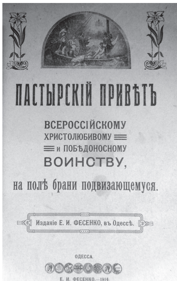
Титульный лист брошюры «Пастырский привет всероссийскому христолюбивому и победоносному воинству, на поле брани подвижающемуся» (Одесса: издание Е. И. Фесенко, 1914)

С началом Первой мировой войны в типографском репертуаре фирмы Е. И. Фесенко появляются довольно многочисленные соответствующие издания 14 , часть которых перечислена в специальных каталогах, открывающихся словами: «Наше издательство тридцать три года стоит на страже культивирования в простом православном русском народе любви и преданности вековым заветам Великой России. Религия, любовь к Родине, беззаветная преданность Престолу, все это картинно отражается в предлагаемых общедоступных изданиях священных изображений, картин, книг и брошюр. Мировая война превратила крестьянина в воина, и деятельность издательства, вслед за ним, перенеслась туда, где проливает кровь и являет беззаветное мужество и отвагу бывший хлебопашец – ныне русский витязь» (Каталог военных изданий 1916: 2). Типография Е. И. Фесенко в это тревожное время большое вни-