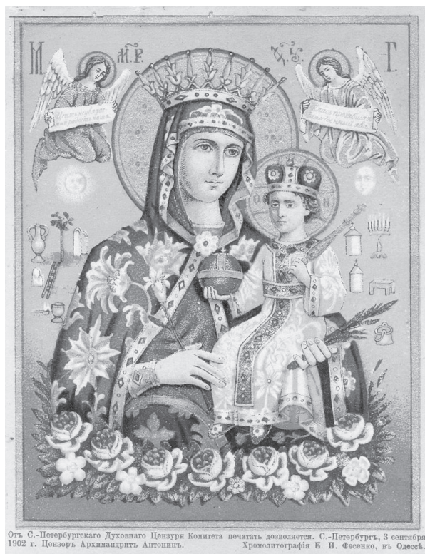
Печатная икона Богородицы «Неувядаемый Цвет». Хромолитография Е. И. Фесенко. Одесса, 1902

в начале XX в. широкое распространение получили изделия мастерской одесского литографа Е. Фесенко... Дешевые и не громоздкие, они охотно покупались многочисленными паломниками (только в Киево-Печерской лавре в год бывало около 200000 человек) и были известны по всей России» ( Меценат 2010: 139).