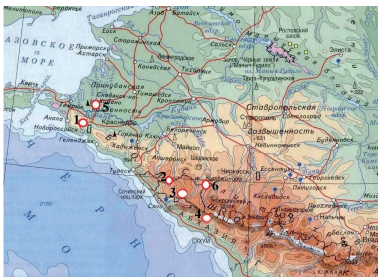
Карта Северного Кавказа с отмеченными местами концентрации имяславцев