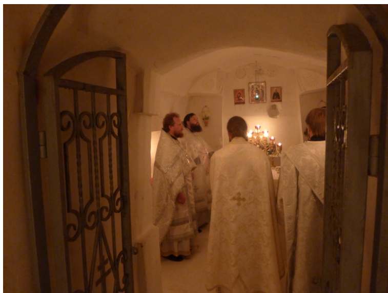
Служба в пещерном храме Святого Духа в день памяти Марии Шерстюковой в 2016 г.

Надо отметить, что по поводу данной рукописи в Синоде также было разбирательство в 1839–1840 гг. с опорой на экспертизу Московского цензурного духовного комитета (РГИА: Ф. 796. Оп. 120. Д. 1454). В экспертизе отмечалось незнание автором данного произведения «духовных предметов, также славянского и русского языков», проявление «суежности и напыщенности» повествования. Отмечалось, что рукопись не может быть удобна для напечатания в настоящем виде. При этом цензоры отмечали, что с учетом народной любви к Марии-пещернице и ее благочестивой жизни, известной гражданским и светским властям, необходимо решение о дальней-