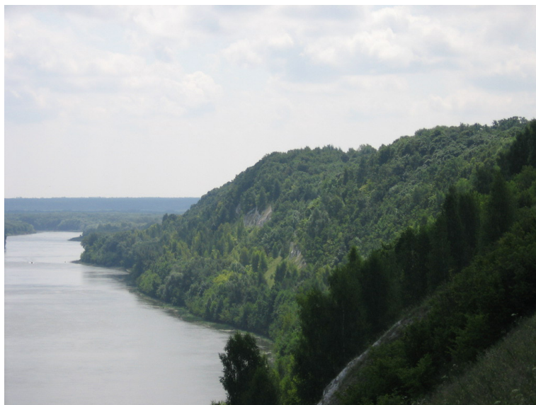
Поросший лесом меловой склон донской долины у с. Белогорье