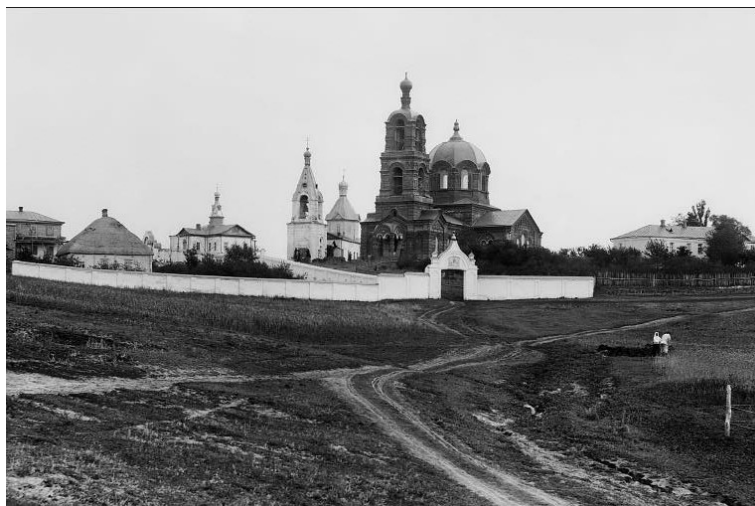
Белогорский Воскресенский монастырь. Фотография начала XX в.

Исторический контекст событий, связанных с начальным этапом создания Белогорской пещеры, мы узнаем прежде всего из материалов фондов Российского государственного исторического архива: Ф. 796. Оп. 98. Д. 196; Ф. 797. Оп. 2. Д. 5355; Ф. 834. Оп. 3. Д. 4036-а; Ф. 1282. Оп. 2. Д. 1998. Суть их сводится к следующему. 27 февраля 1817 г. Синод заслушал рапорт епископа Воронежского и Черкасского Епифания (Канивецкого) о создании пещеры Марией Шерстюковой в меловой горе близ слободы Белогорье. Необходимо отметить, что епископ Епифаний получил назначение на воронежскую кафедру незадолго до этого, в марте 1816 г. Он сменил в служении епископа Антония (Сokolova), управляющего епархией с 1810 г. По сути, с назначением Епифания не началось, а возобновилось дело Марии-пещерницы, начавшей создавать подземелье в меловом склоне донской долины у сл. Белогорье в далеком 1796 г. Еще в 1802 г. Иоанн Ставров, священник Преобра-