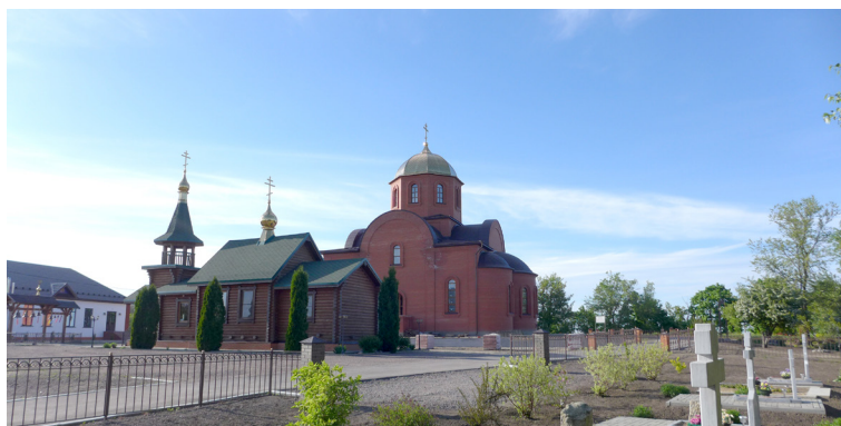
Белогорский Воскресенский монастырь. Современный вид

Вновь в фокус внимания епархиальных властей, теперь уже воронежских, Белогорские пещеры попали в 1806 г. В это время расположенный неподалеку от Белогорья г. Павловск посетил епископ Арсений (Москвин), занимавший воронежскую кафедру в период с 1799 по 1810 гг. Воспользовавшись этим случаем, Иоанн Ставров передал ему рапорт. В результате епископ Арсений принял решительные