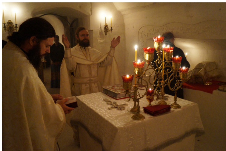
Богослужение в пещерном храме Святого Духа