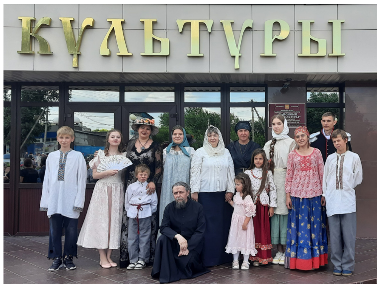
Участники студии «Образ» после спектакля. 2022 г.

бами, Господи!» ( Игумен Петр (Васильев) 1897).