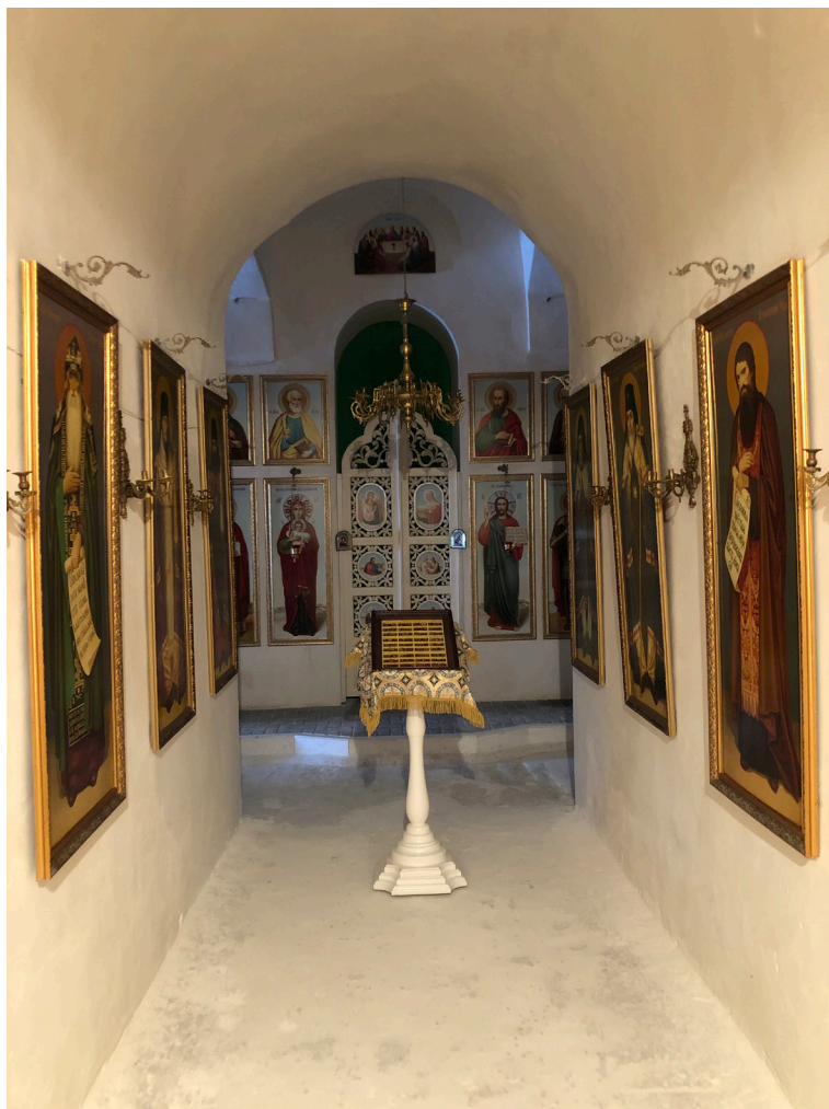
Пещерный храм св. блгв. кн. Александра Невского. Современный вид

молиться Богу. То же сделала и с мужем ее, и они вдруг опять пришли в прежнее здоровое положение, жили вместе лет десять, прижили много детей и, наконец, она овдовела. Тогда почувствовала она непреодолимое влечение идти в Киевские пещеры. Пришед туда, молилась усердно св. мощам и даже хотела остаться в монастыре, но один тружельник велел ей идти домой – приносить Богу беспрестанно теплые молитвы, ни о чем больше не думать, что Бог вразумит ее и будет такое диво, которое во веки прославится. Возвратясь, молилась она долгое время и всегда со слезами. В одну ночь приснилось ей, что кто-то говорит: поди чрез горы к Дону, молись, ищи и обрящешь. Проснувшись, она исполнила сие, но ничего не нашла. Сновидение и искание ее повторялись, с тоскою, до тех пор как пришло ей на мысль копать меловую гору. Тогда она почувствовала великую радость и в продолжении двадцати двух лет ископала, с проходящими в Киев на покло-