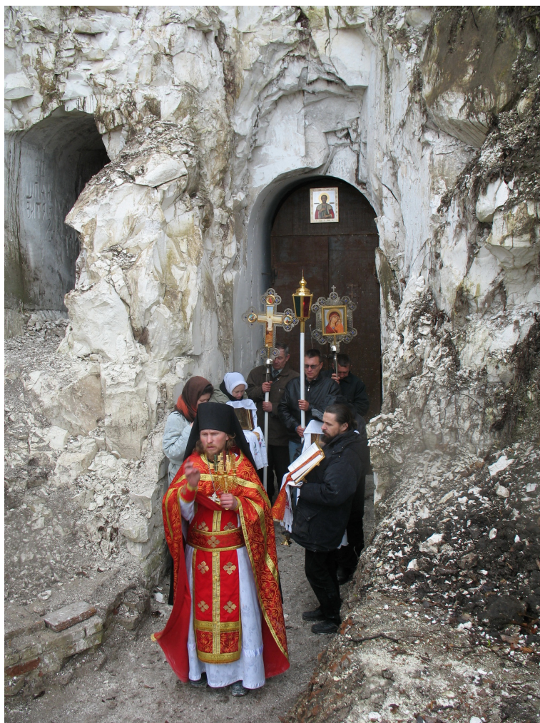
Крестный ход у входа в пещерный храм св. блгв. кн. Александра Невского. 2006 г.