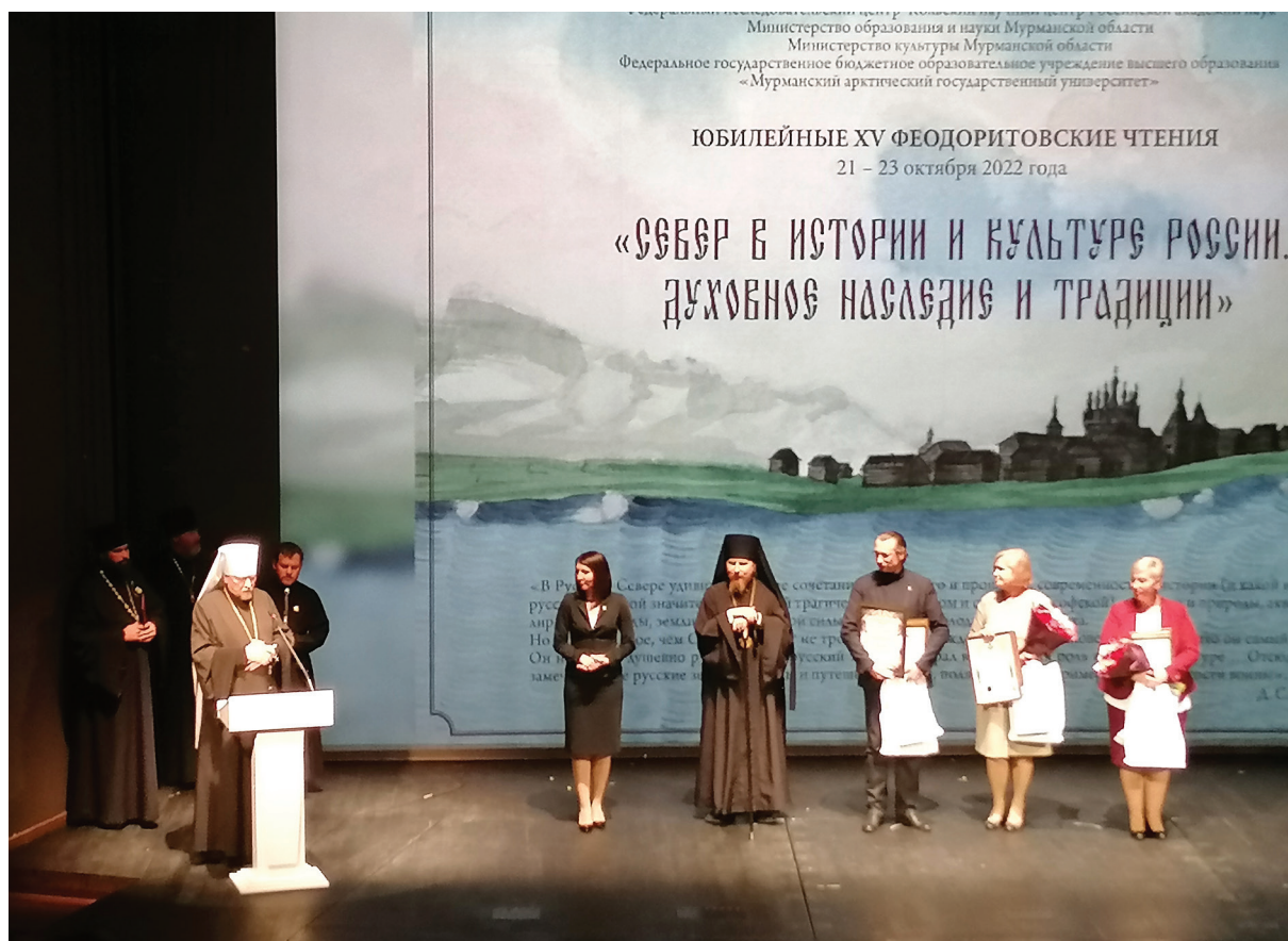
Открытие XV Юбилейных Феодоритовских чтений. Церемония награждение учителей. 2022 г.

сионерских задач, которые в рамках научного форума сводились к знакомству с научными, хозяйственными, культурными и социальными достижениями Крайнего Севера, вклада этого региона в общероссийскую копилку достижений. Поэтому программа предполагала как гуманитарные, так и естественно-научные дисциплины: история, этнография, археология, литературоведение, культурология сочетались с геологией, растениеводством, генетикой, экономикой. Конференция работала четыре дня, в ней приняло участие семьдесят докладчиков, работало четыре секции: 1) Север на путях освоения арктических рубежей; 2) Север в археологических и этнографических исследованиях; 3) Север в церковной истории; 4) Север в культуре и искусстве.