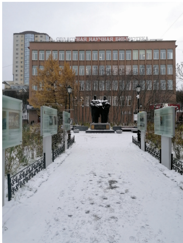
Мурманская государственная областная универсальная научная библиотека. 2022 г.