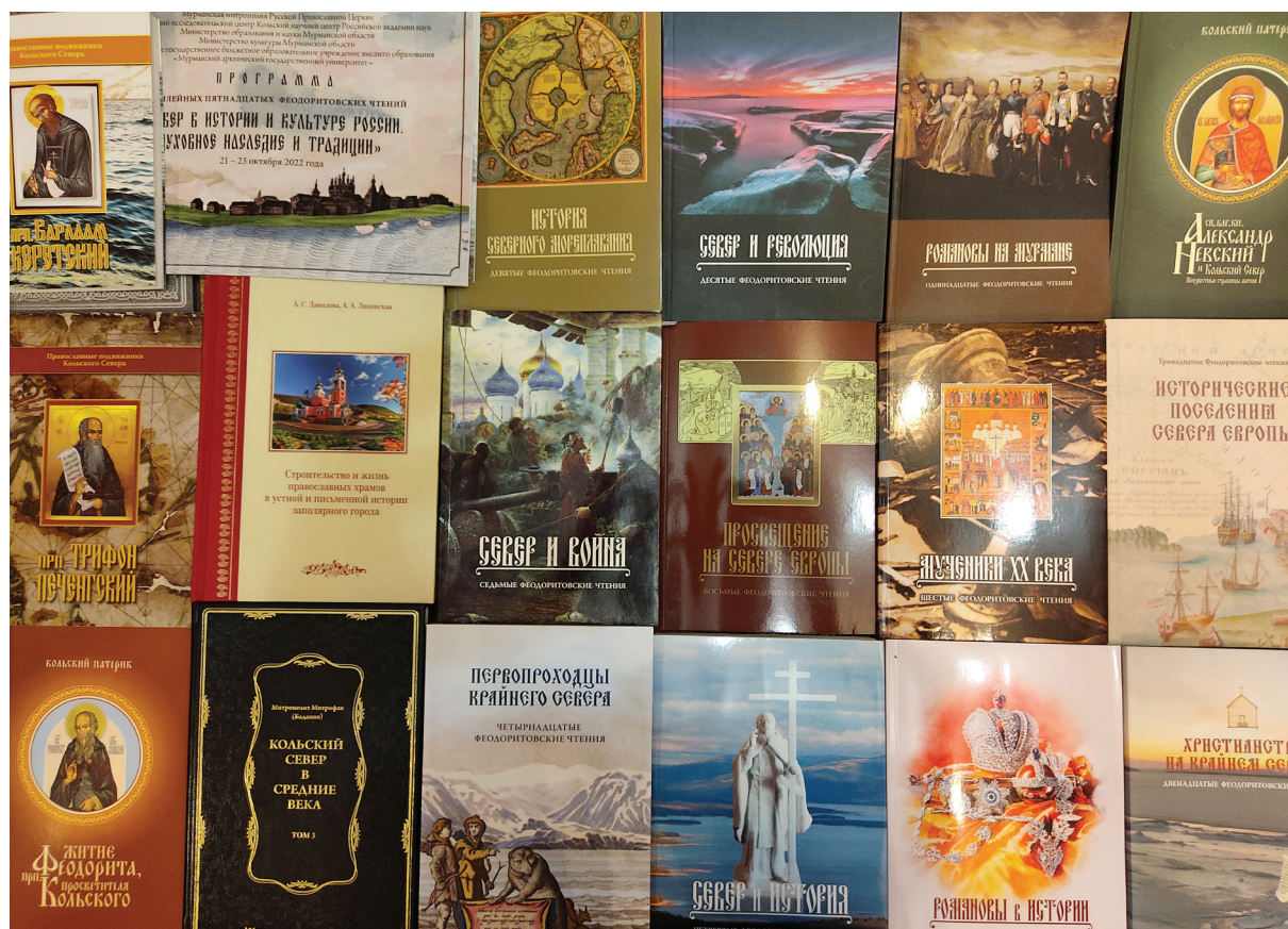
Научная литература, изданная Мурманской митрополией за последние 15 лет. 2022 г.

Часть докладов имела краеведческий, узкоспециальный характер, особенно интересными были выступления сотрудников местных библиотек и руководителей кружков, работающих со школьниками и прививающих им любовь к родному краю и историческую грамотность. Как подчеркнул митрополит Мефодий, такой подход в работе конференции был выбран организаторами сознательно, что отражено в подзаголовке конференции. В целом же слушатели и участники могли ознакомиться с исследованиями Крайнего Севера со стороны разных наук: истории, этнографии, археологии, культурологии, музееведения, архивного дела. Если учесть тот факт, что за время проведения пятнадцати конференций было освоено немало разных тем, то следует признать, насколько масштабно и глубоко работал этот форум многие годы. Перечислим темы прошлых конференций: «Север и История» (2011); «Романовы в истории» (2012); «Мученики XX в.» (2013); «Север и война» (2014); «Просвещение на Севере Европы»; «История северного мореплавания» (2016); «Север и революция» (2017); «Романовы на Мурмане» (2018); «Христианство на Крайнем Севере» (2019);