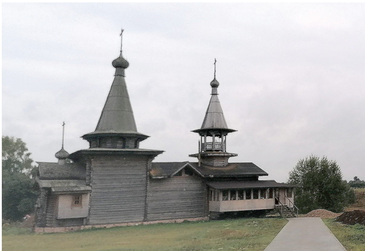
Приходской храм во имя пророка Божия Ильи в с. Ивановское – храм Ивановской школы

стью, неполнотой предполагает устремленность к совершенству.