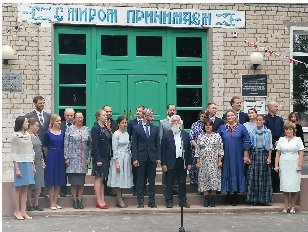
Учителя школы обращаются с приветственным словом к гостям

философской мысли». Он писал в своей «Истории русской философии»: «Русские философы, за редким исключением, ищут именно целостности, синтетического единства всех сторон реальности и всех движений человеческого духа», где «идея целостности человека» является одной из центральных. Мотив целостности в философии широко был развернут в качестве «основы размышлений именно о проблемах образования и воспитания, способствуя связыванию предметных значений философии и педагогики в единую философско-образовательную теорию» (Зеньковский 1999: 20).