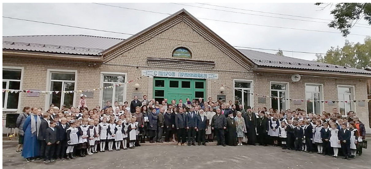
Учителя, учащиеся и гости юбилейных торжеств во дворе школы

ская педагогика. Нет необходимости здесь говорить о ценности опыта других народов, но, вместе с тем, нельзя и преувеличивать значение педагогических традиций одного народа для других.