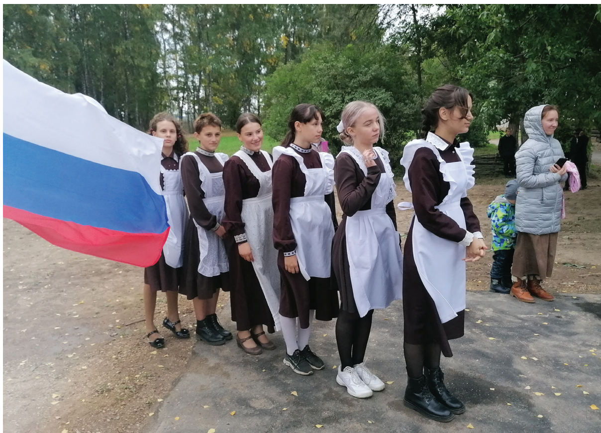
Начало юбилейных торжеств в Ивановской на Лехте школе, посвященных 160-летию основания школы и 25-летию ее возрождения как «школы целостного развития». Старшеклассницы перед подъемом государственного флага РФ и пением гимна. 16 сентября 2022 г.

Русский философ В. С. Соловьев, переводя понятие целостности в практическую плоскость, отмечал: «Отделить теоретический или познавательный элемент от элемента нравственного или практического и от элемента художественного или эстетического можно было бы только в тех случаях, если бы дух человеческий разделялся на несколько самостоятельных существ, из которых одно было бы только волей, другое – только разумом, третье – только чувством. Но так как этого нет и быть не может, так как всегда и необходимо предмет нашего познания есть вместе с тем предмет нашей воли и чувства, то чисто теоретическое, отвлеченно-научное знание всегда было и будет праздною выдумкой, субъективным призраком» (Соловьев 1988: 229).