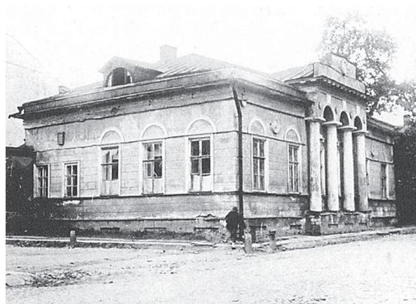
Дом Лопатиных на углу Хрущёвского и Гагаринского переулков