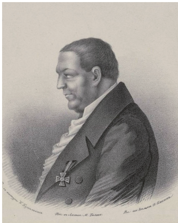
Доктор Федор Петрович Гааз