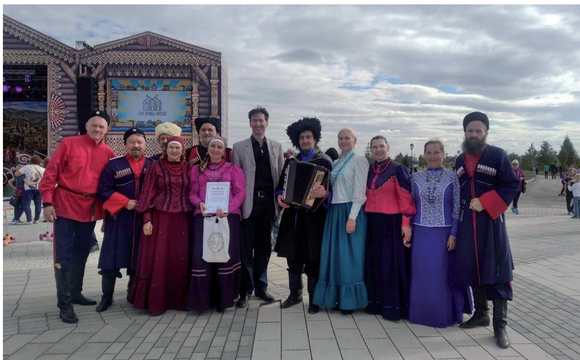
Открытие этнокультурного комплекса «Парк дружбы народов» в микрорайоне «Волгарь» г. Самары. 2021 г.

В сентябре 2021 г. активисты организаций «Самарское казачье землячество» и «Ассамблея народов Самарской области» приняли участие в торжественном открытии этнокультурного комплекса «Парк