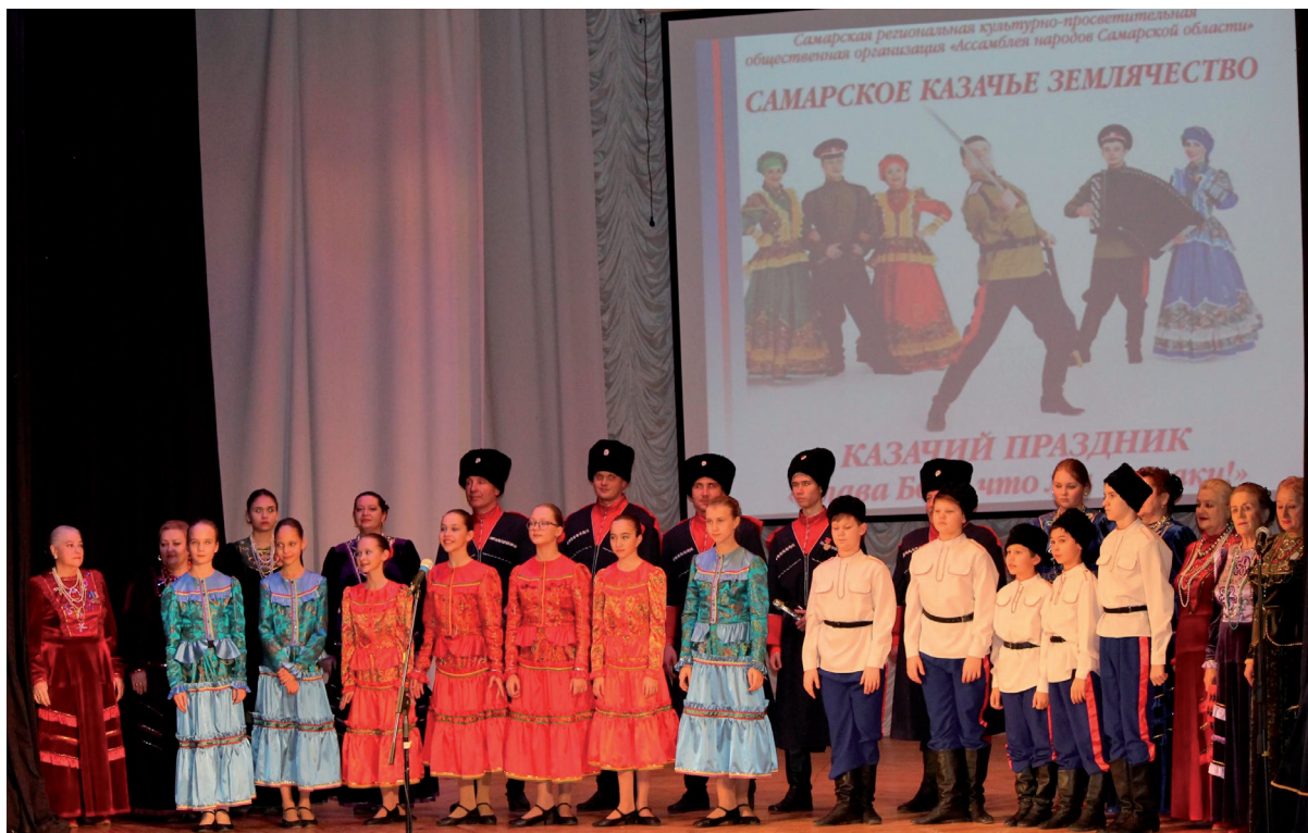
Праздник «Слава Богу, что мы – казаки!» во Дворце культуры железнодорожников имени А. С. Пушкина г. Самары. 2019 г.

Репертуар ансамбля постоянно обновляется, а высокое исполнительское мастерство артистов приносит коллективу заслуженный успех. 16 декабря 1999 г. постановлением губернатора Самарской области «за возрождение и развитие культуры казачества и высокий профессионализм» ансамблю было присвоено звание Государственного. Более 200 раз коллектив награждался дипломами и грамотами различных государственных, муниципальных и общественных организаций: в августе 2007 г. – дипломом Министра обороны РФ – за активное участие в культурно-досуговом обеспечении участников международных антитеррористических учений «Мирная миссия – 2007» (г. Чебаркуль Челябинской обл.); в сентябре 2008 г. – дипломом командующего Сухопутными войсками Министерства обороны РФ – за культурно-досуговое обеспечение Всероссийских военных учений «Центр – 2008» (п. Донгуз Оренбургской обл.); 13 марта 2009 г. – дипломом за участие в праздничном юбилейном концерте, посвященном 40-летию образования Службы специальных объектов при Президенте РФ (культурный центр ФСБ РФ, г. Москва); в сентябре 2011 г. – дипломом Министерства обороны за активное участие в культурном обеспечении Всероссийских воинских учений «Центр – 2011» (г. Чебаркуль Челябинской обл.).