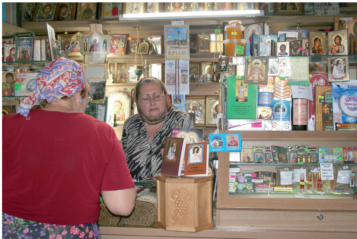
Церковная лавка в Петропавловском соборе. Крым, г. Симферополь. Фото Т. А. Листовой, 2012 г.

В иконной лавке Новгород-Северского монастыря, куда приезжают туристы и паломники из разных уголков Украины, нам пояснили: «Много покупают Остробрамскую от чародейства, Божью Мать Нерушимая Стена. Казанскую – она покровительница семейная, ее на венчание. Это и люди сами знают». Перечисление наиболее популярных икон показывает отсутствие каких-либо предпочтений по этническому признаку, при этом в число популярных входят регионально известные иконы: «Очень часто Ахтырская, Казанская, Покрова, Троеручица, Неопалимая Купина, очень часто Никола Чудотворец, Господь Вседержитель. Тихвинская редко, Иверская редко. Есть Леньковская и Новодворская. Они были в монастыре, потом исчезли. Сейчас их списки. Дело в том, что они были, их знают, они связаны с Новгород-Северским. Это наши, характерные для нашего региона. Леньковская – Прообраз Касперовская. (– Что-то украинское чувствуется в предпочтениях икон, в наборе икон? – Т. Л.) Нет». Конечно, нужно учитывать, что речь идет о пограничной с Россией Черниговской обл., где исторически складывалась культурная общность. Судя по опросам в 2013 г., даже радикально (по отношению к России) настроенные киевляне не изменили уже