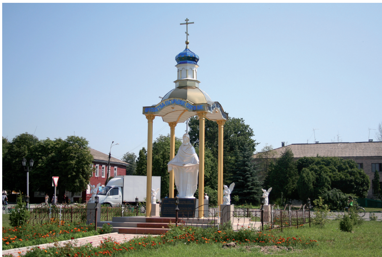
Скульптурный образ Покрова Пресвятой Богородицы. Черниговская обл., Черниговский р-н, г. Городня.

ского, выглядит церковная, популярная и в народе легенда об обнесении Москвы Тихвинской иконой Божьей Матери, после чего был освобожден Тихвин и началось контрнаступление под Москвой. Таким образом в конкретных ситуациях реализовывалась интегрирующая идея нераздельности страны как единого пространства, находящегося под покровом Божьей Матери. Атеистическое воспитание советского времени было рассчитано на решение земных задач, Великая Отечественная война, с ее запредельными ужасами, потребовала от человека обращения за помощью к небесным силам, поэтому единственной надеждой на спасение нередко становилась помощь свыше. Рассказы о явлениях Божьей Матери во время войны, а такие, по-видимому, имели хождение в войсках, несмотря на идеологический контроль, сохраняются и сейчас как религиозный фольклор или же как нарративы в семьях фронтовиков. Однако в них соучастие Богородицы заключается лишь в оказании помощи определенным лицам или группе лиц, об изгнании врага и спасении страны речь не идет. Меняется и образ Богородицы: она предстает уже не в виде Всепобеждающей Небесной Заступницы, а в виде скромной женщины в черном одеянии.