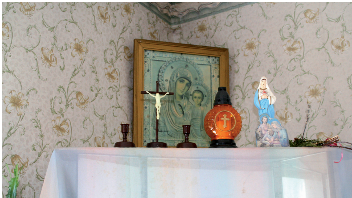
Оформление святого угла в семье католиков. Витебская обл., Россонский р-н, пгт. Россоны. Фото Т. А. Листовой, 2012 г.

стену [икону] вешают. У меня там Божья Мать Заступница. (– Это какая? Казанская? – Т. Л.) Нет, просто Божья Мать, заступница говорят. Мы в Шклове были в церкви и там покупали. Это Мать Заступница, она предостерегает ото всех несчастных случаев детей, дом, скотину. Она очень нужна в доме. Там нет ребенка, одна мать. В кошельке Владимирская, это надо, чтобы деньги водились» (д. Старый Дедин Хотимского р-на Могилевской обл.).