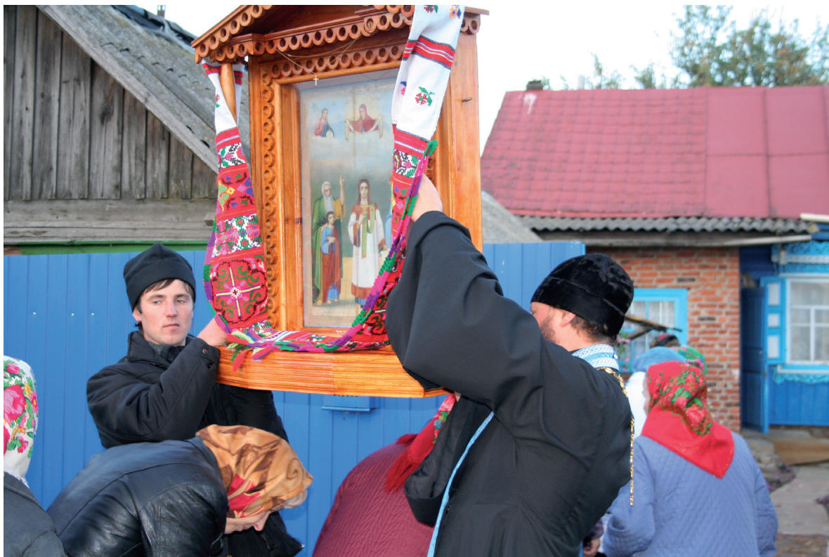
Люди проходят под почитаемой иконой Покрова Пресвятой Богородицы у дома Марфы Огородной на праздник Покрова. Брянская обл., Красногорский р-н, с. Яловка. 2012 г.

мирского княжества. 1. Преемственность Владимиром традиций Киевской Руси. В подтверждение этого во Владимире в 1158–1160 гг. строится Успенский собор по образу киевского храма, но более величественный и нарядный. 2. Декларация особого покровительства Божьей Матери над Владимирской землей, а также начало государственного почитания древней чудотворной иконы Вышгородской, получившей далее название Владимирской. Кроме активного строительства богородичных храмов, а таковыми были все храмы, построенные им с 1158 по 1165 г., он устанавливает новый, ставший впоследствии одним из наиболее любимых русским народом, праздник – Покров Божьей Матери. Как показывает дальнейшая история, заложенная в празднике идея как нельзя лучше соответствовала религиозно-психологическим запросам русских, расширяя пределы спасения: индивидуальная защита коррелировалась и укреплялась чувством нахождения в том православном пространстве, над которым раскинула свой материнский покров Богородица. Под православной землей мыслились, естественно, и земли будущих украинцев и белорусов.