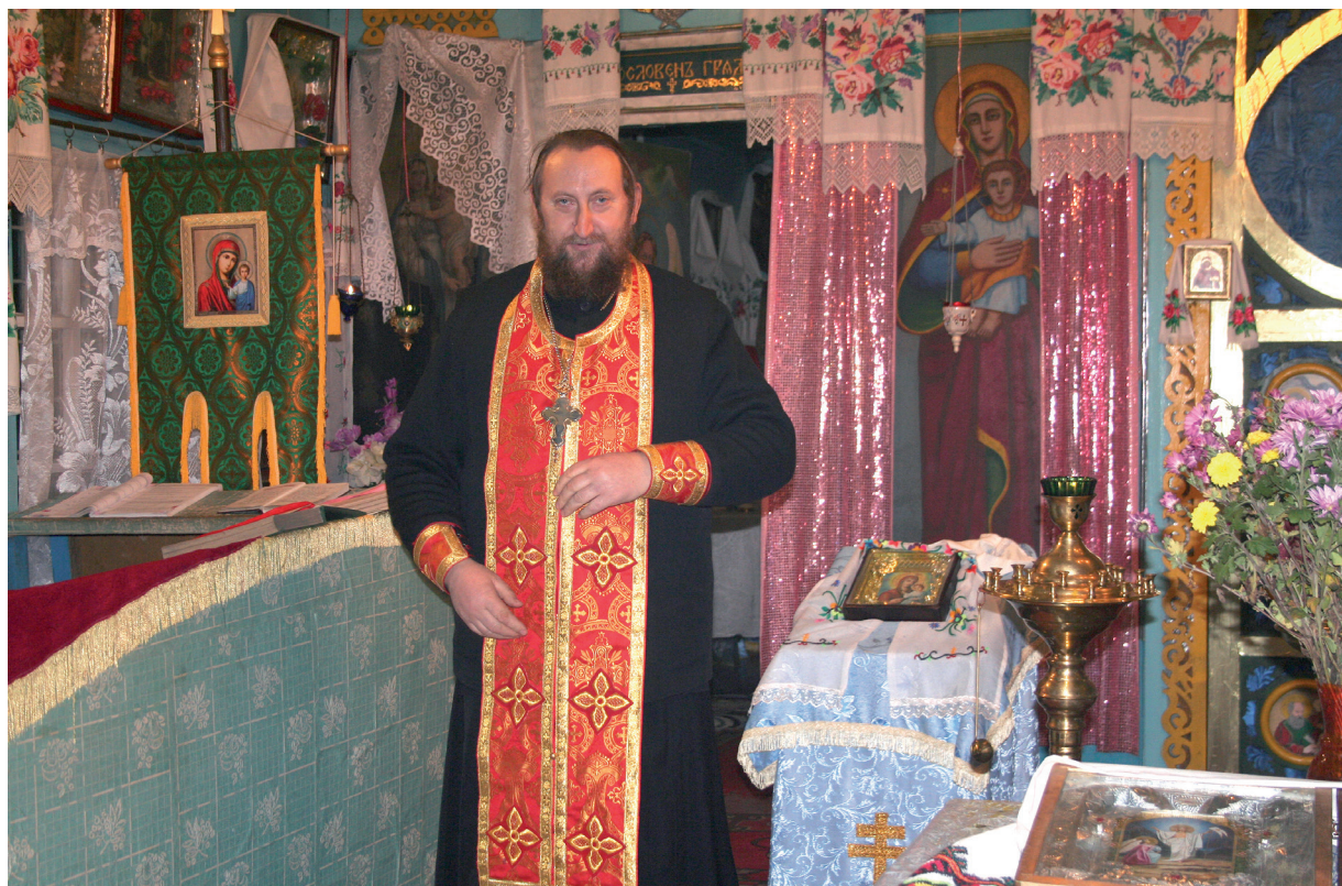
Казанская икона Божьей Матери в церкви с. Воробьевка Новгород-Северского р-на Черниговской обл.

также могли прославиться чудотворениями, или подлинники. Сбор местночтимых святынь должен был придать Москве статус духовного центра. Наибольшее число чудотворных икон было сосредоточено в храмах Московского Кремля. Имея в виду концентрацию святости в его стенах и высочайший сакральный статус, М. Ю. Лермонтов с полным основанием назвал Кремль «алтарем России».