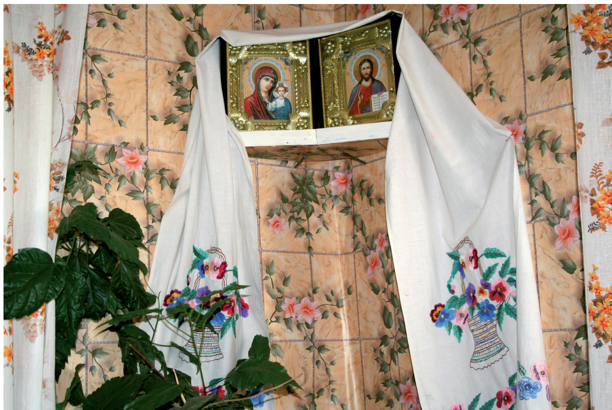
Свадебные иконы в доме. Черниговская обл., Сновский р-н, с. Гута Студенецкая. Фото Т. А. Листовой, 2012 г.

от спасения Отечества до покровительства семье и браку. В народной религиозности она повсеместно позиционируется как «многофункциональная», как изначальная Заступница всех, ищущих ее помощи. Сам термин обязан своим происхождением, видимо, началу акафиста, посвящённого данной иконе: «Заступнице усердная, Мати Господа Вышняго, за всех молиши Сына твоего Христа Бога нашего».