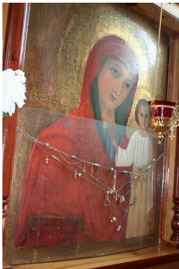
Казанская икона Божьей Матери в храме пгт. Россоны Россонского р-на Витебской обл. Фото Т. А. Листовой, 2012 г.

Естественно, что 1917 г. положил конец любым вариантам включения Богородицы в государственную идеологию и государственно-общественную праздничную практику. Но тотальное наступление на религию не принесло ожидаемых изменений в сознании людей. Стремление новых идеологов переориентировать его исключительно на рациональное осмысление мира натолкнулось на вековые традиции, актуальность которых во все времена опиралась на обращение к силам более могущественным, нежели возможности человека. С начавшегося в 1990-е годы религиозного ренессанса и протекционистской позиции власти в отношении Церкви, с одной стороны, и возросшего интереса к дореволюционному прошлому, с некоторой долей его идеализации, – с другой, в обществе раздаются голоса в пользу привнесения или даже полного возвращения православного фактора в государственную идеологию. По мнению сторонников конфессионализации внутривнутриполитической системы, данная стратегия способствовала бы консолидации русских, а равно и всех православных, что было актуально в сложные годы существования новой России, кроме того,