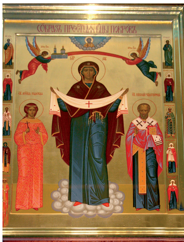
Икона Покрова Пресвятой Богородицы. Подарена в Покровскую церковь с. Яловка Красногорского р-на Брянской обл. Справа и слева от Богородицы – свт. Николай и св. Надежда – по именам дарителей.

Это государство было теократическим, одной из идеологических основ его внутриполитической доктрины являлась основная религия государствообразующего (титульного) народа – православие. Оживление религиозных чувств, точнее, возвращение религии в светскую жизнь после 1991 года стало причиной поисков интегрирующего фактора в православной идее, воспринимавшейся русскими как этническая составляющая, актуализация которой могла бы дать дополнительный импульс к укреплению их единой самоидентификации. В поле интеграционного воздействия вошли бы и другие народы России, исповедующие православие. Эти соображения определили политику Церкви, проводившуюся при патерналистическом отношении