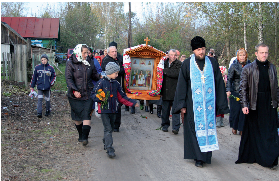
Перенесение почитаемой иконы Покрова Пресвятой Богородицы из храма в дом Марфы Огородной в праздник Покрова. Брянская обл., Красногорский р-н, с. Яловка. 2012 г.

Оптика моего исследования определена общим вопросом, не теряющим своего значения и в наши дни: какую роль играют религиозные факторы в самоидентификации народа и чувстве единой идентичности. В данной статье я постараюсь показать некоторые аспекты почитания Богородицы с точки зрения интеграционных возможностей ее культа в пространстве православия в России и на сопредельных восточнославянских территориях в сопостав-